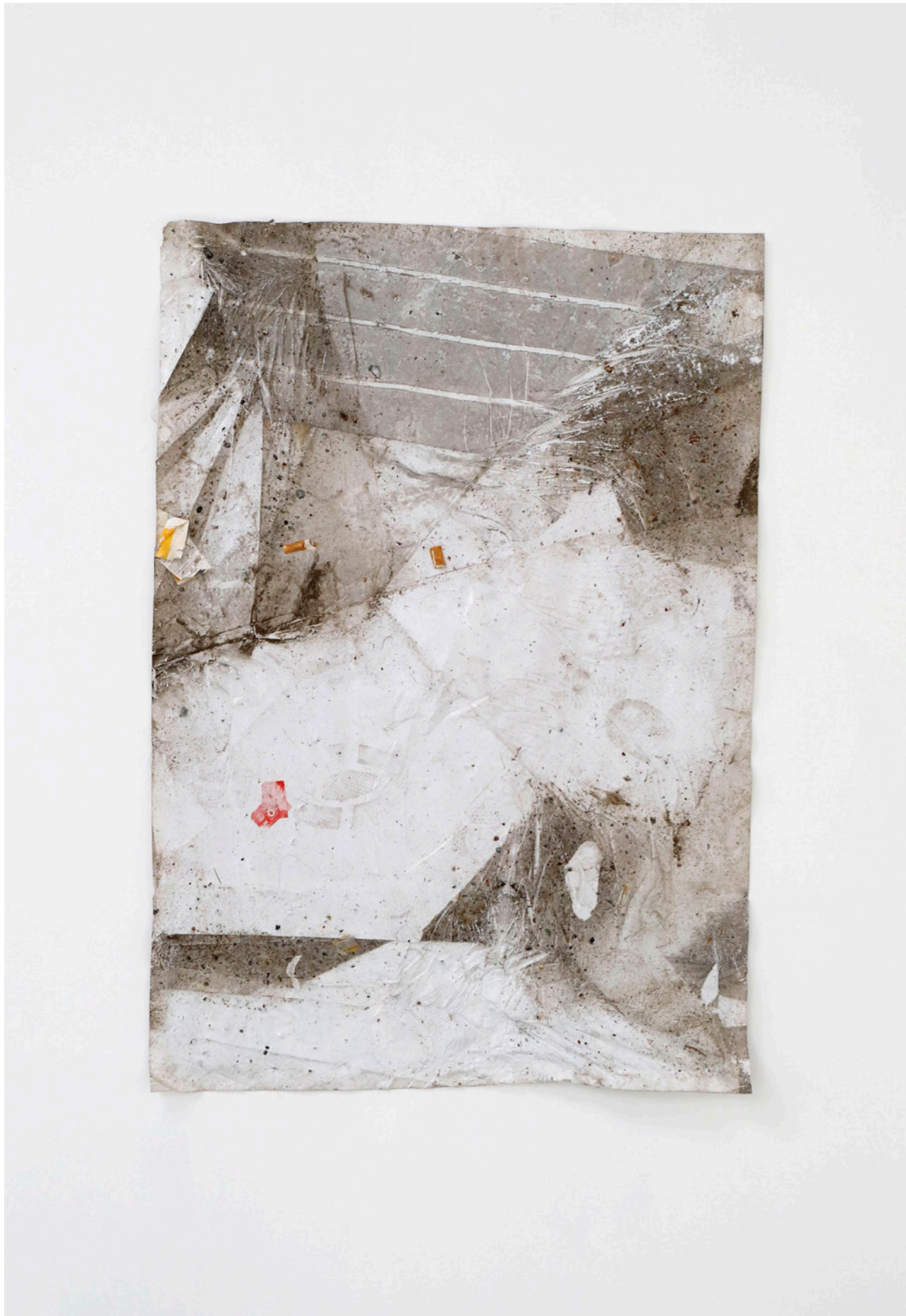
Affiche , 2018, affiche autocollante trouvée dans la rue, 70x100 cm, photo Camille Kerzerho Les Remplaçants , 2019, EESAB, Rennes