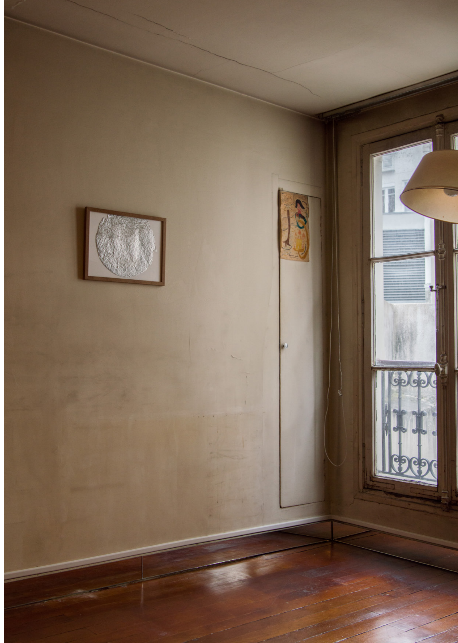
Ci- contre : Bonne Anés , 2021, installation, dimensions variables, photo Meghan Maucherat de Longpré Bonne Anés , 2021, Paris