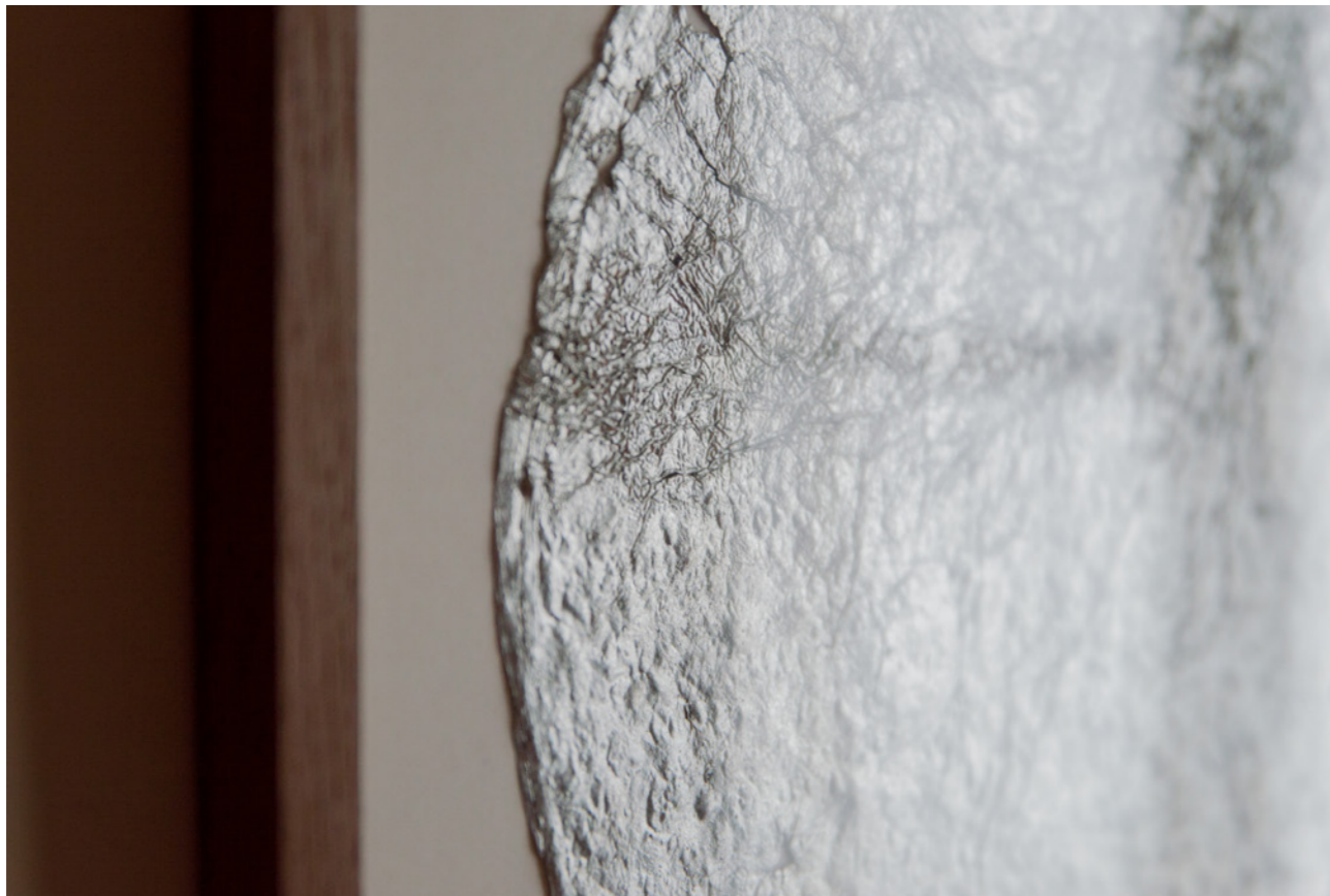
Bonne Anés , 2021, installation, dimensions variables, photo Meghan Maucherat de Longpré Bonne Anés , 2021, Paris