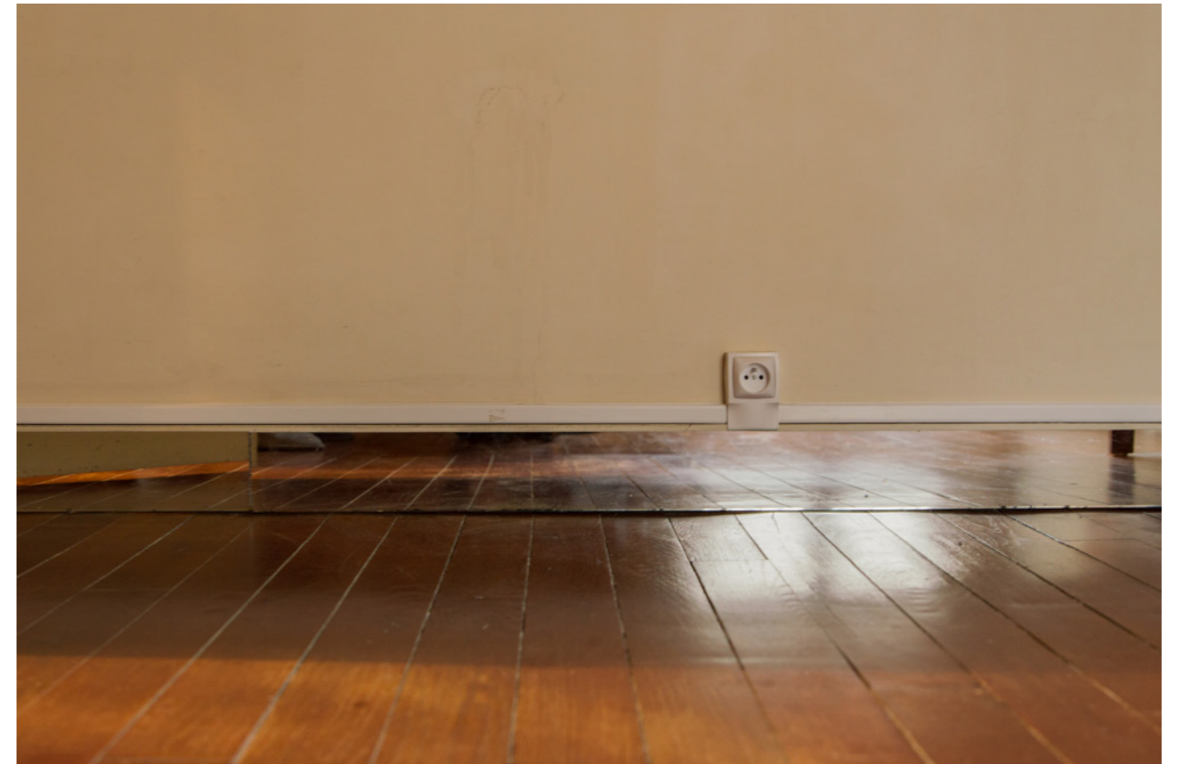
Bonne Anés , 2021, installation, dimensions variables, photo Meghan Maucherat de Longpré Bonne Anés , 2021, Paris