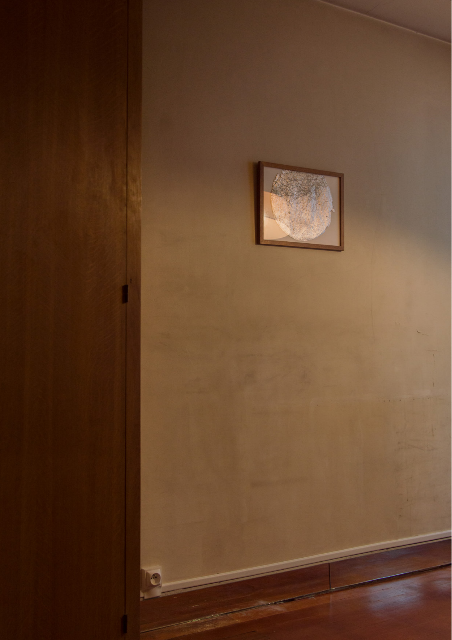
Ci-contre : Bonne Anés , 2021, installation, dimensions variables, photo Meghan Maucherat de Longpré Bonne Anés , 2021, Paris