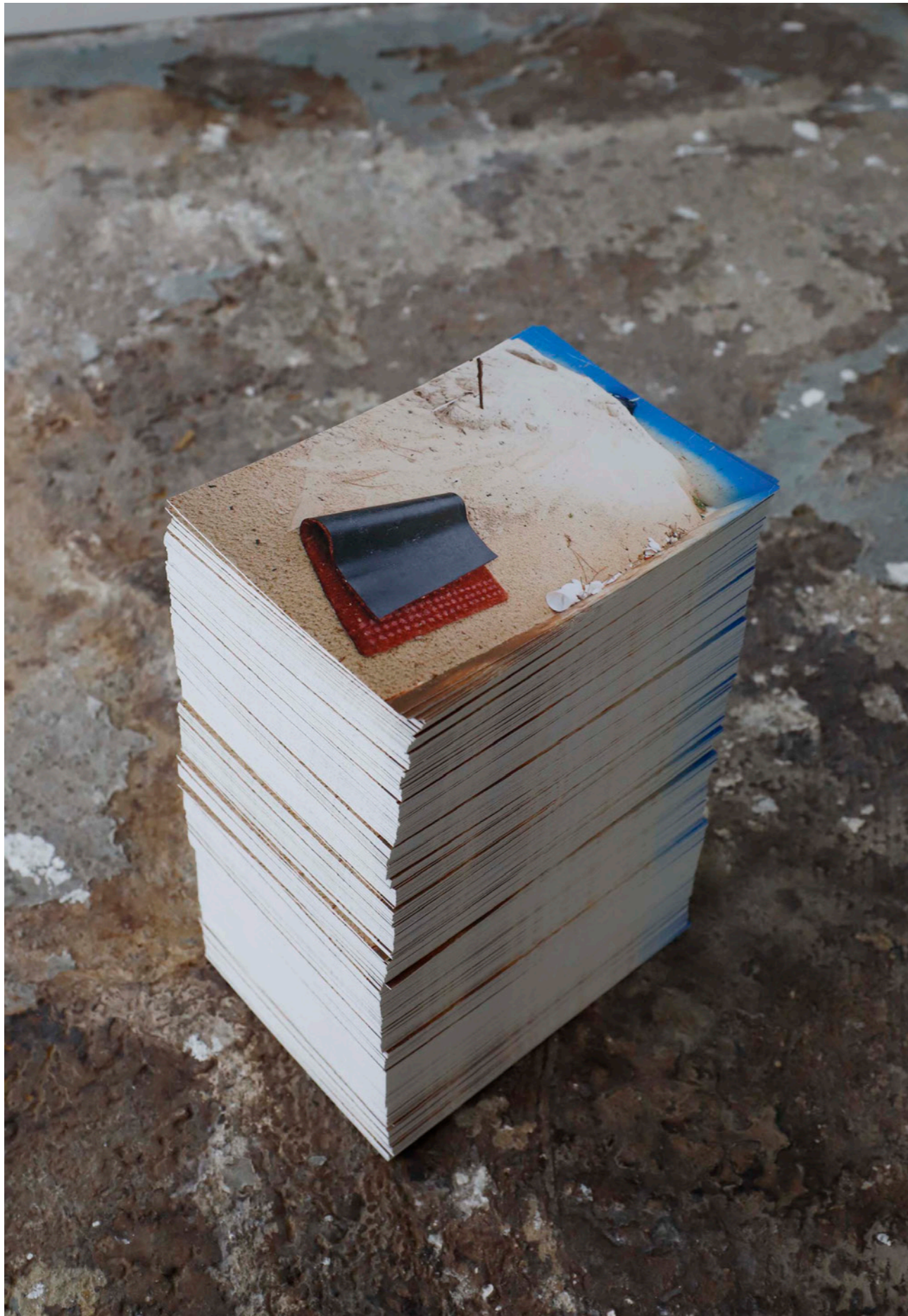
Benne à ordure qui devient une image touristique , 2019, cartes postales, dimensions variables, photo Camille Kerzerho Les Remplaçants , 2019, EESAB, Rennes