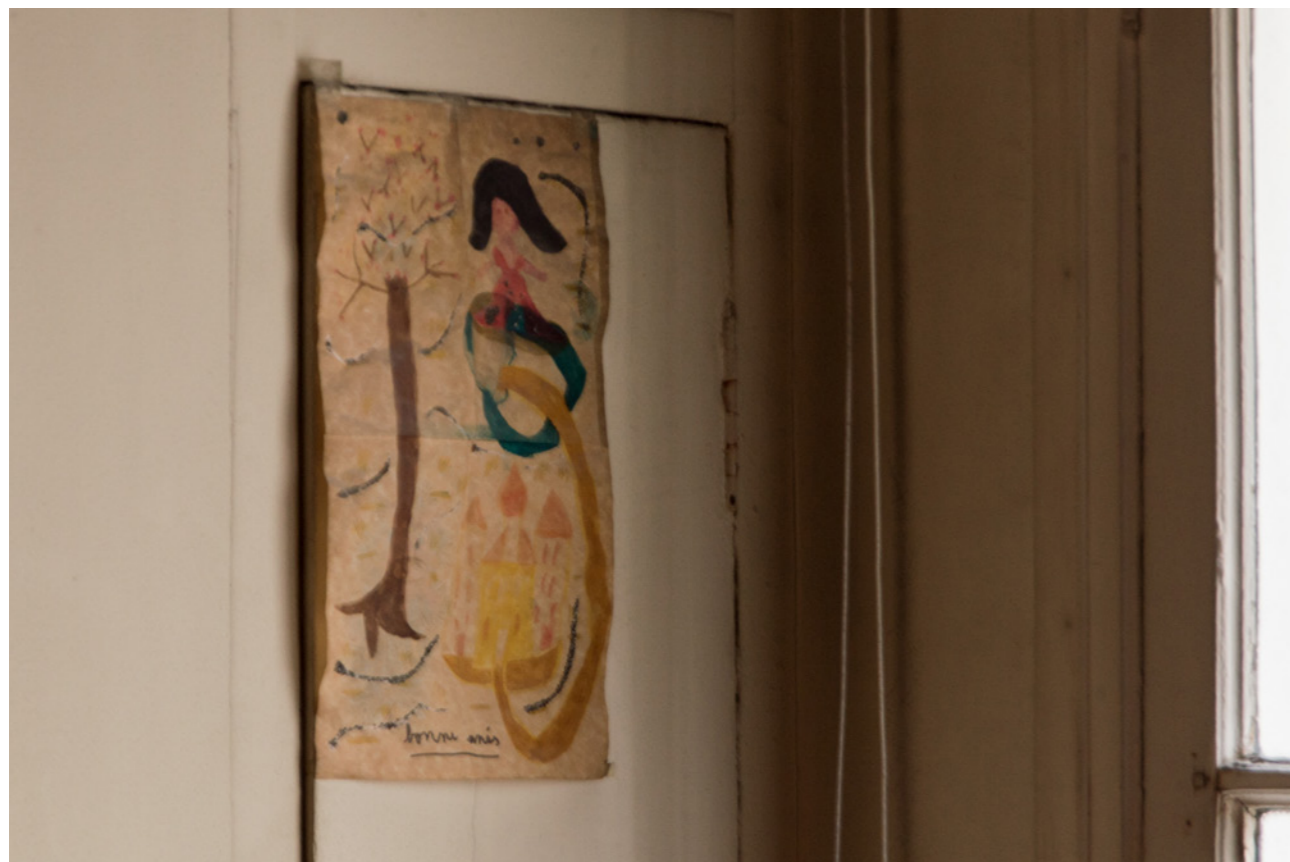
Bonne Anés , 2021, installation, dimensions variables, photo Meghan Maucherat de Longpré Bonne Anés , 2021, Paris