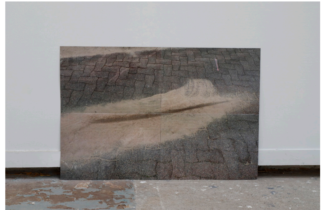
Photoscotch , 2019, impressions A3, rubans adhésifs, 80x60 cm, photo Camille Kerzerho Les Remplaçants , 2019, EESAB, Rennes