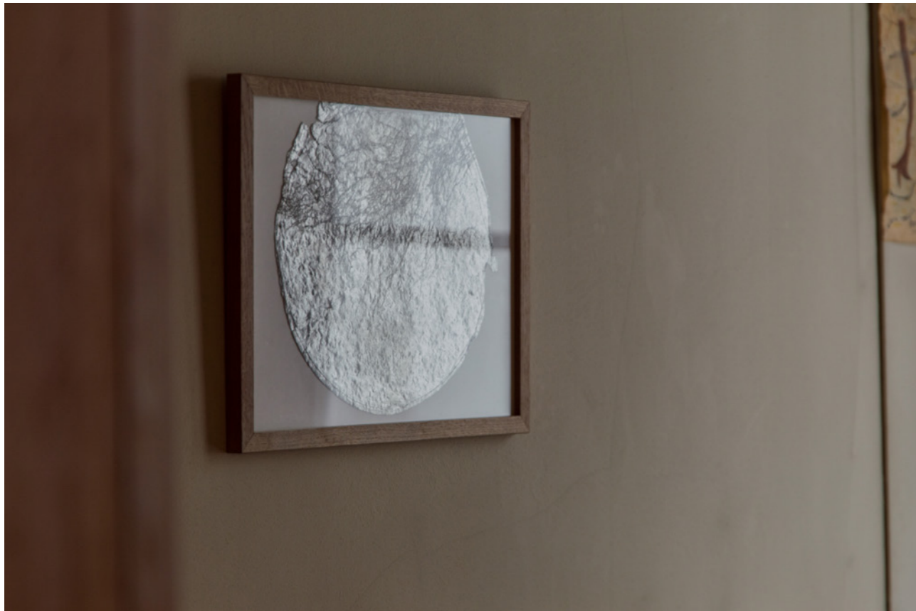
Bonne Anés , 2021, installation, dimensions variables Bonne Anés , 2021, Paris