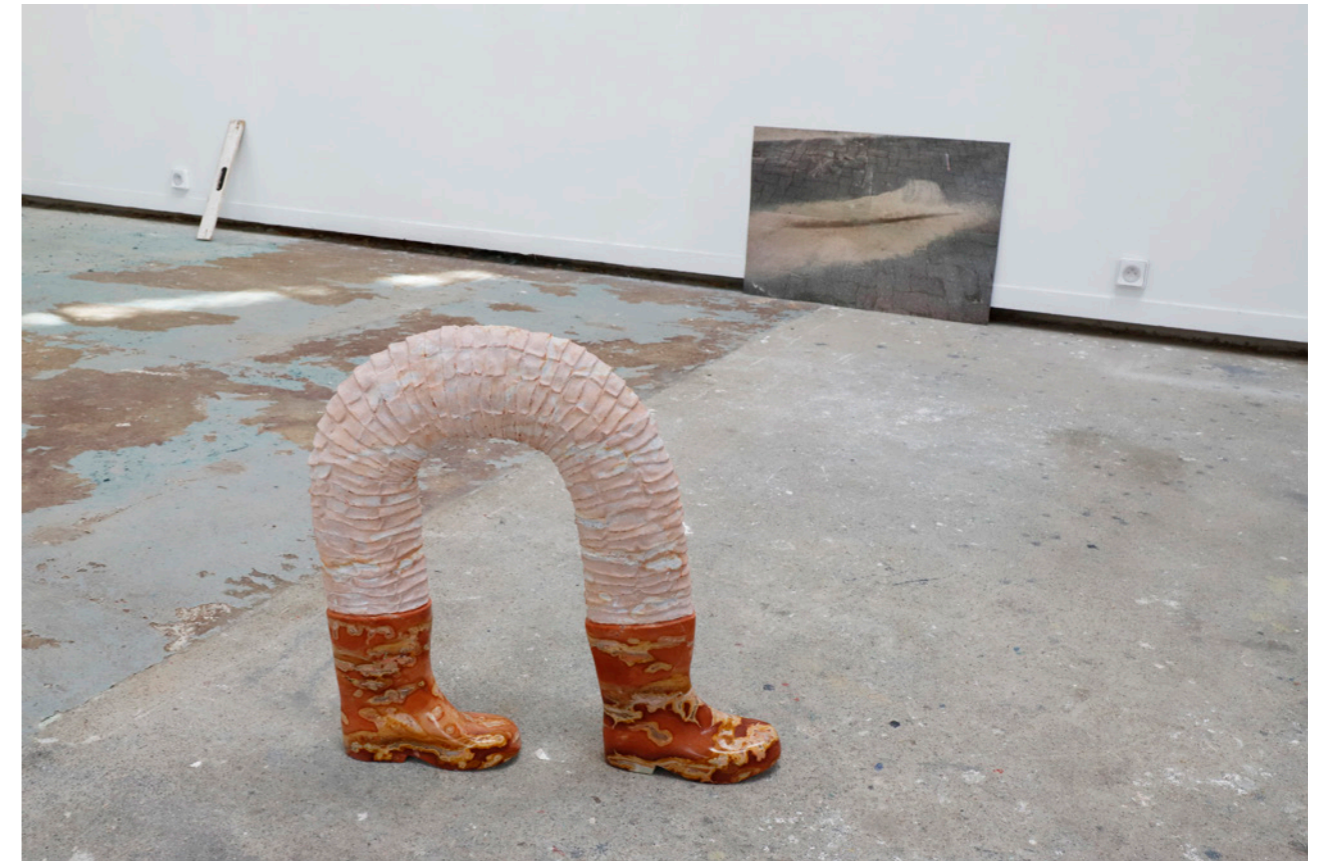
Bottes et Tuyau , 2018, marbre rouge, 8x50x50 cm, photo Camille Kerzerho Les Remplaçants , 2019, EESAB, Rennes