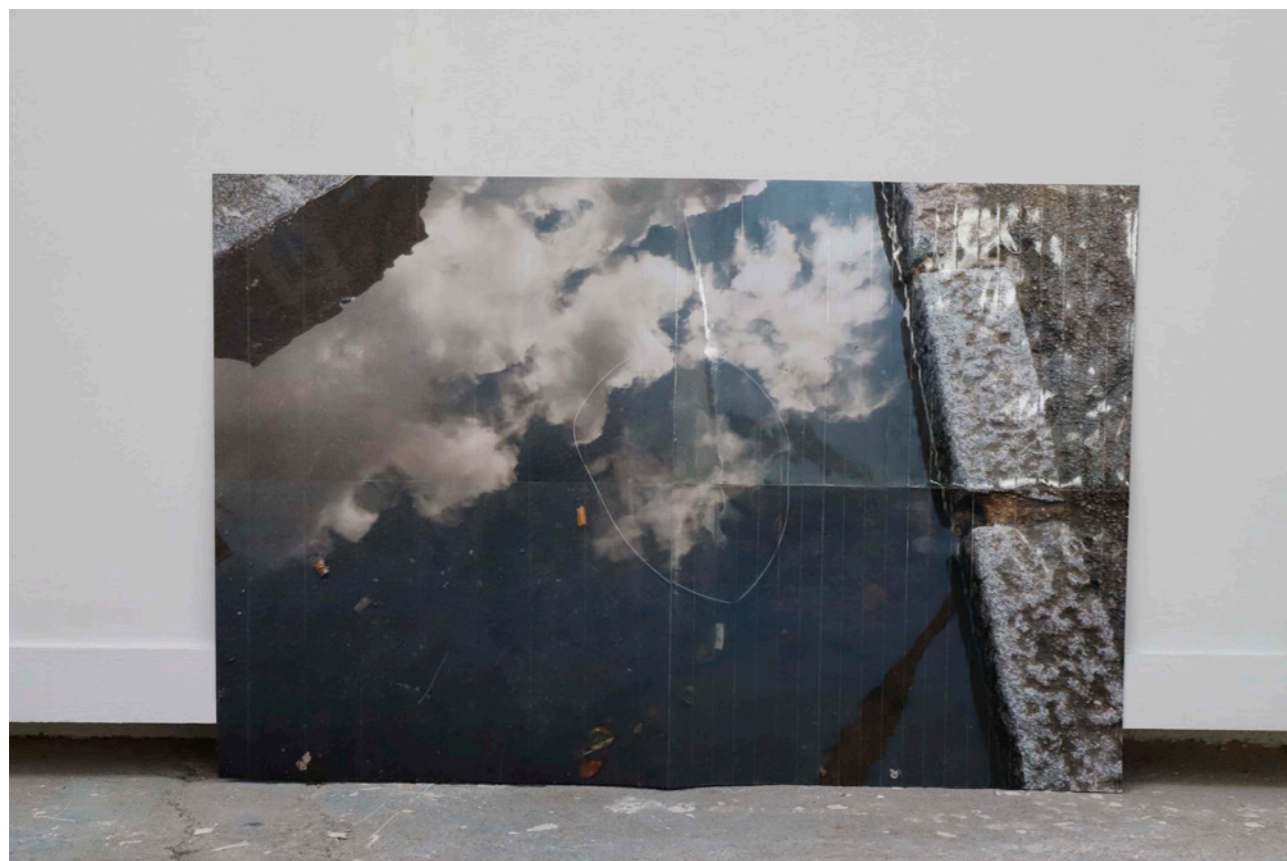
Photoscotch , 2019, impressions A3, rubans adhésifs, 80x60 cm, photo Camille Kerzerho Les Remplaçants , 2019, EESAB, Rennes

Ci-contre : Les Remplaçants , 2019, installation, dimensions variables, photo Camille Kerzerho Les Remplaçants , 2019, EESAB, Rennes