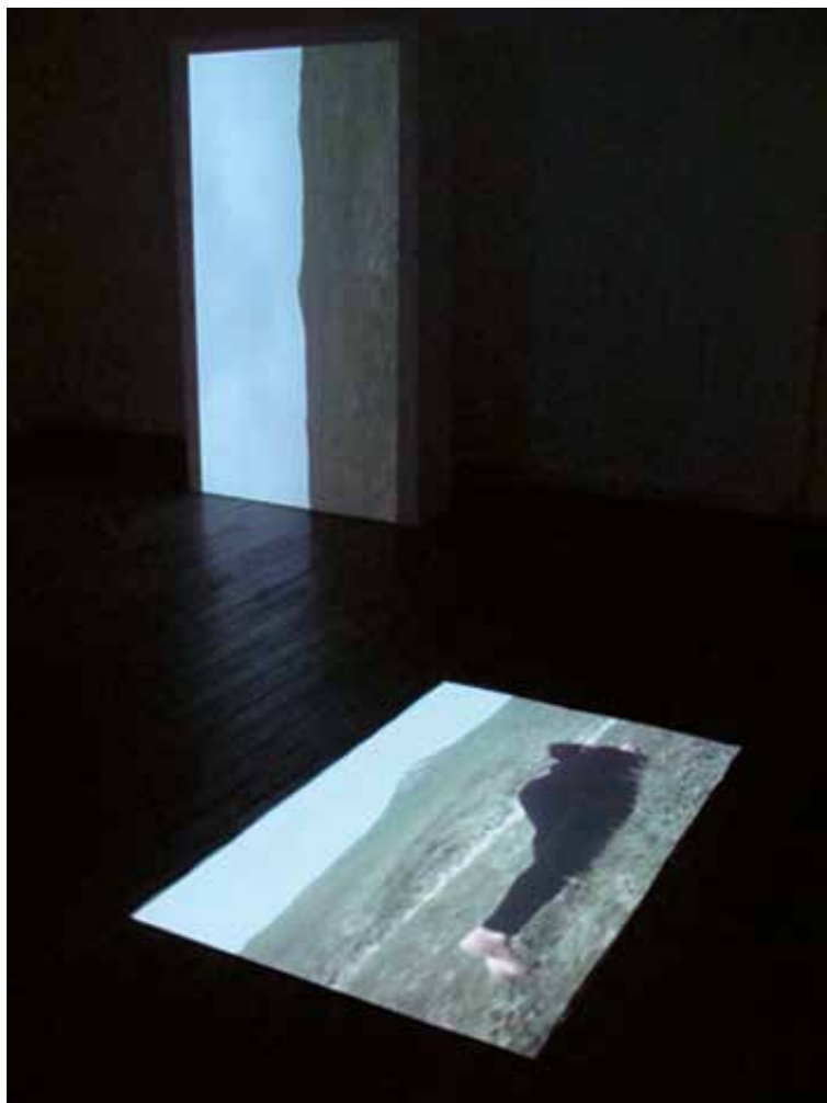
Ascension terrestre, capture d'écran (droite) et vue de l'installation-vidéo (gauche).