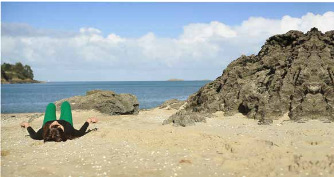
Plage, vert, déserte (panorama), photographie numérique.