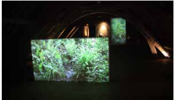
Balade au vent, capture d'écran et vues de l'exposition Jardins sensibles - Jardins secrets.