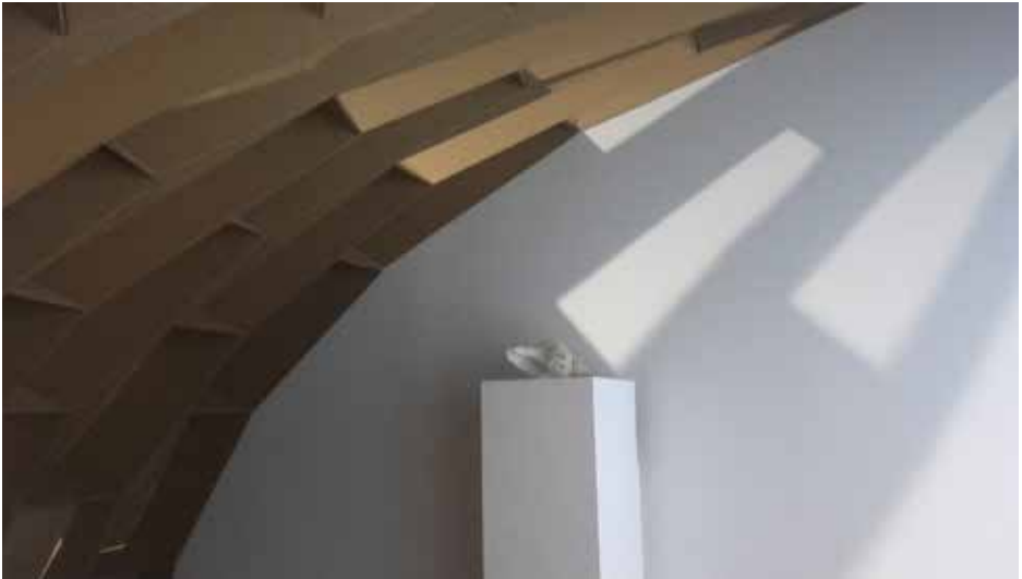
Vues de l'exposition Itinéraires du hasard .