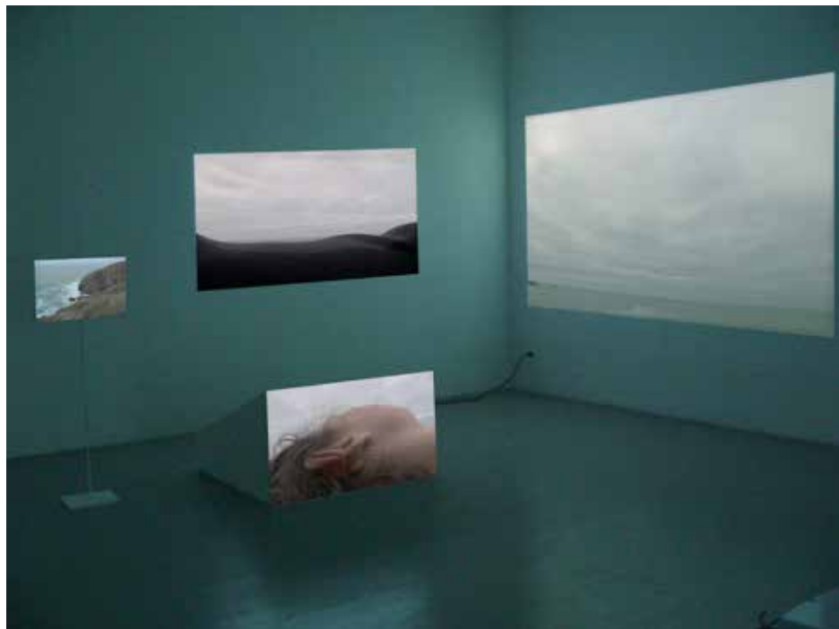
Pointe du vent, capture d'écran (droite) et vue de l'installation-vidéo (gauche).