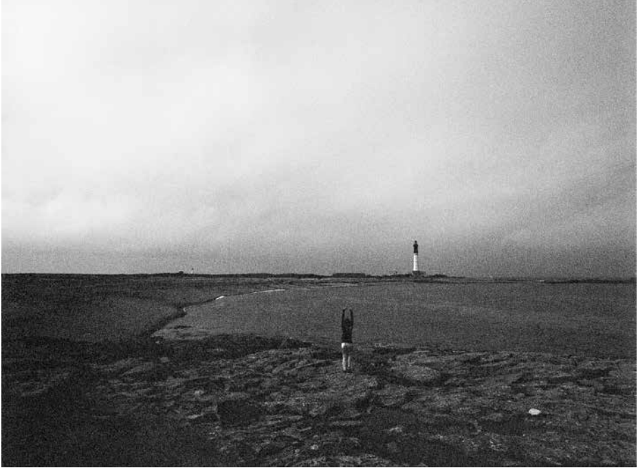
Ô mon île, Ô mon sein, photographies argentiques.