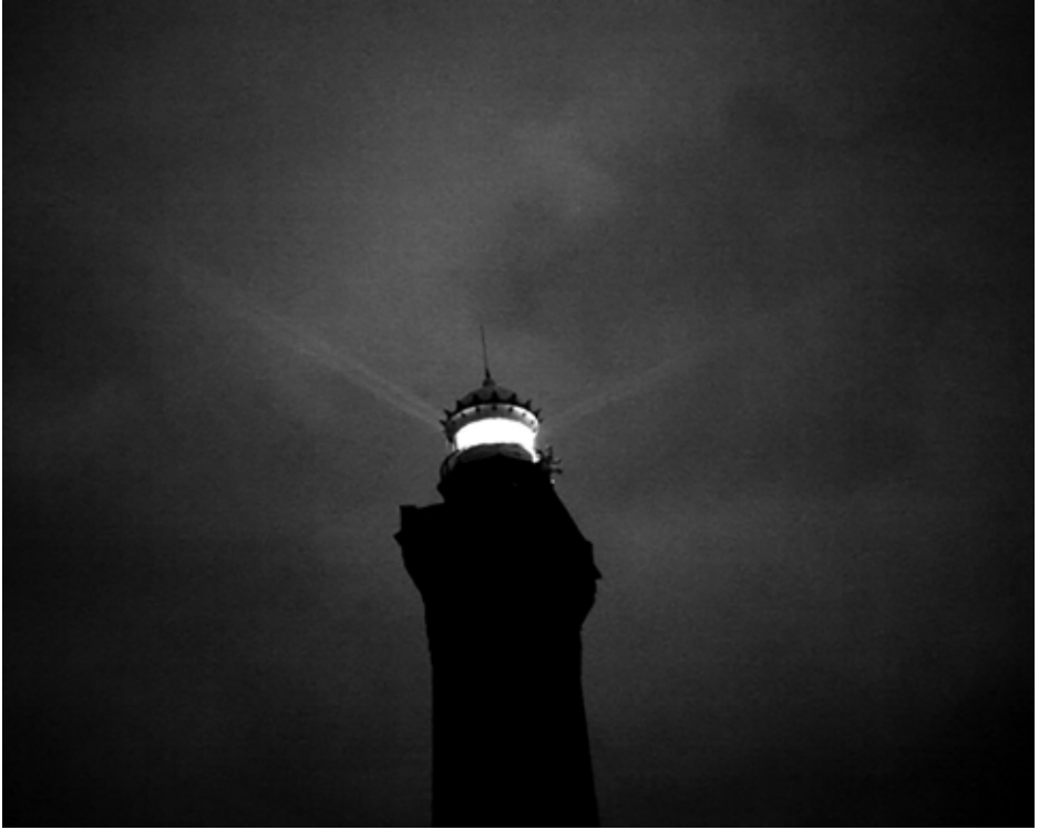
Le phare (une nuit), captures d'écran.