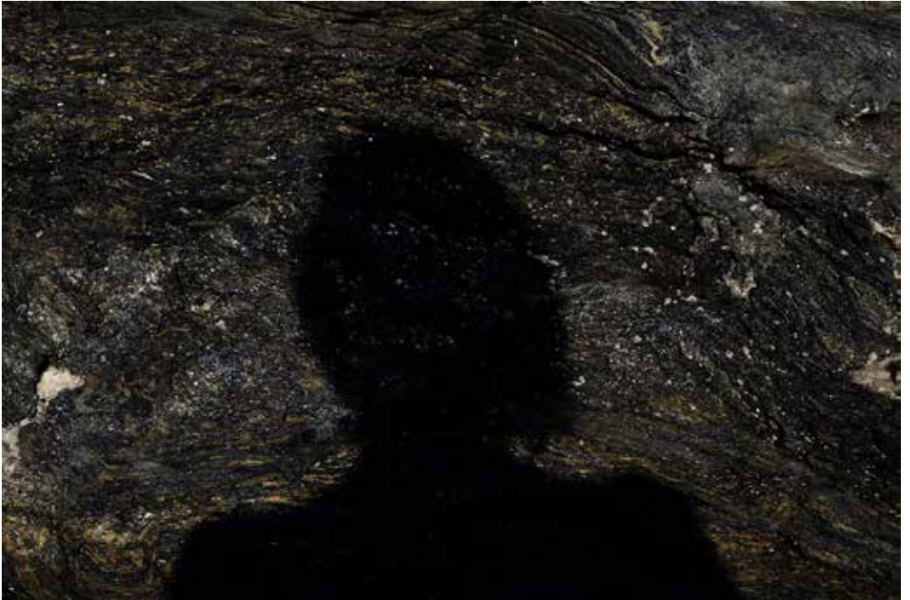
esteile (diptyque), extrait de la série.