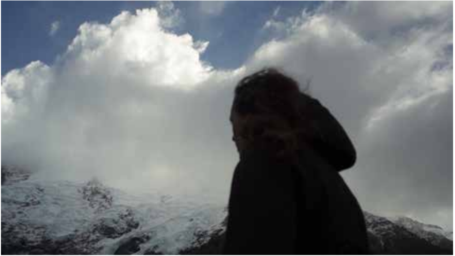
Aoraki m'était soufflé, captures d'écran.