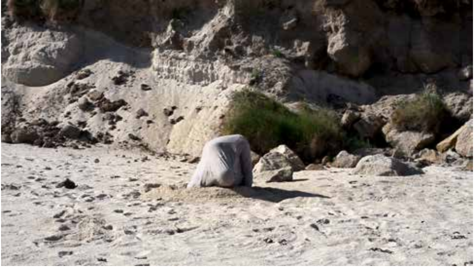
Neptunea Islandica , captures d'écran.