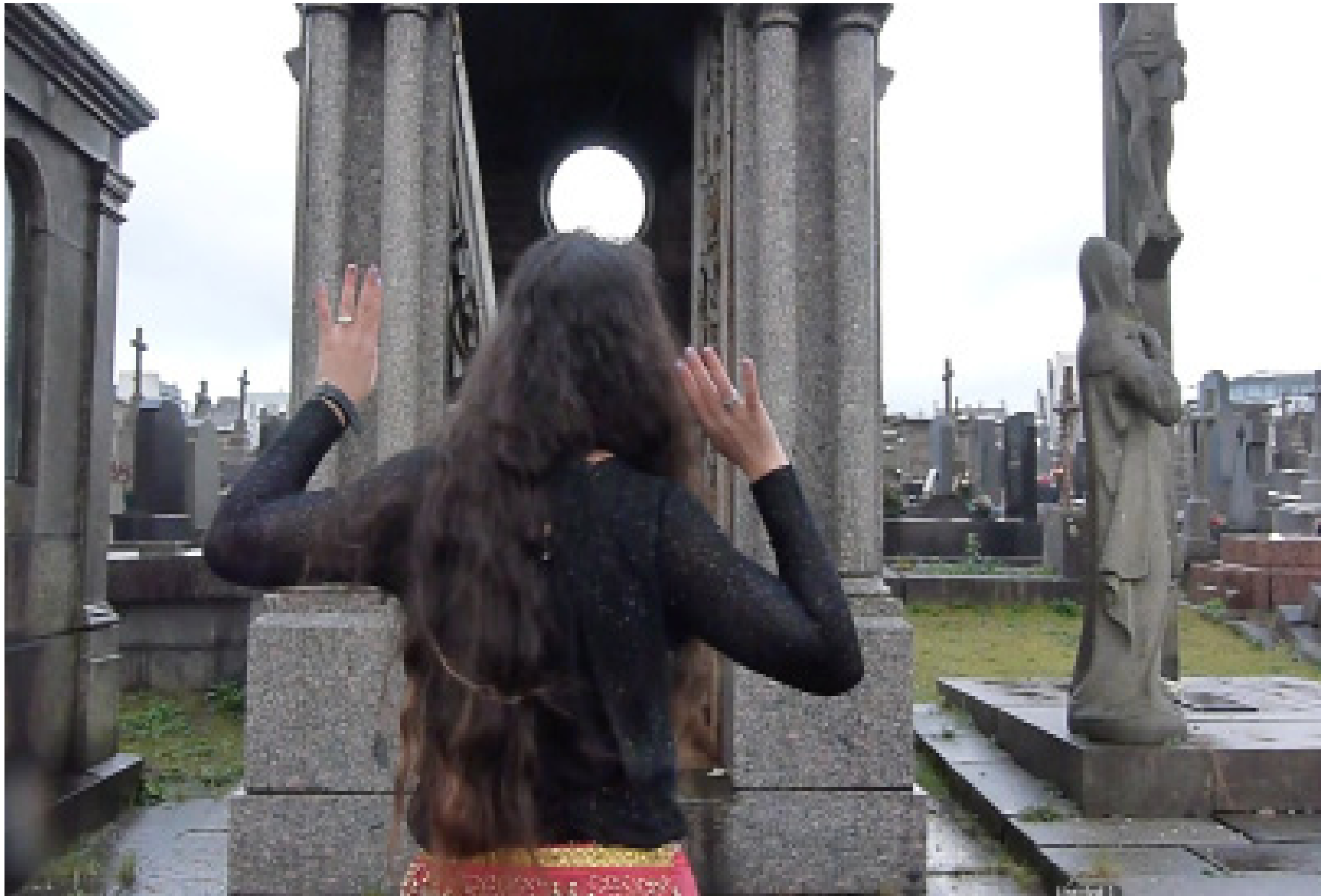
Leila danse , 2015, capture d'écran, 3 minutes, son, couleur