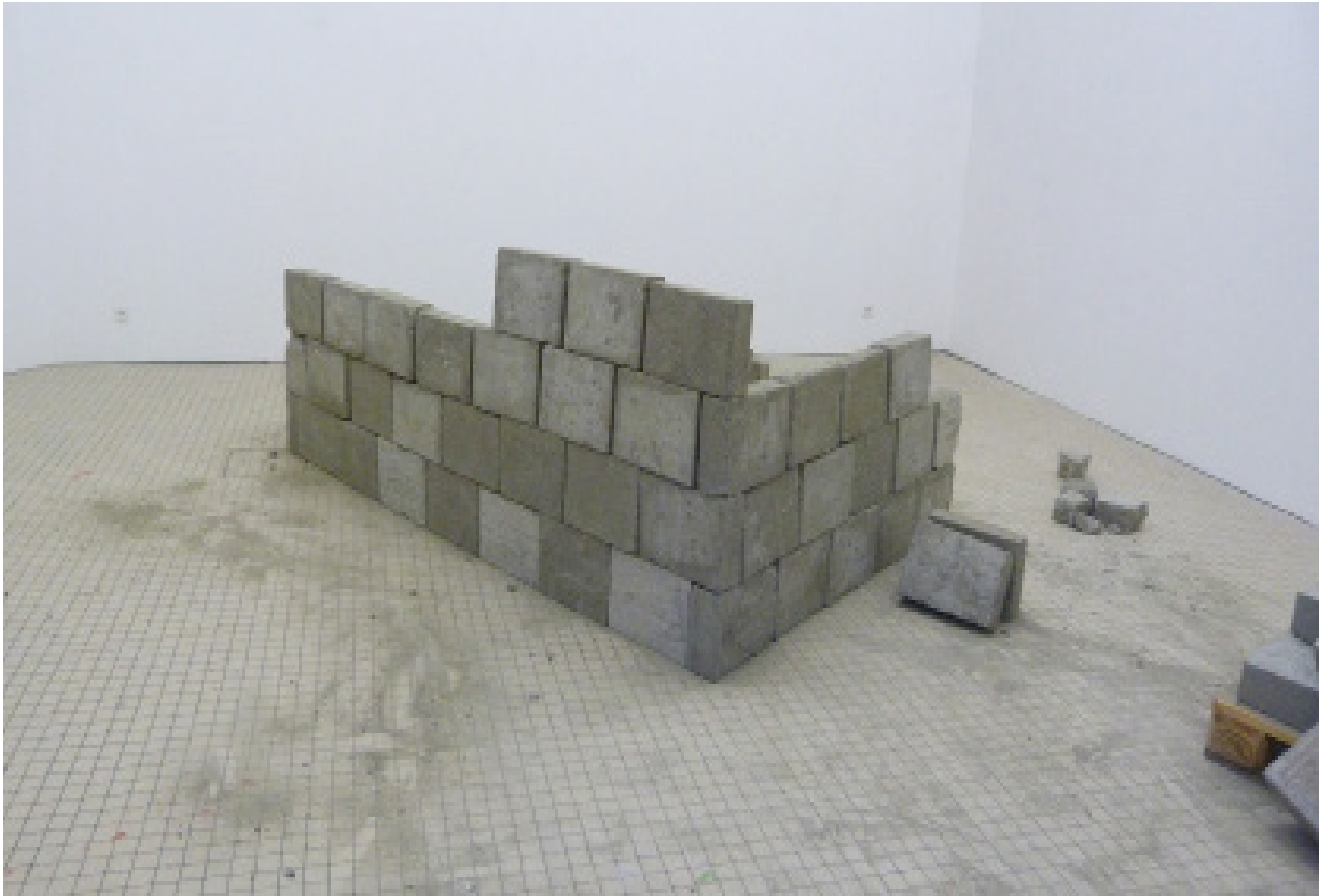
Mur en béton: variables dimensions ; 79 parpaings, poussière 240 X 20 X 17 cm