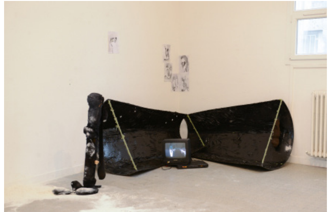
Différents médiums: vidéo sur moniteur, 6 dessins au feutre noir sur feuille A4, sculpture (fils de laine, plastiques, collants, farine)