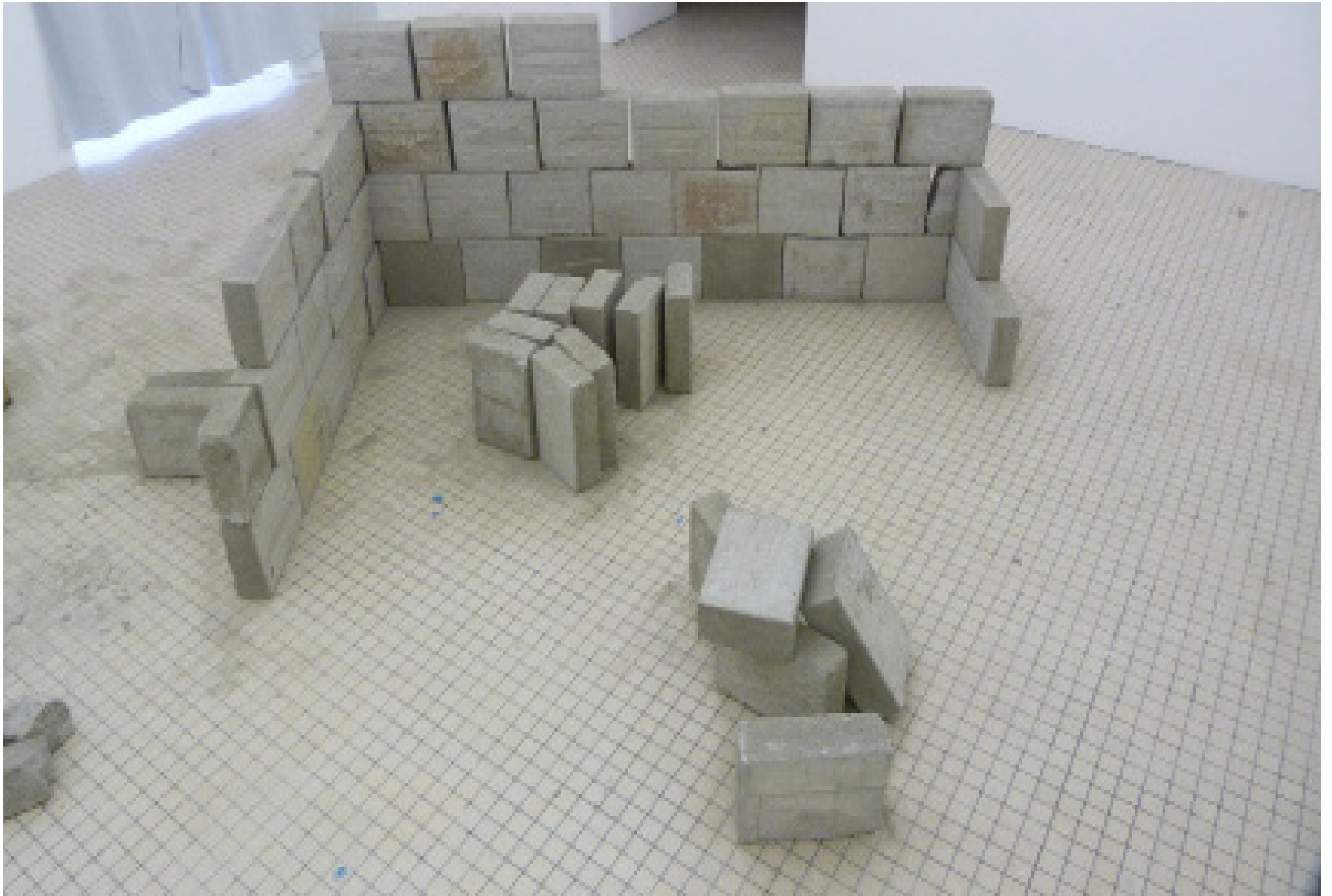
Papa: vue globale de la pièce: 79 parpaings de béton, poussière