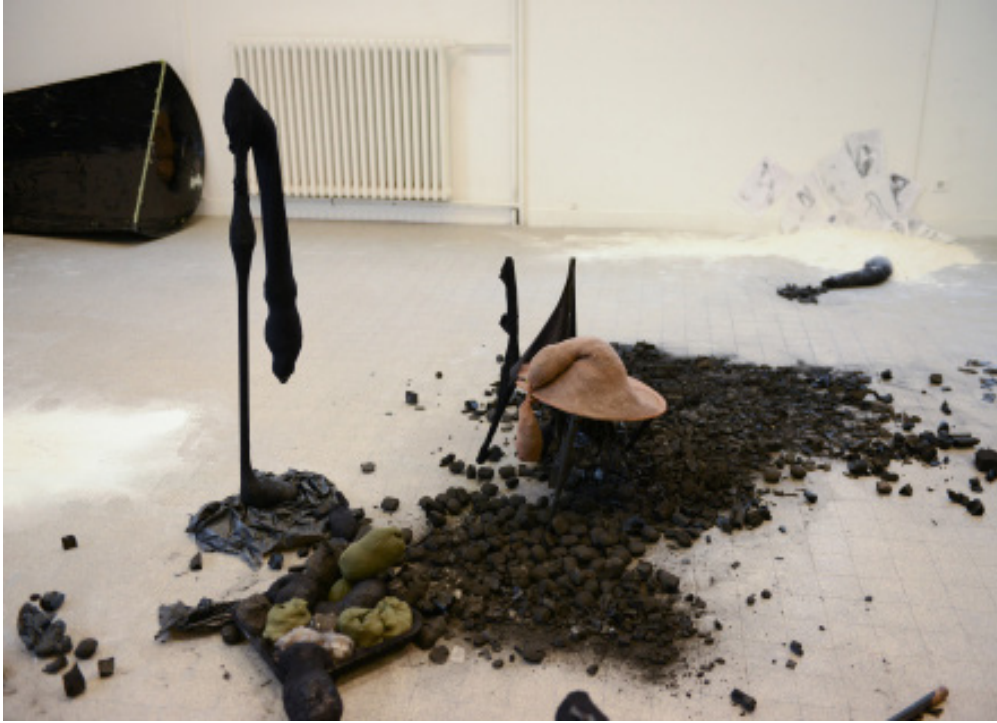
Vue globale de l'installation: différents matériaux: vidéo, sculptures, dessins,...