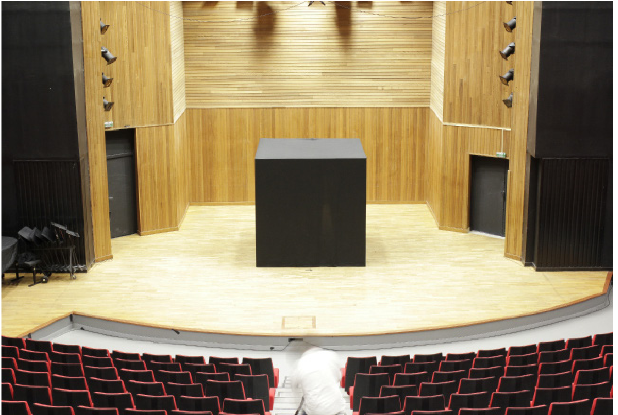
Maman, dans l'auditorium, Brest, 2015