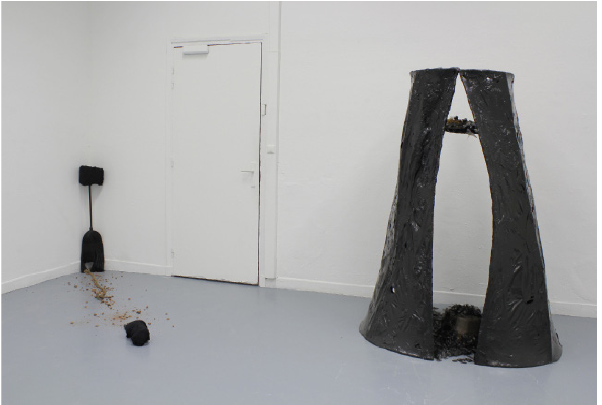
Rejli 2: vue d'ensemble et détail, 2015, dimensions variables, différents médiums; bois, tissu noir usé, balai cassé et peinte en noir, terre en poudre, chaine en fer forgé usé