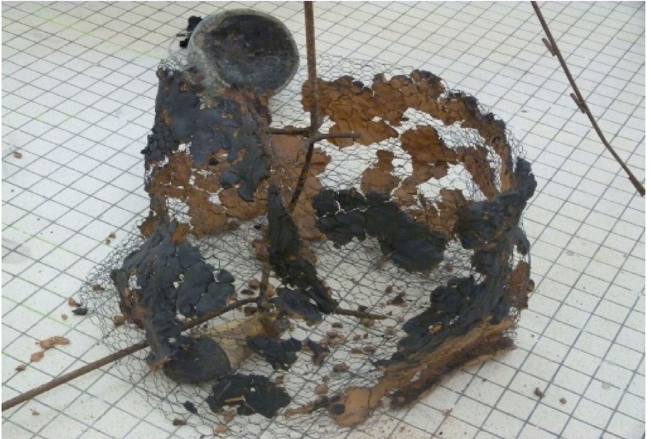
Lieu d'origine: variable matériaux: argil, peinture, grillage de poule, chaussure, fer, casserole...