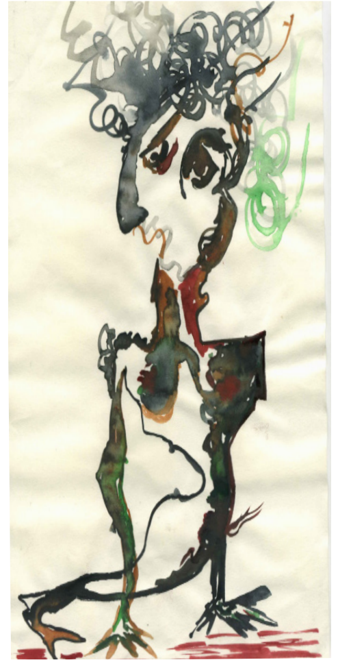
Quelques exemples de dessins, 2012, A4, aquarelle