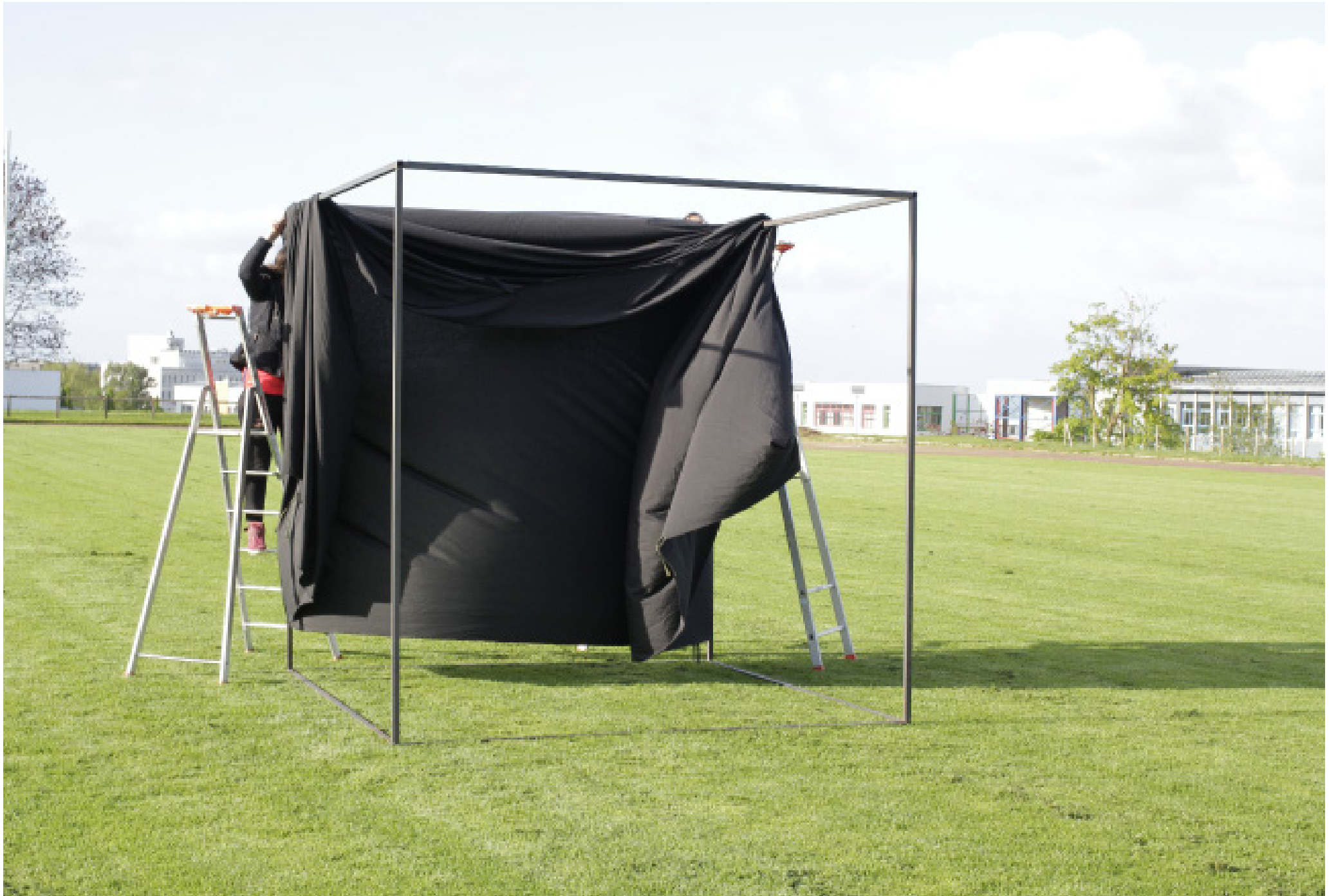
Maman sur un terrain de rugby, Brest, 2015