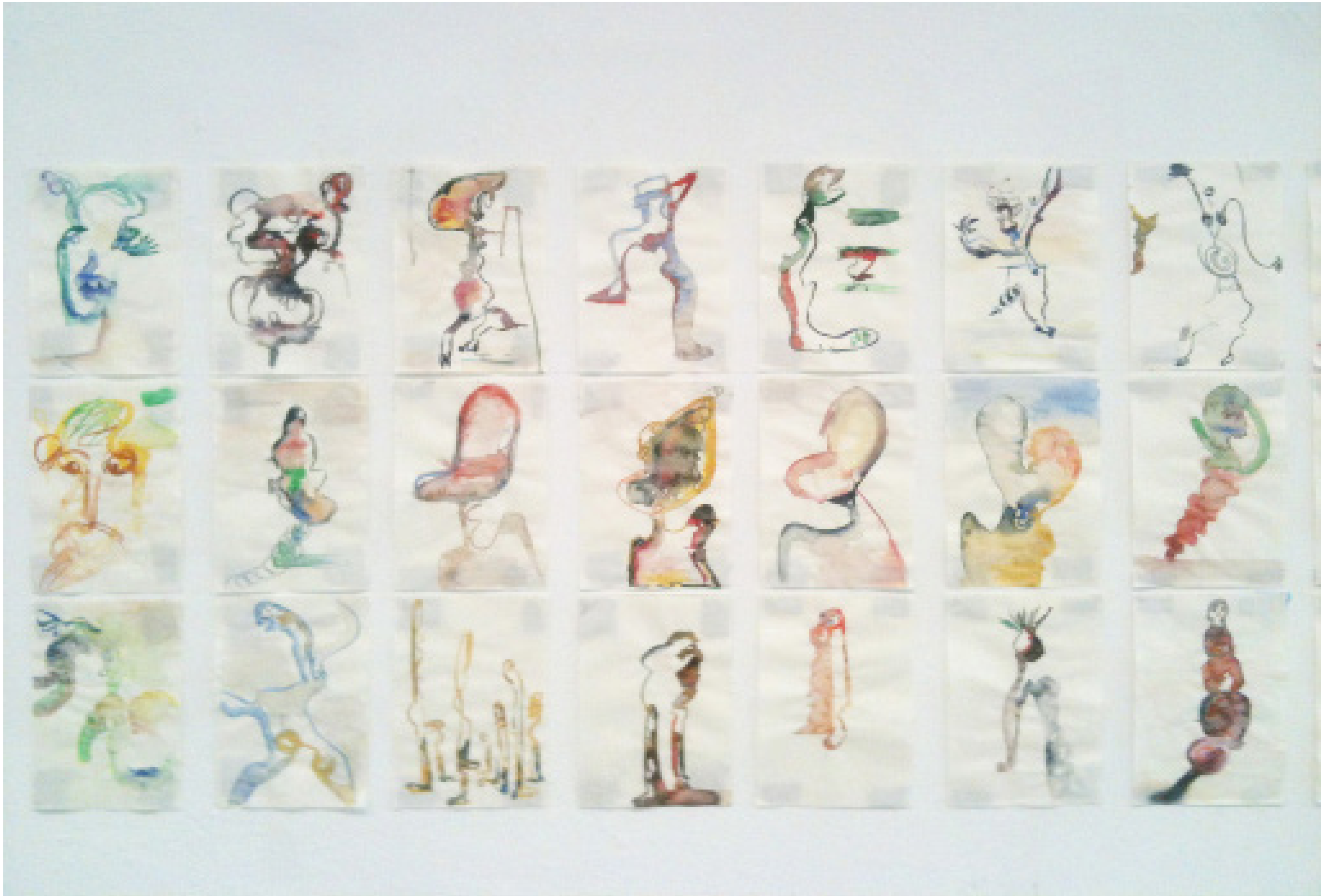
Vue d'ensemble de dessins accrochés au mur, 2012