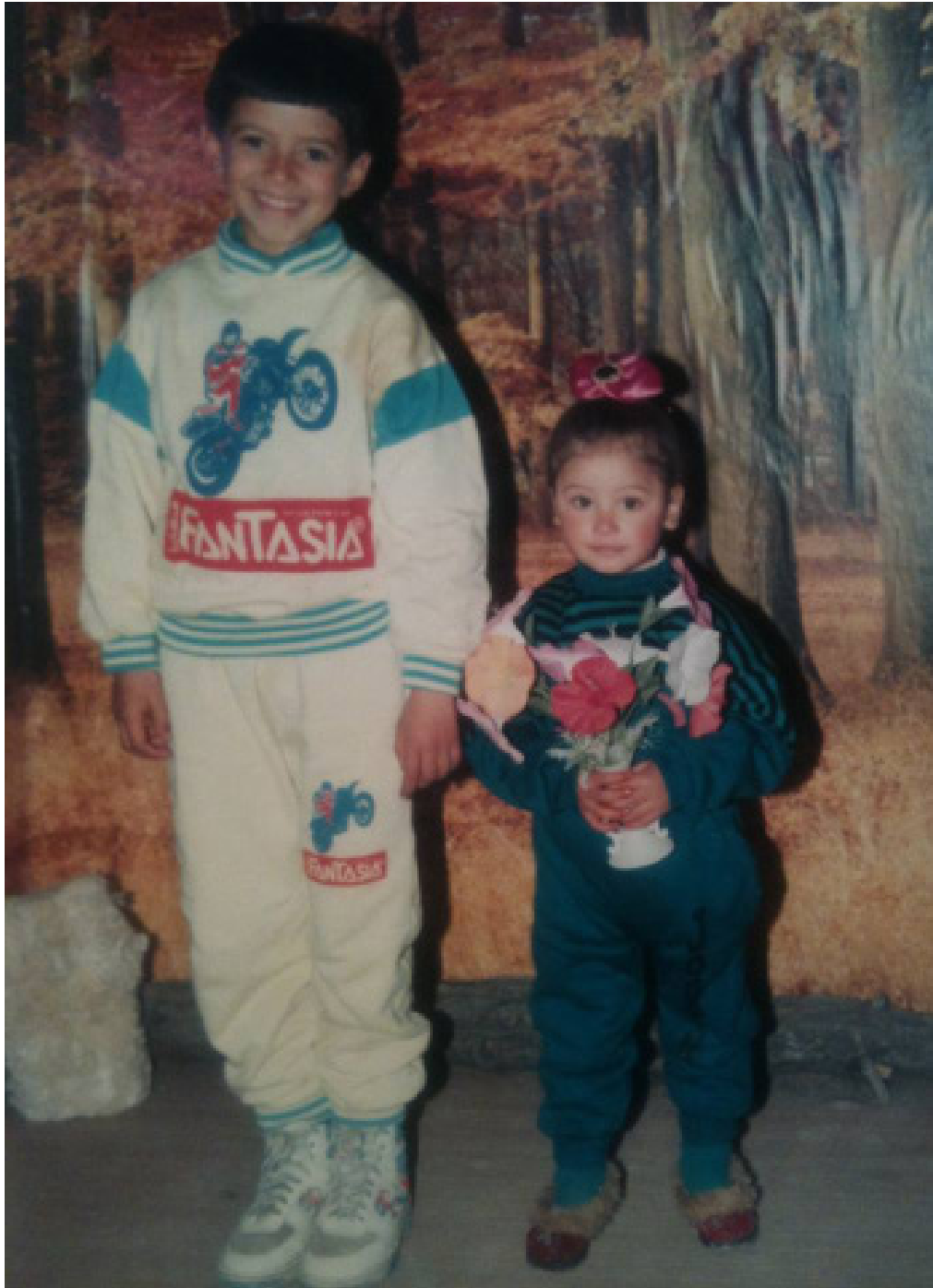
Nous deux Image photographique de famille, 1990, 10 X 15 cm 2019