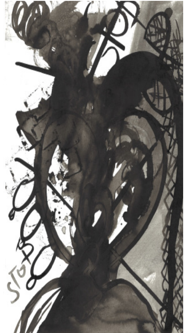
Quelques exemples de dessins, encre de chine , 24 X 32 cm, 2019