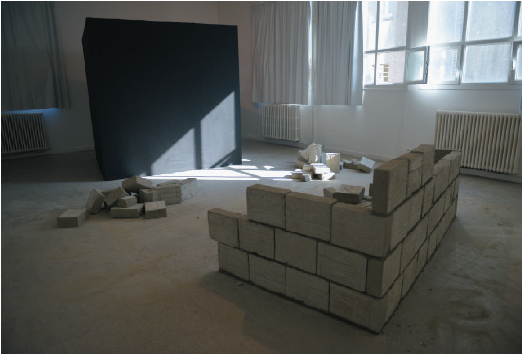
Vue globale de l'installation, mur en béton (PAPA), cube noir (MAMAN)