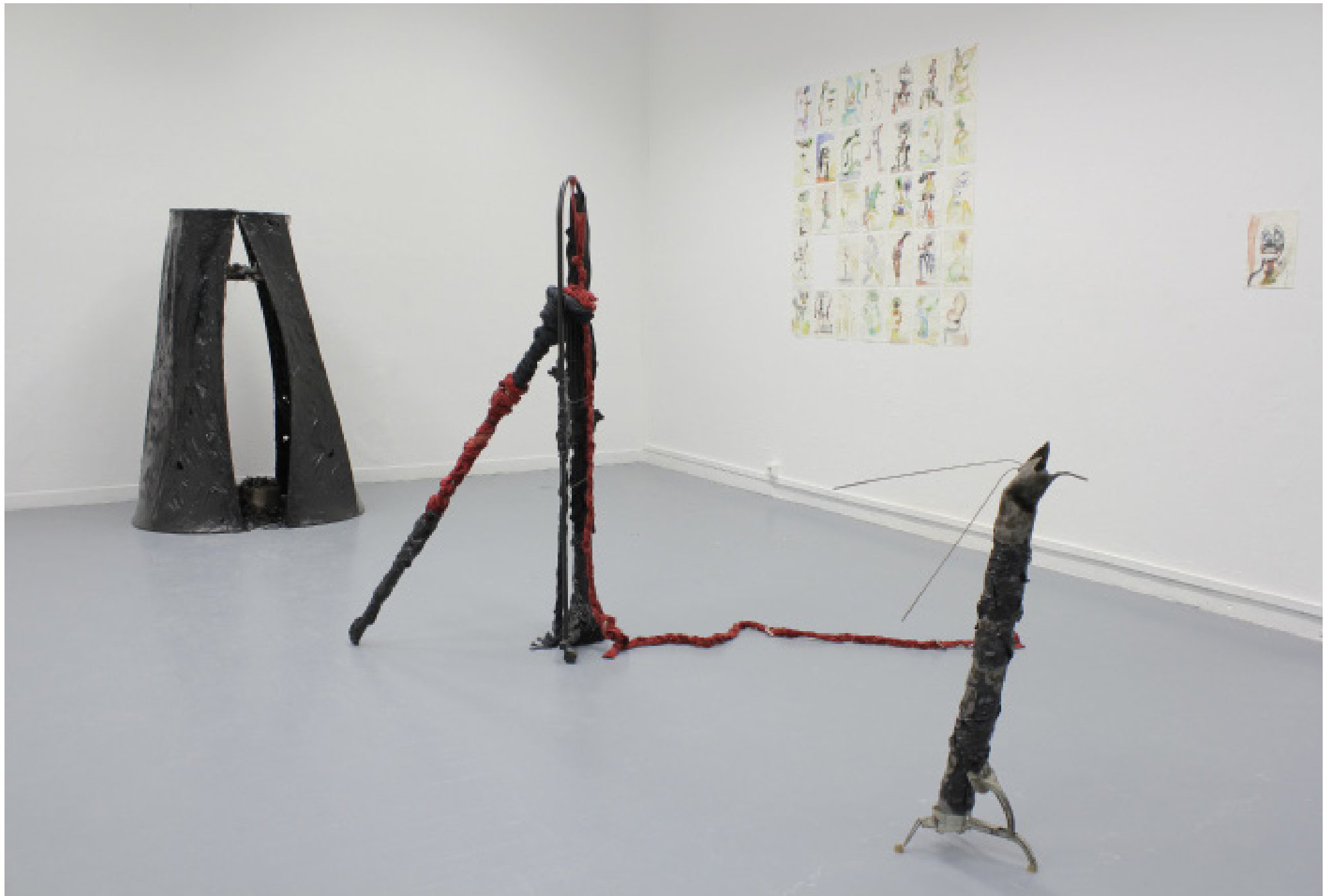
Vue globale de l'installation, 5 sculptures, mur en dessins, dimensions variables