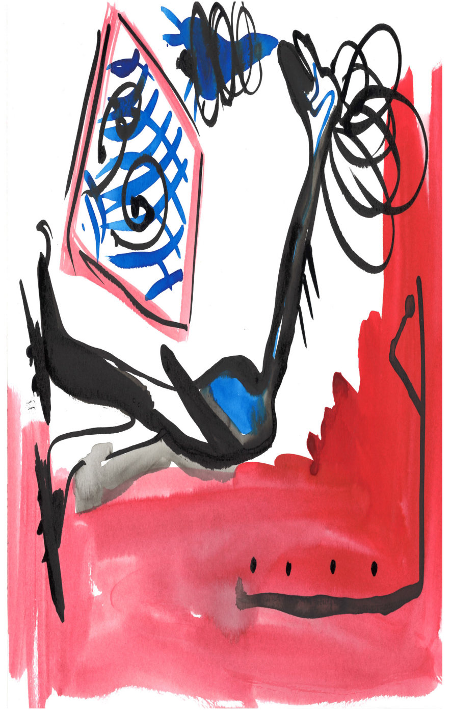
Quelques images de dessins, format A3, 2019