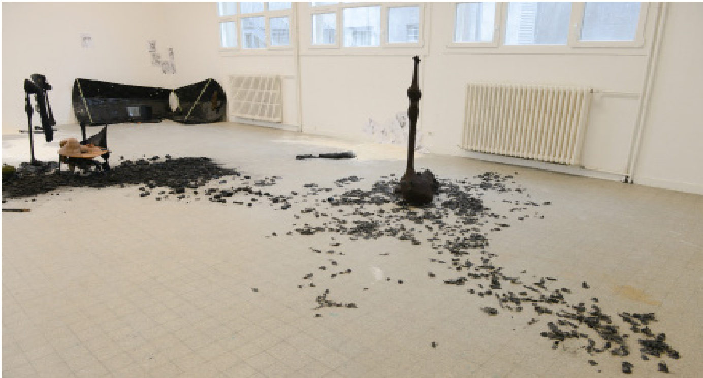
Différents matériaux: charbon, métal, collants et bas, plastiques, barre de métalle, objets récupérer dimensions variables