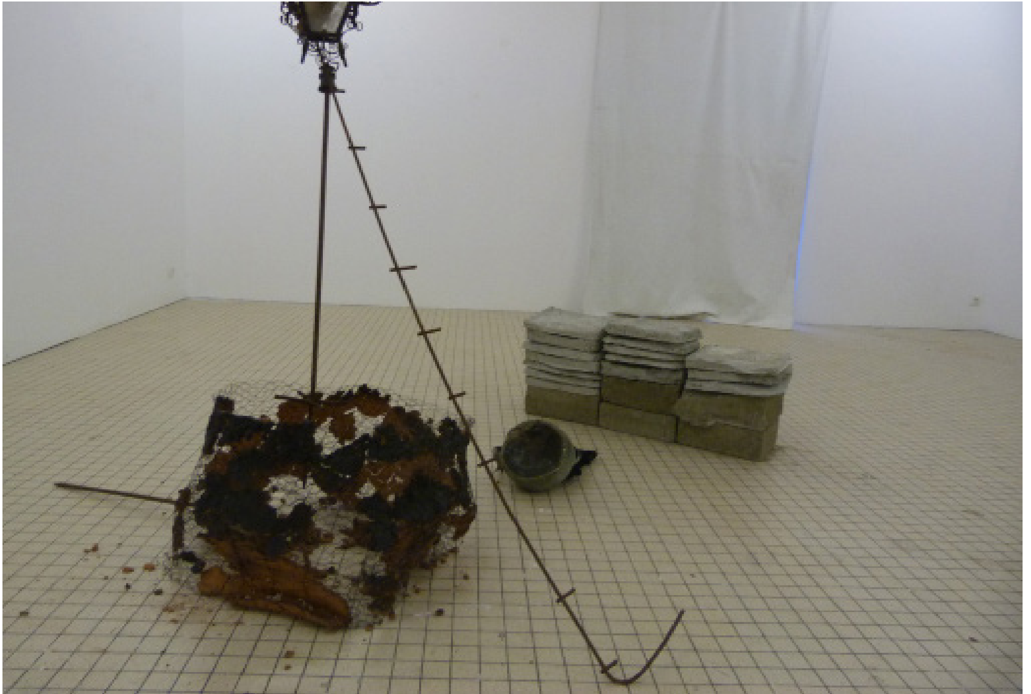
Vue de l'installation: dimension variable, différents matériaux: fer, argil, 20 briques de béton, casserole usé