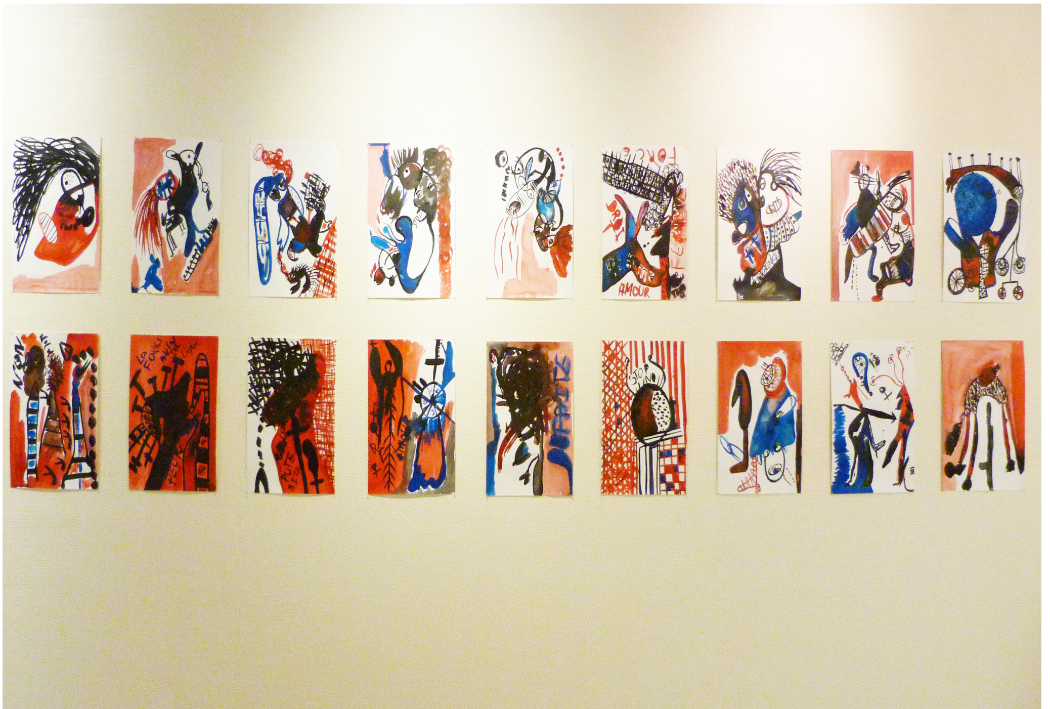
Vue de dessins accrochés au mur, 2019