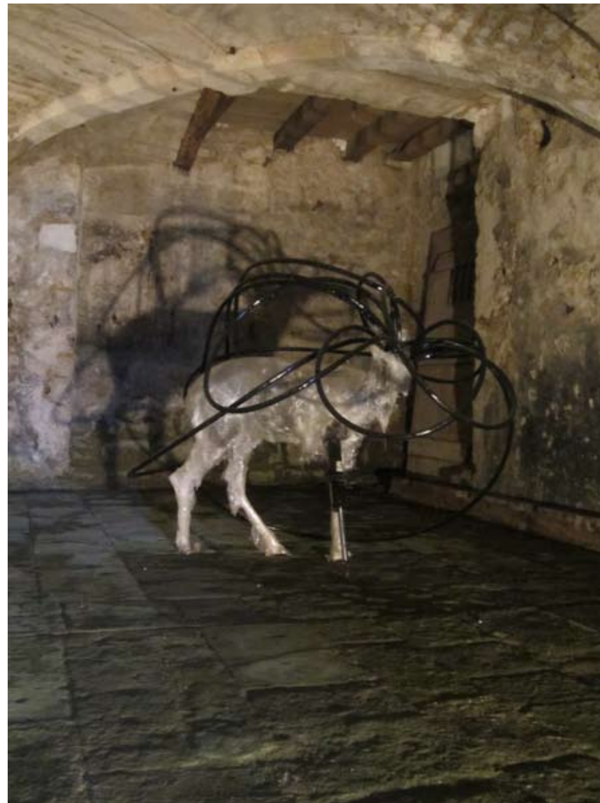
Carcasses Exquises , 2012 ; Installation réalisée dans le cadre d'une résidence à la maison Jean Chevolleau. Fontenay le Comte.