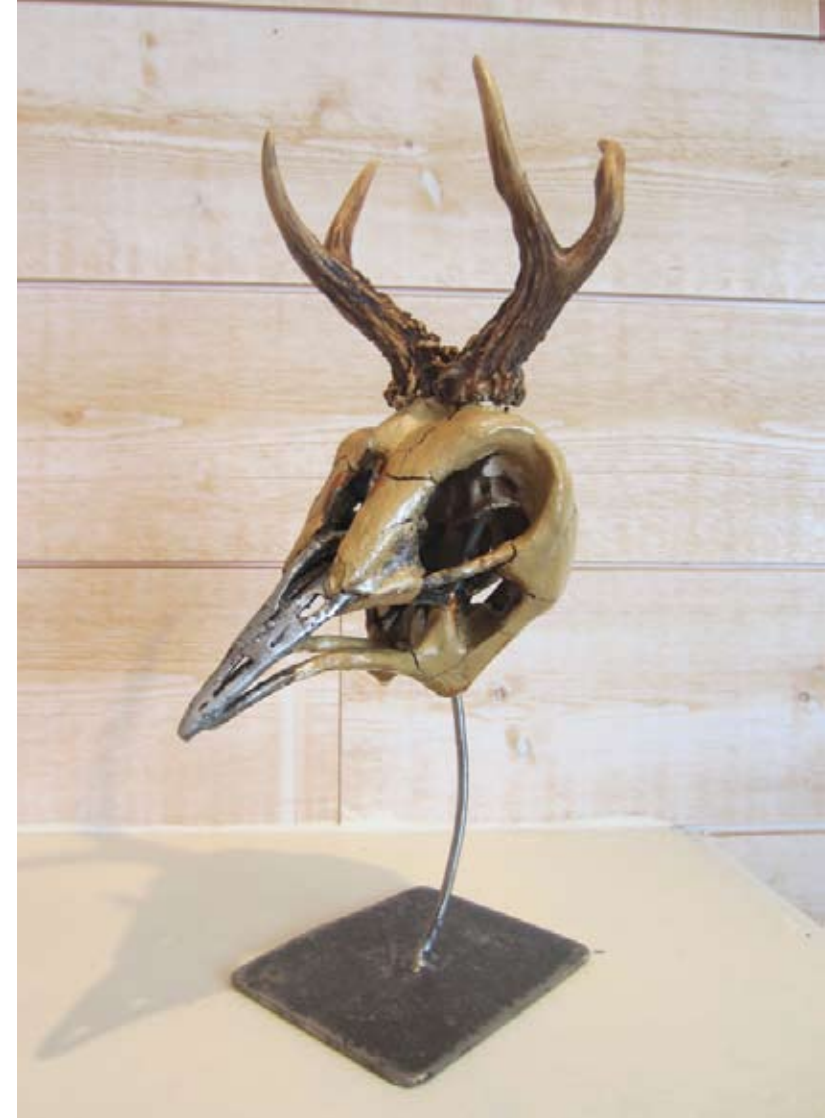
Espèce Protégée 3 , 2015 Os, Métal, Terre, Résine Collection particulière