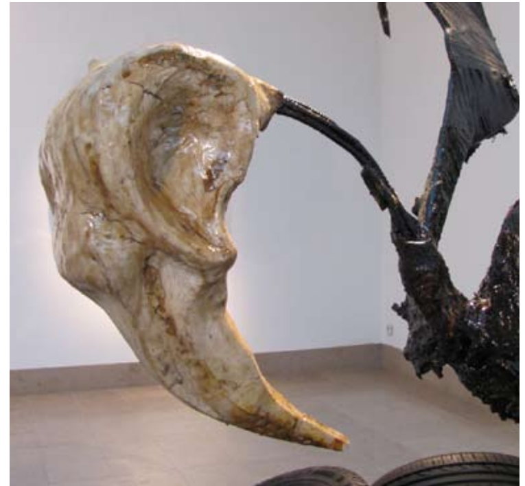
Amoco Cadiz , Sculpture/installation; 2013 envergure: 2,50, hauteur tête: 1,60 Métal, map, goudron, résine, plastique, pneu.