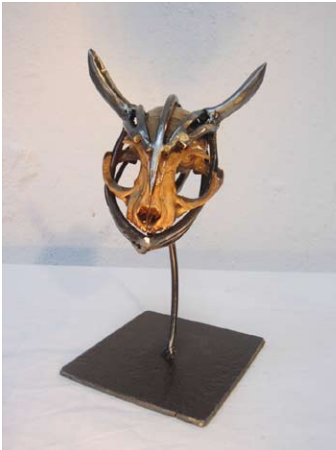
Rituel 1 , 2015 h:20, l:10, L:11