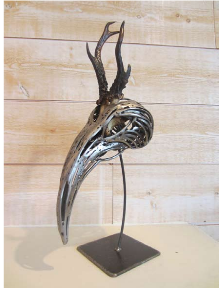
La Peste , 2015 Os, Métal Collection particulière