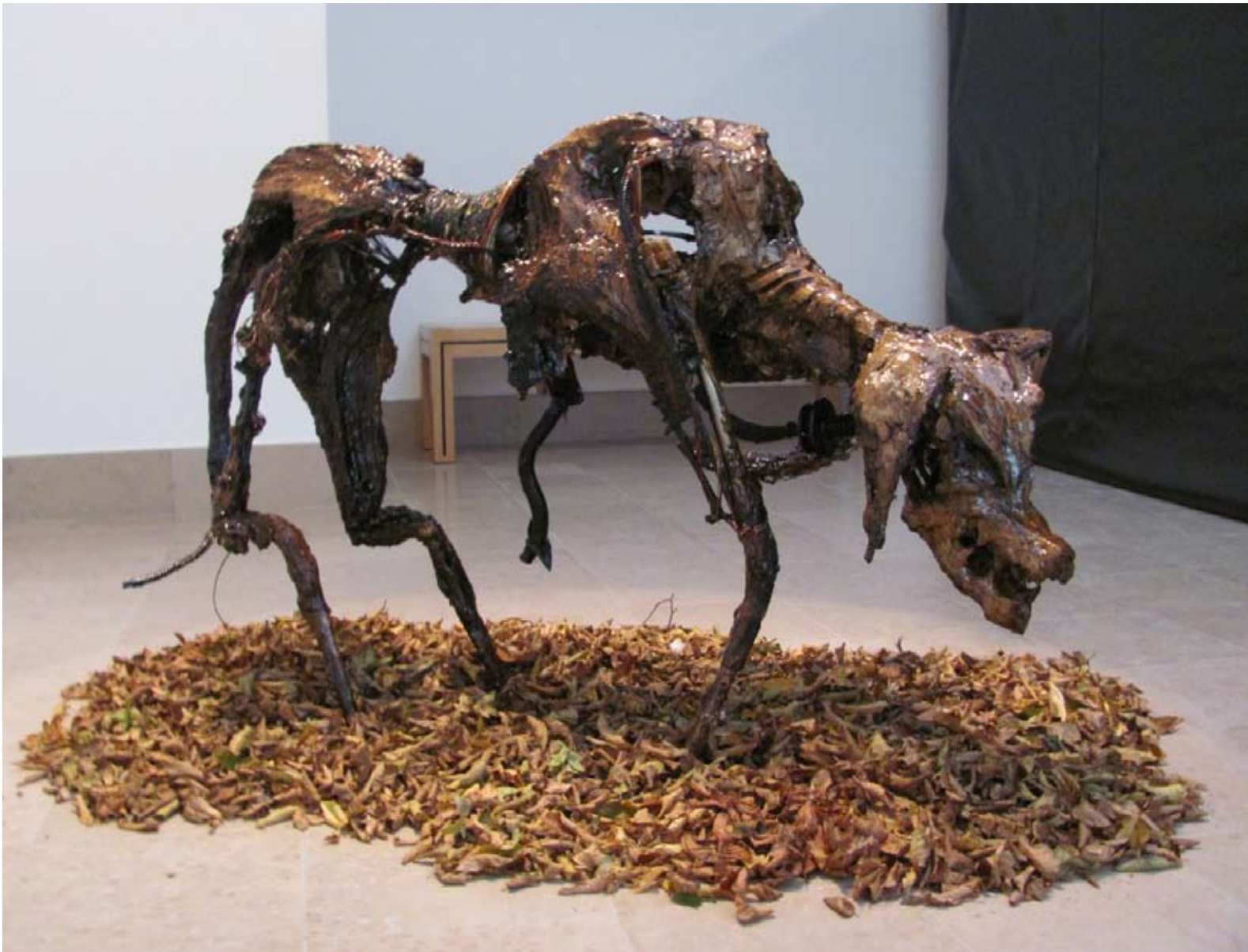
Misty, 2013 Métal, map, goudron, cable h: 60 cm l: 35 cm L: 140 cm