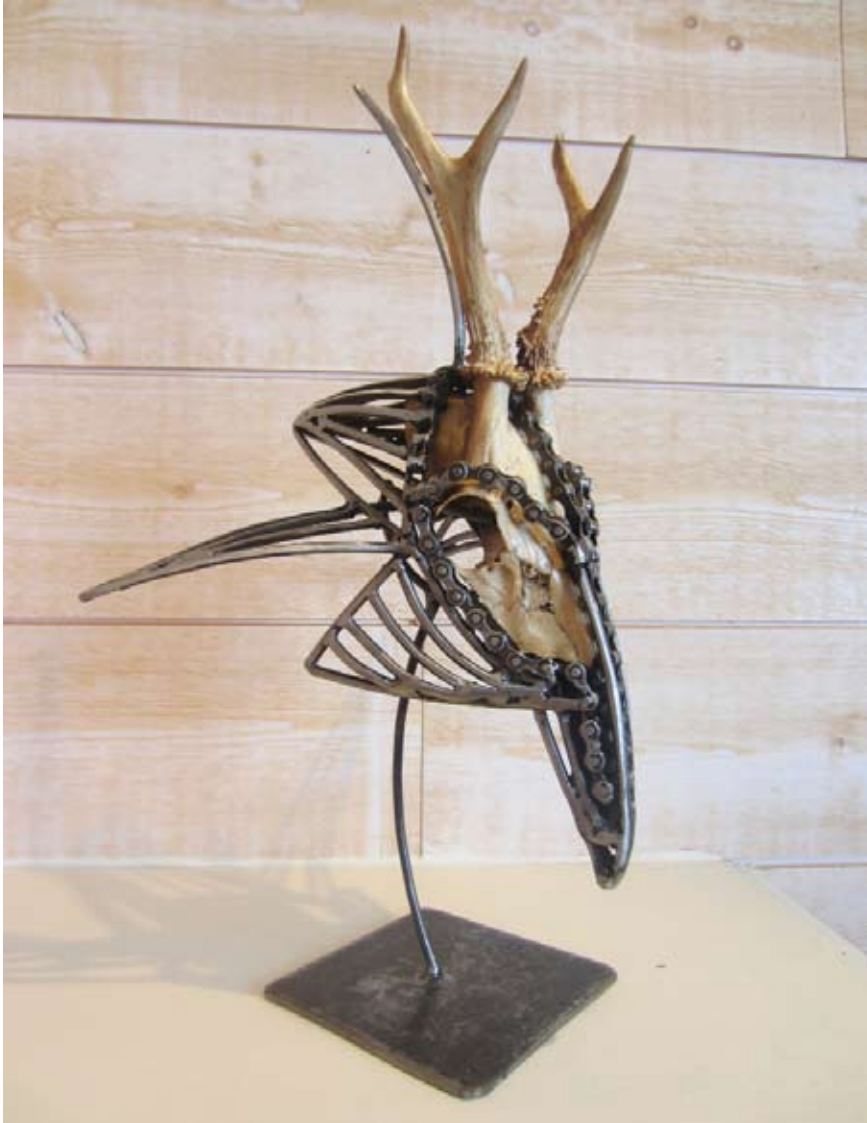
Espèce Protégée 1 , 2015 Os, Métal Collection particulière