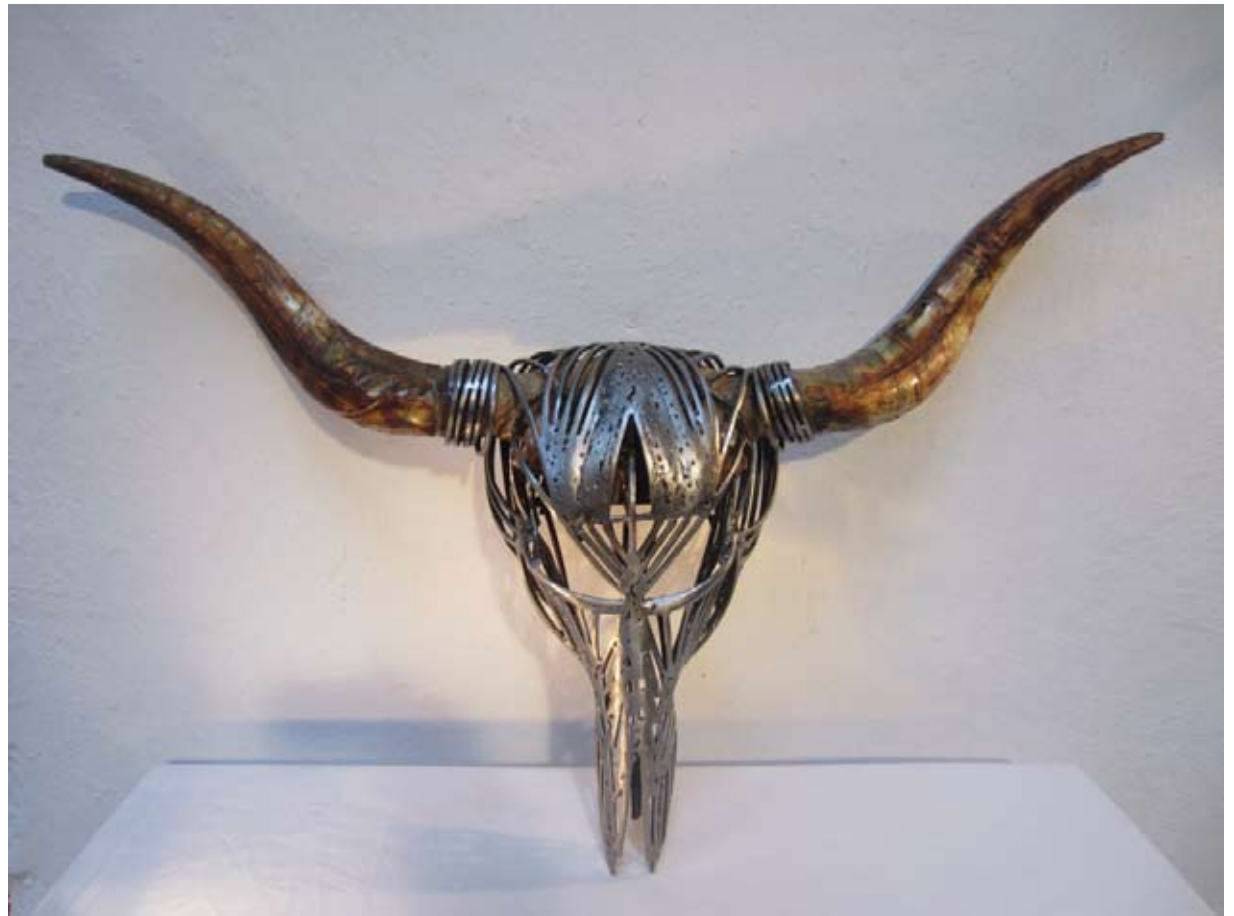
Rituel 2 , 2015 h:54, l:86, L:58