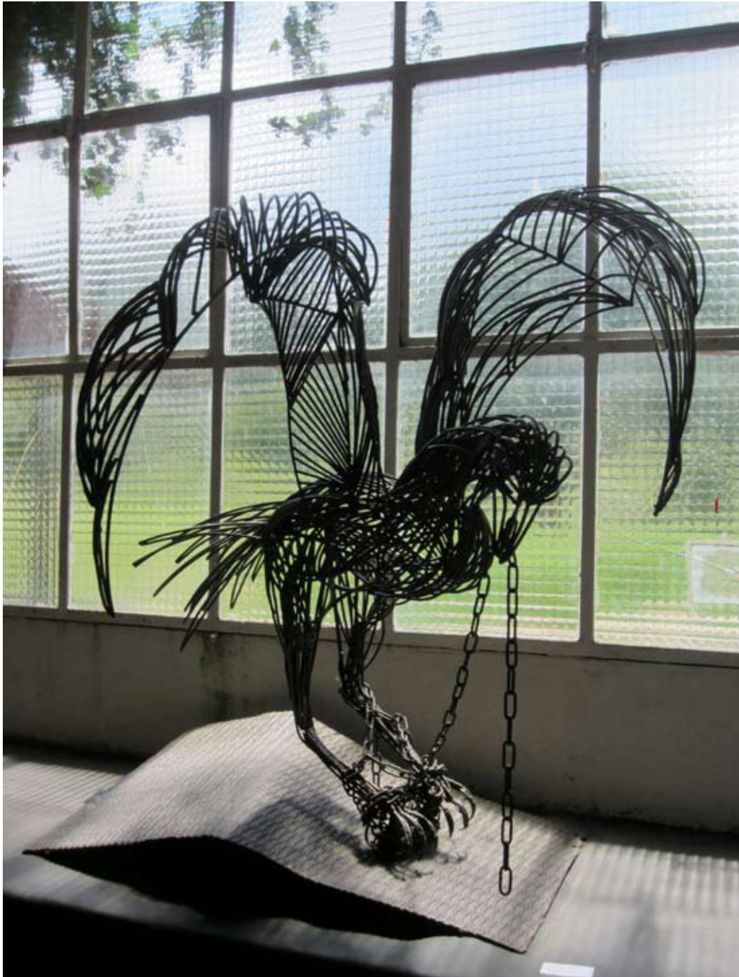
Cloué au sol , 2014 l=180 cm h= 140 cm métal recuit, soudure. collection particulière