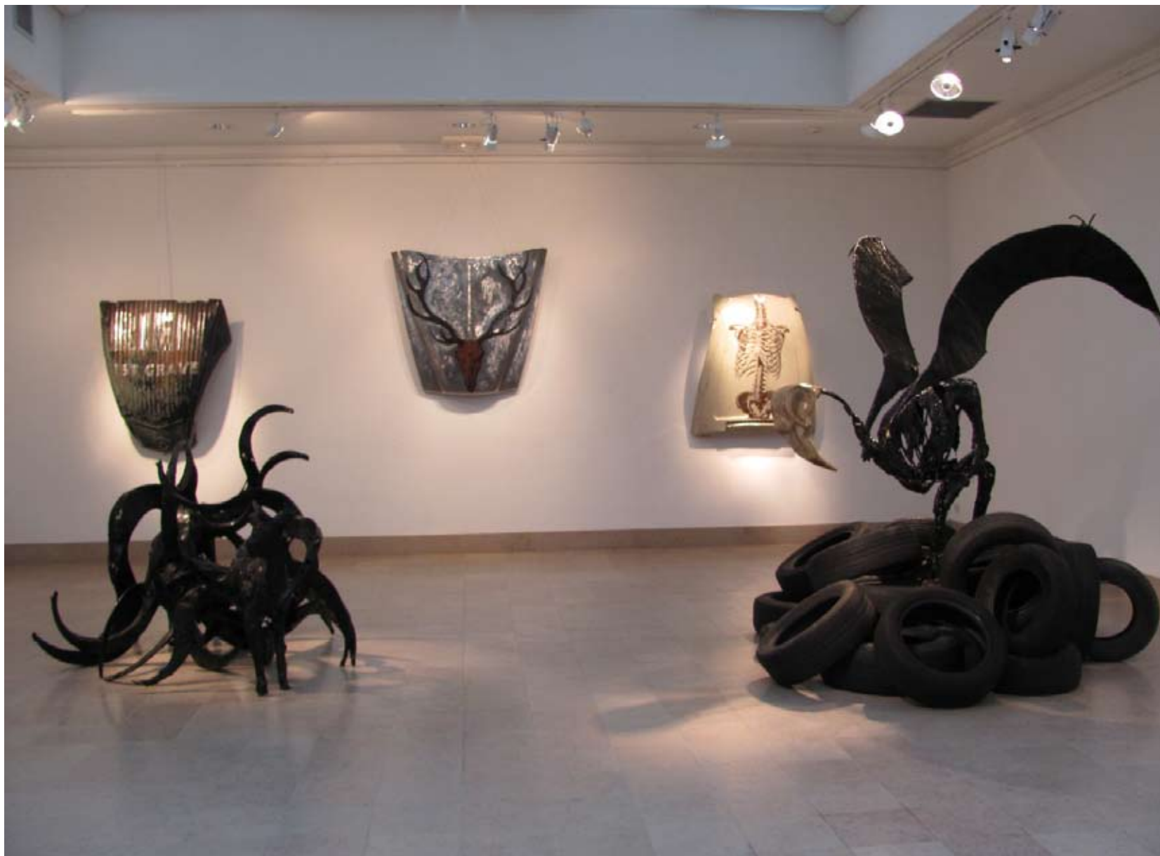
Exposition personnelle de fin de résidence à l'orangerie du chateau de la Louvière, Montluçon. Septembre 2013.