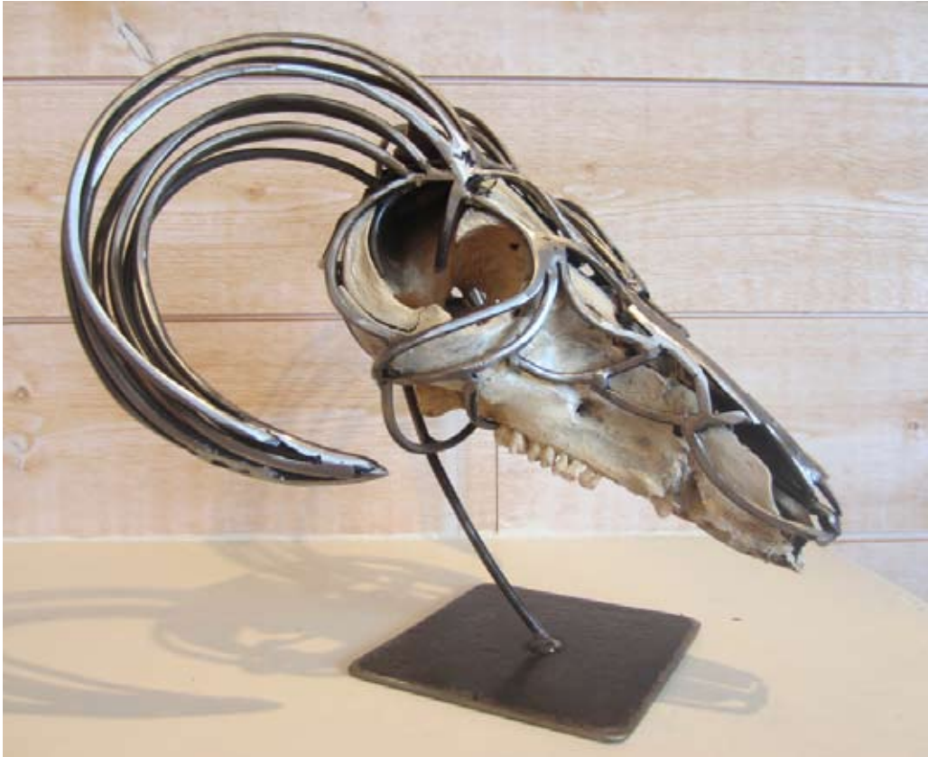
Espèce Protégée 2 , 2015 Os, Métal Collection particulière