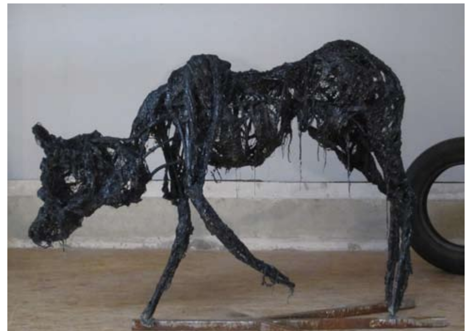
Immobilis in mobile , 2014 Métal, ciment, pneu, goudron Exposition personnelle à la ZAC de Brest