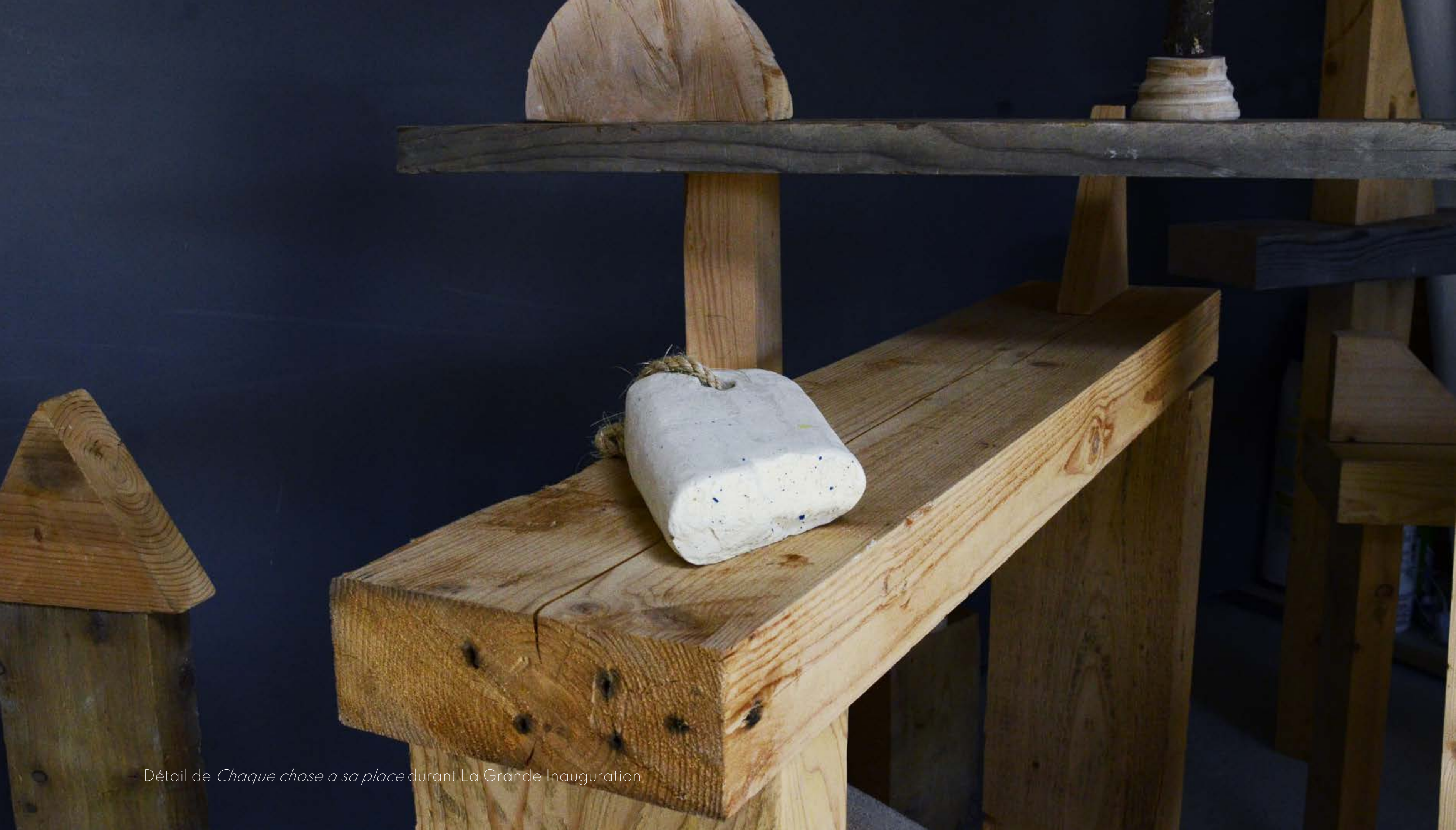
- Détail de Chaque chose a sa place durant La Grande Inauguration