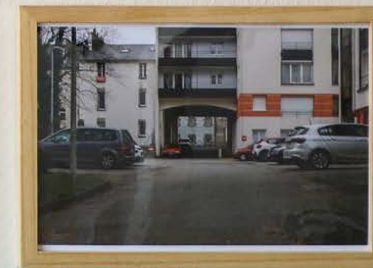
Vu d'exposition de la Biennale de Mulhouse