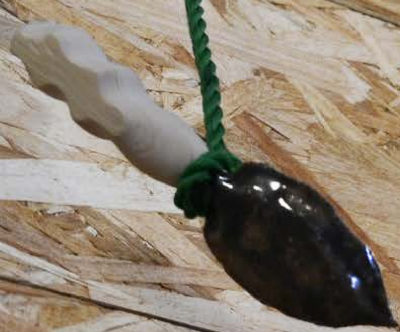
Détail de la série Cabanes lors de La Grande Inauguration, détail de la série en cours Shlass