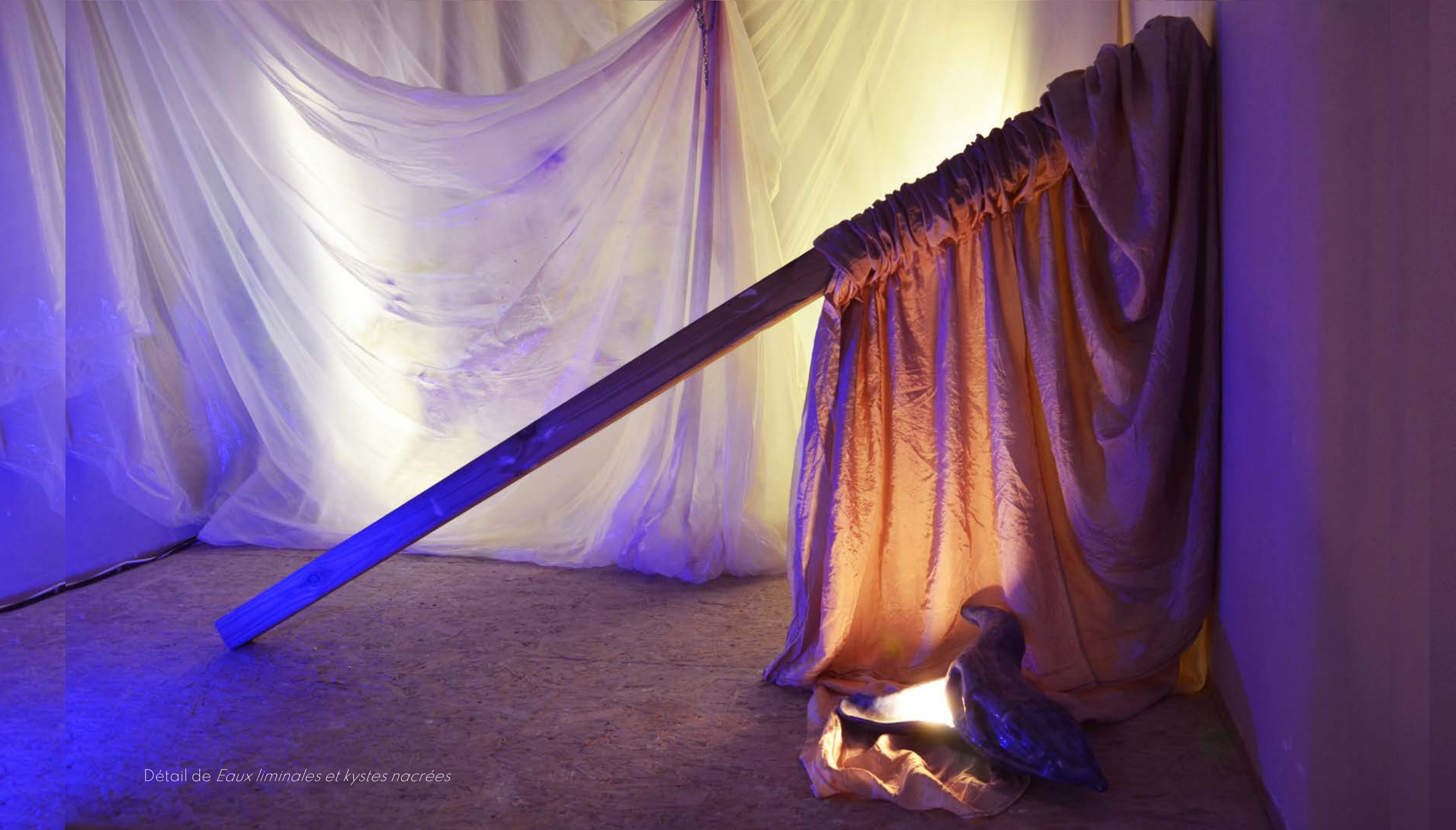
Détail de Eaux liminales et kystes nacrées