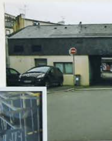
Vu d'exposition de la Biennale de Mulhouse