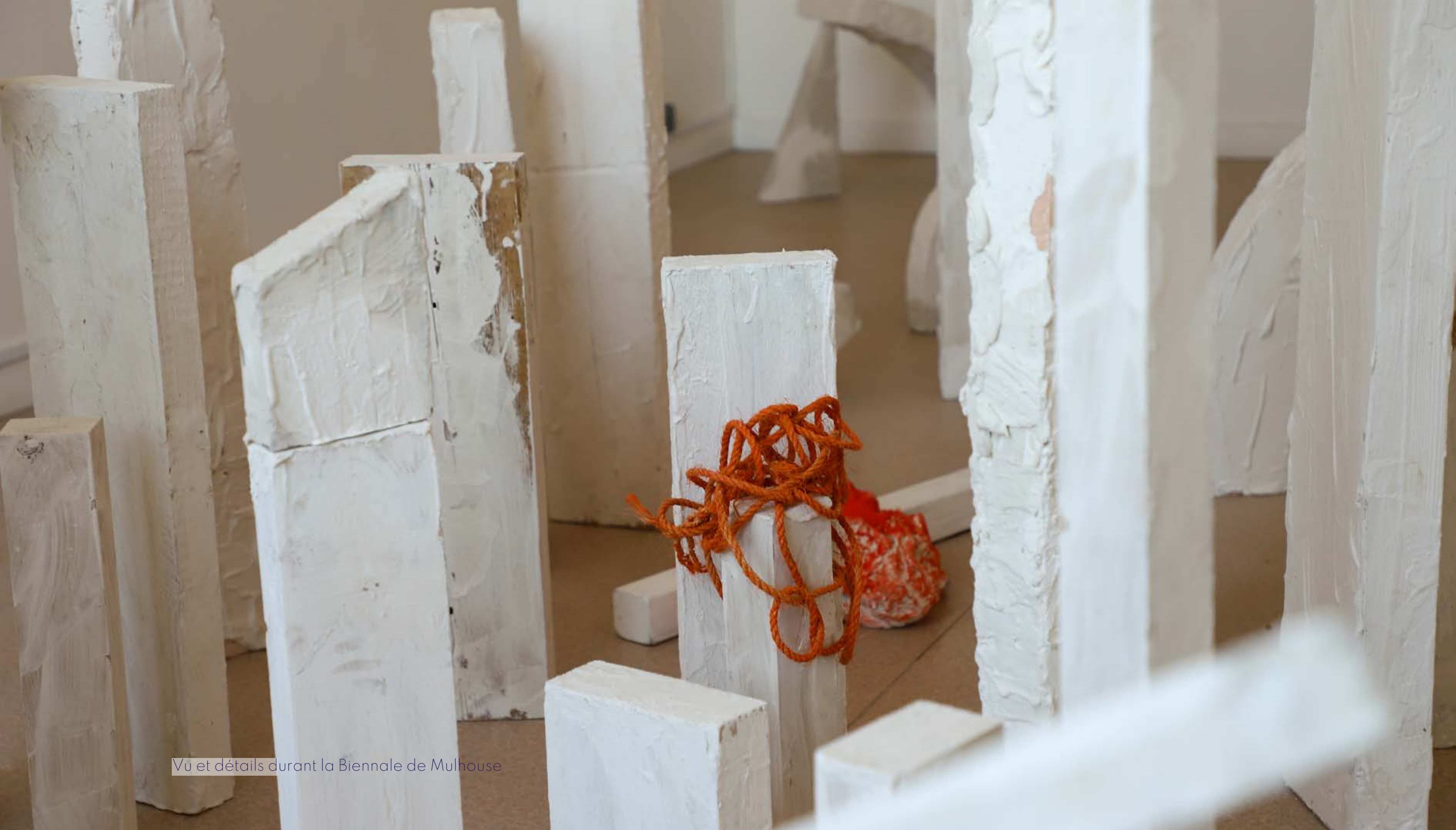
Vu et détails durant la Biennale de Mulhouse