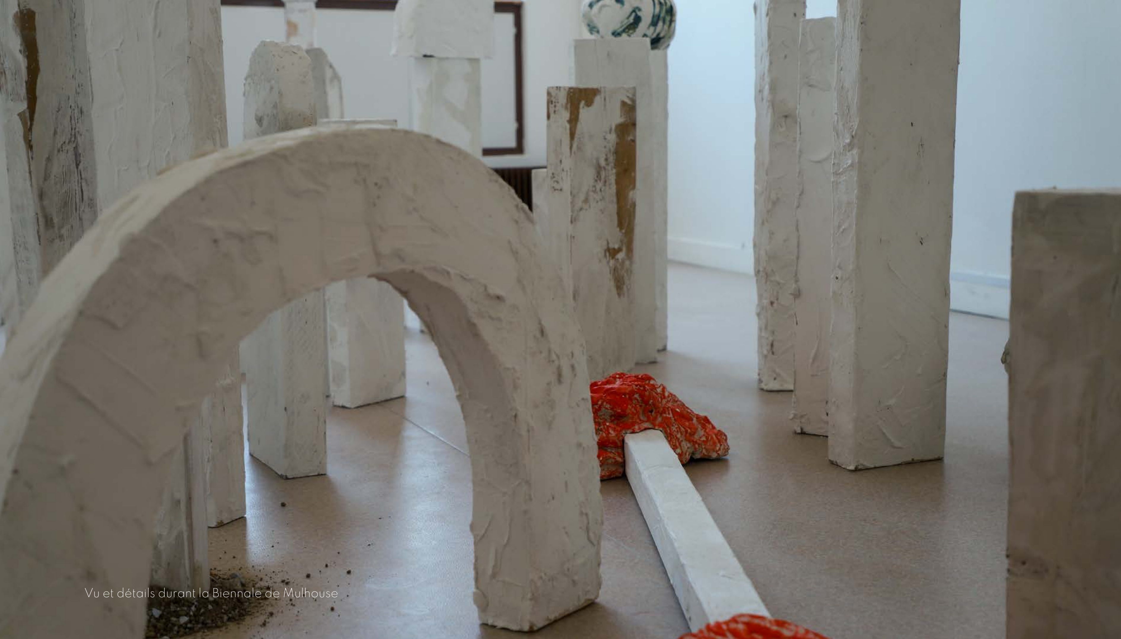
Vu et détails durant la Biennale de Mulhouse