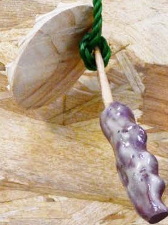
Détail de la série Cabanes lors de La Grande Inauguration, détail de la série en cours Shlass