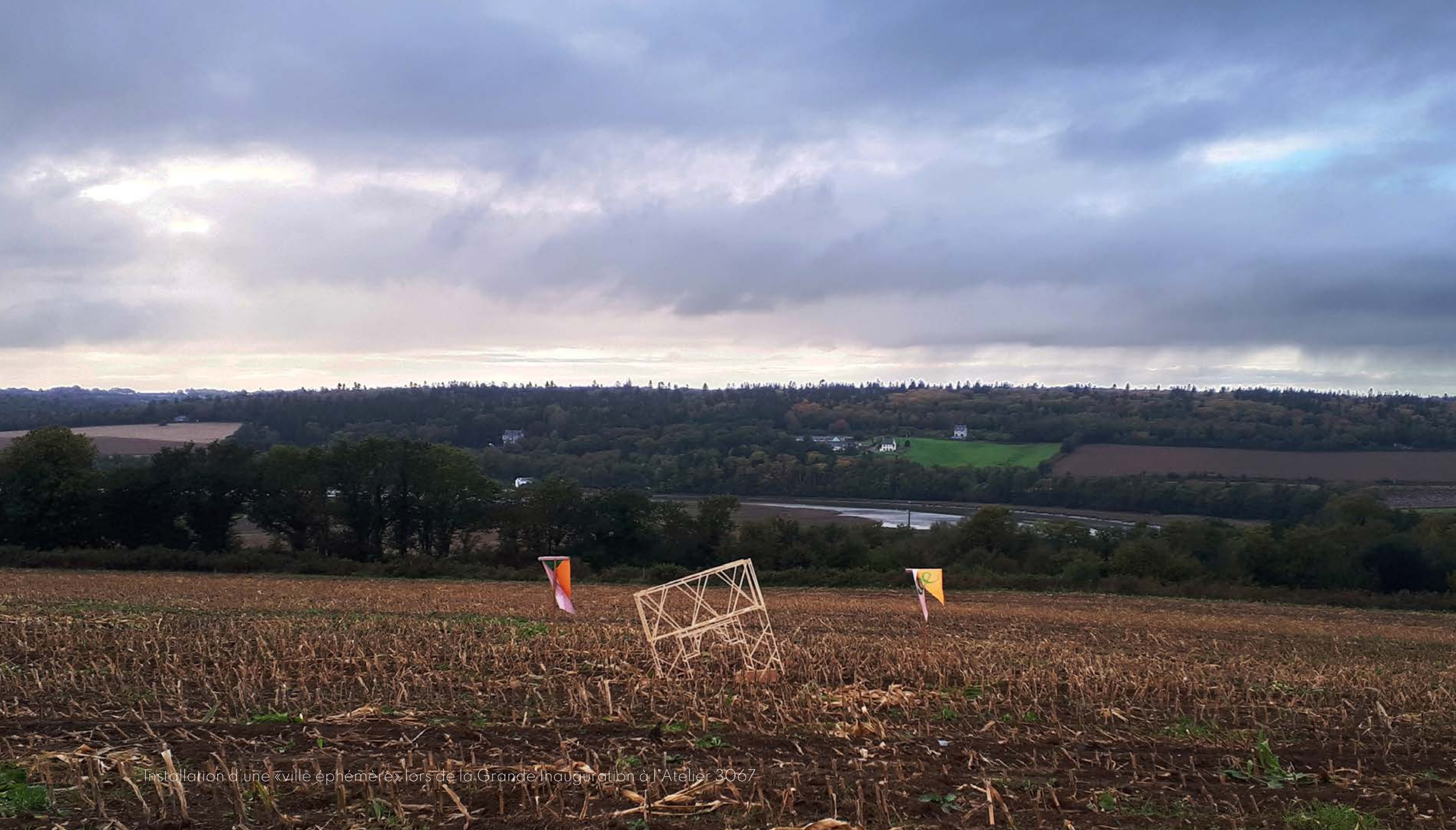
Installation d'une «ville éphémère» lors de la Grande Inauguration à l'Atelier 3067