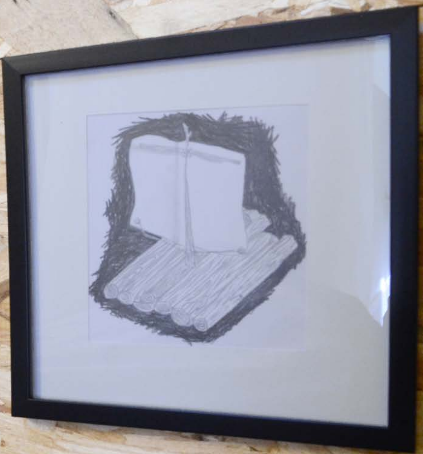
Détail de la série Cabanes lors de La Grande Inauguration, détail de la série en cours Shlass