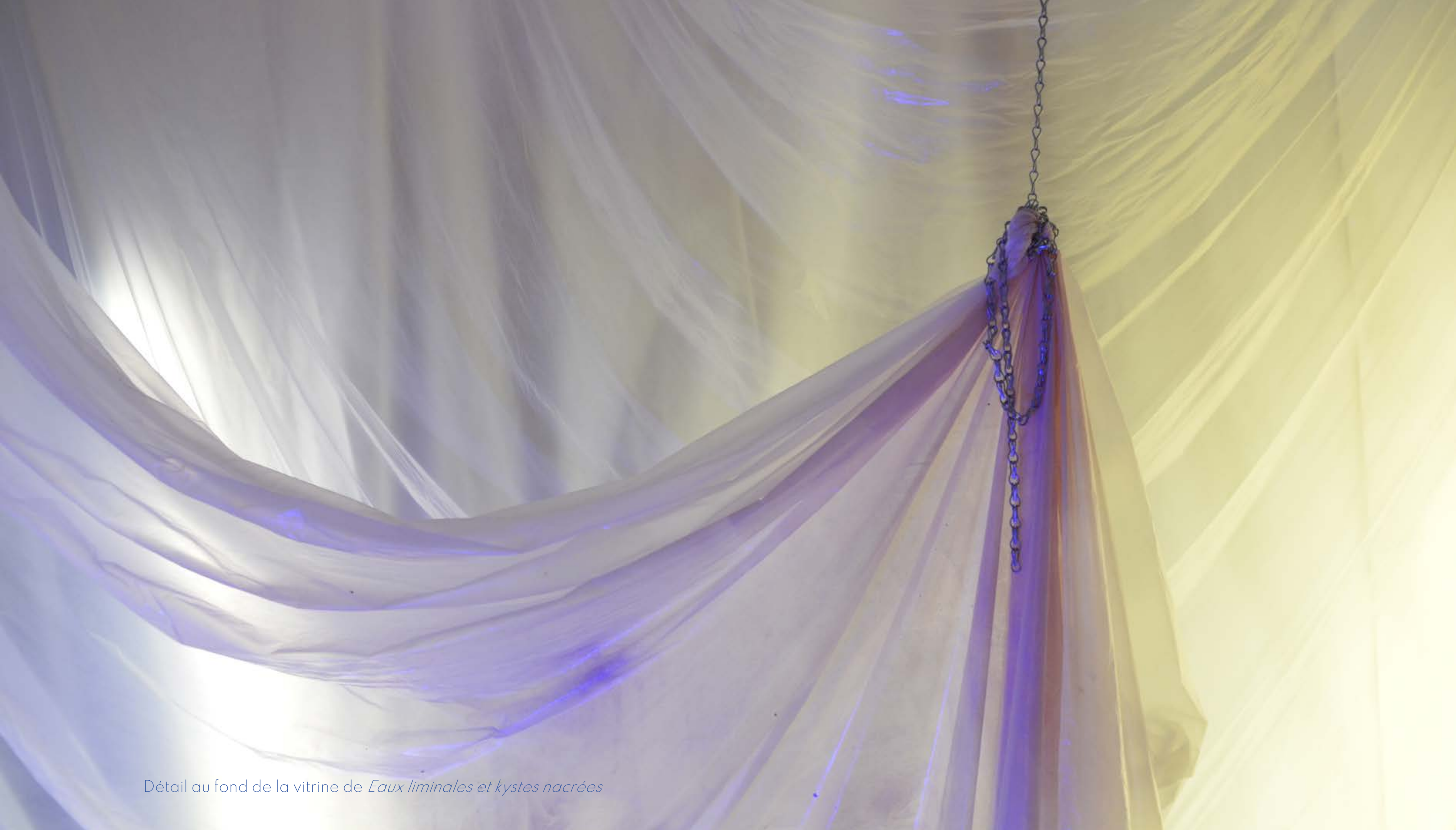
Détail au fond de la vitrine de Eaux liminales et kystes nacrées