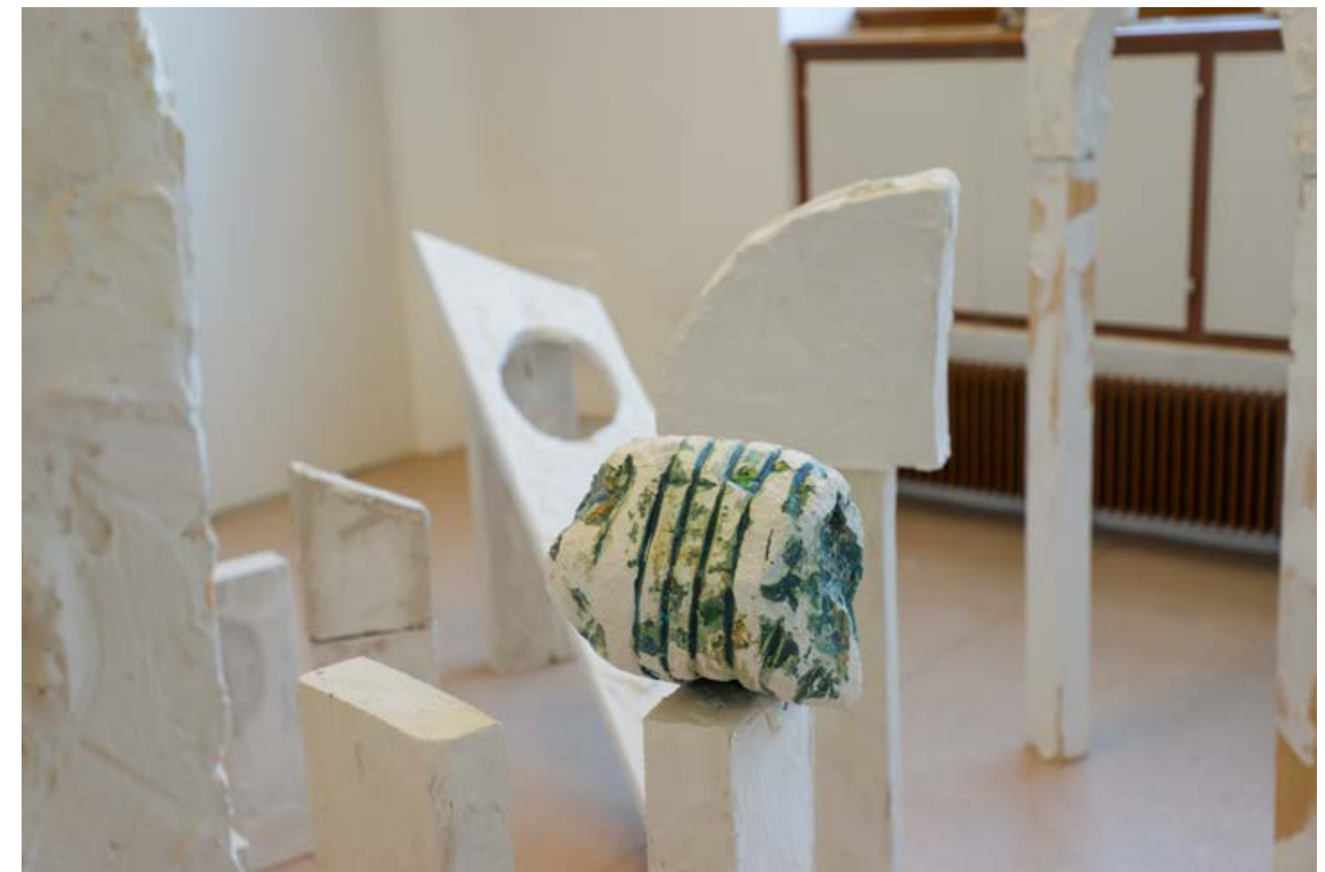
Vu durant la Biennale de Mulhouse