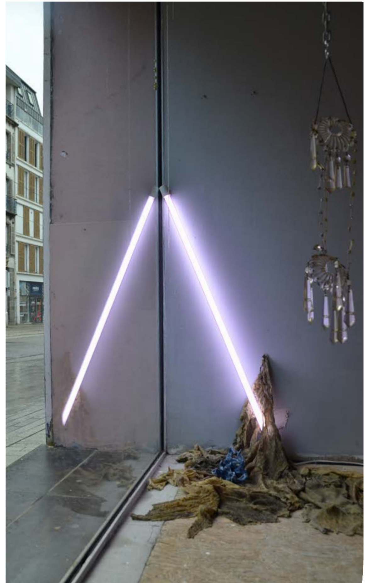
Détails de la vitrine et de l'entrée de Eaux liminales et kystes nacrées .