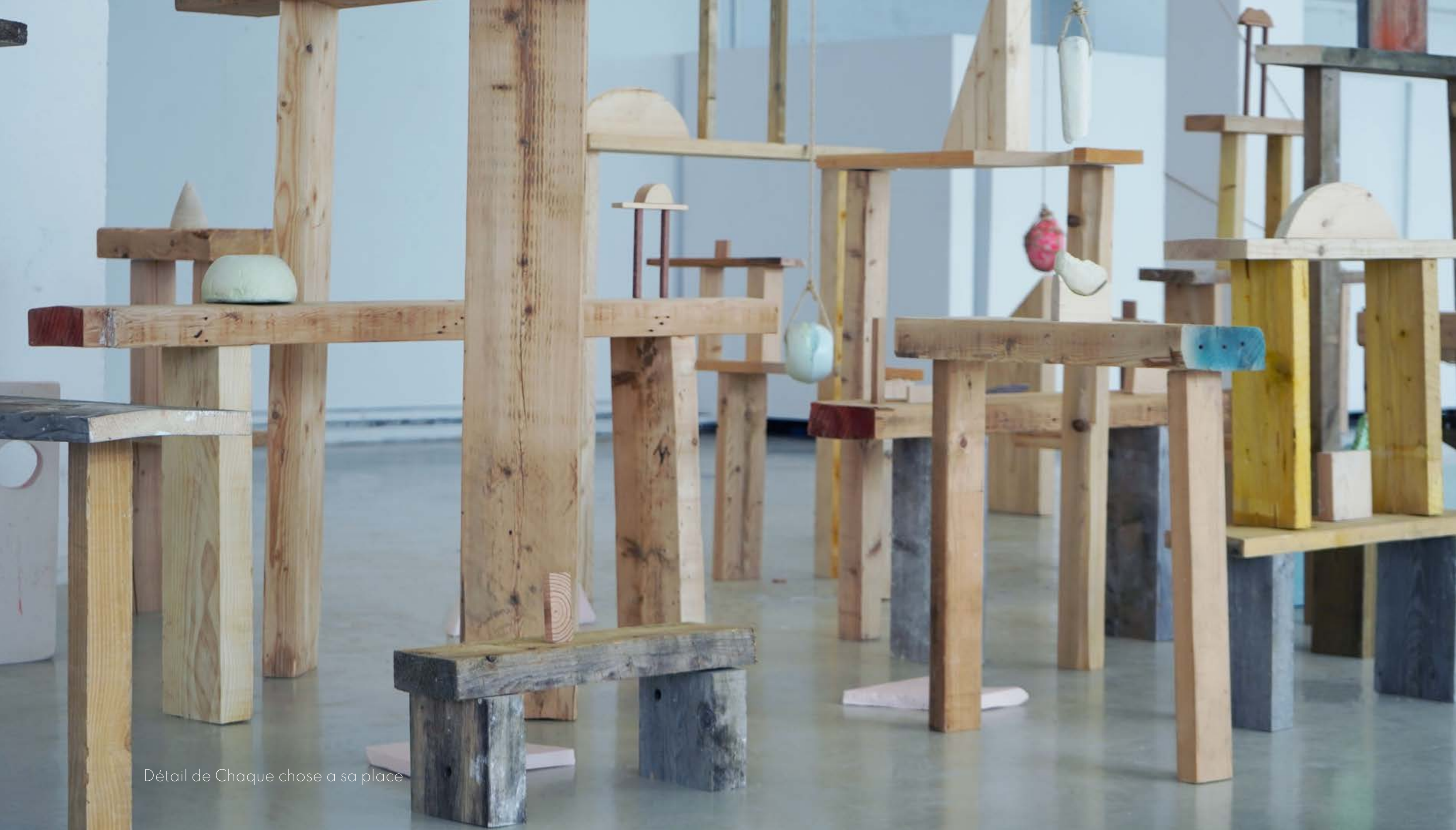
Détail de Chaque chose a sa place