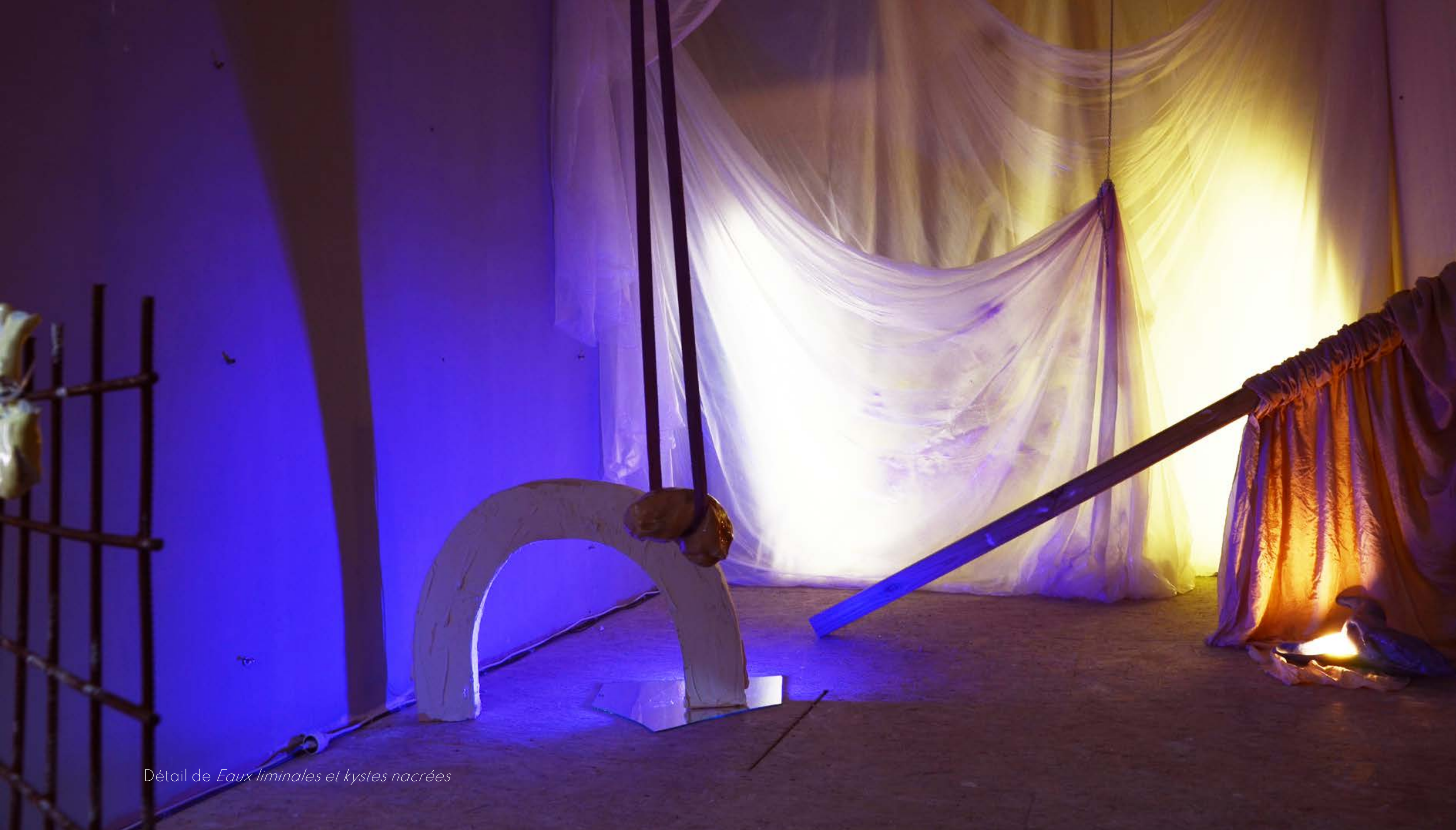
Détail de Eaux liminales et kystes nacrées