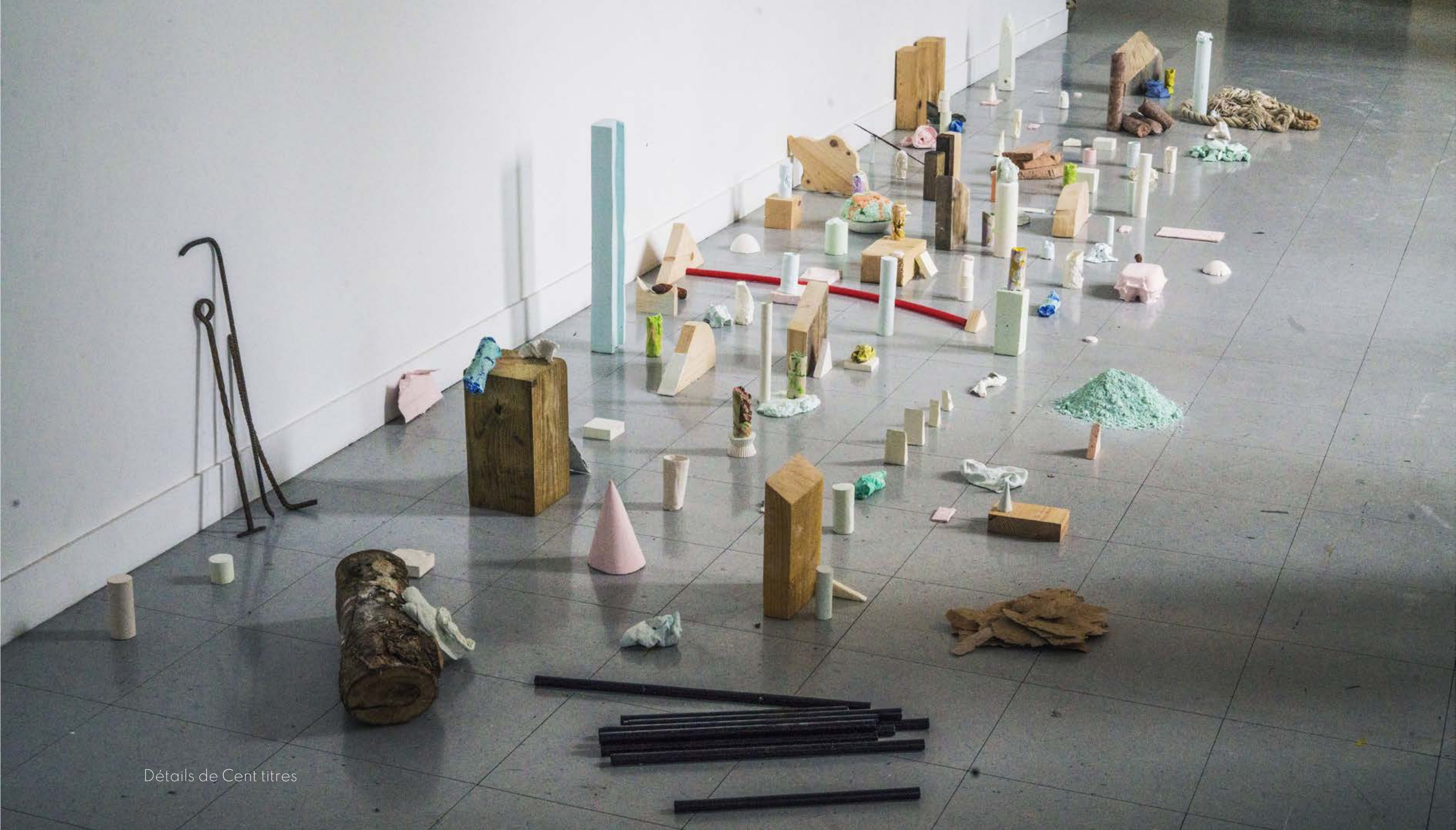
Détails de Cent titres