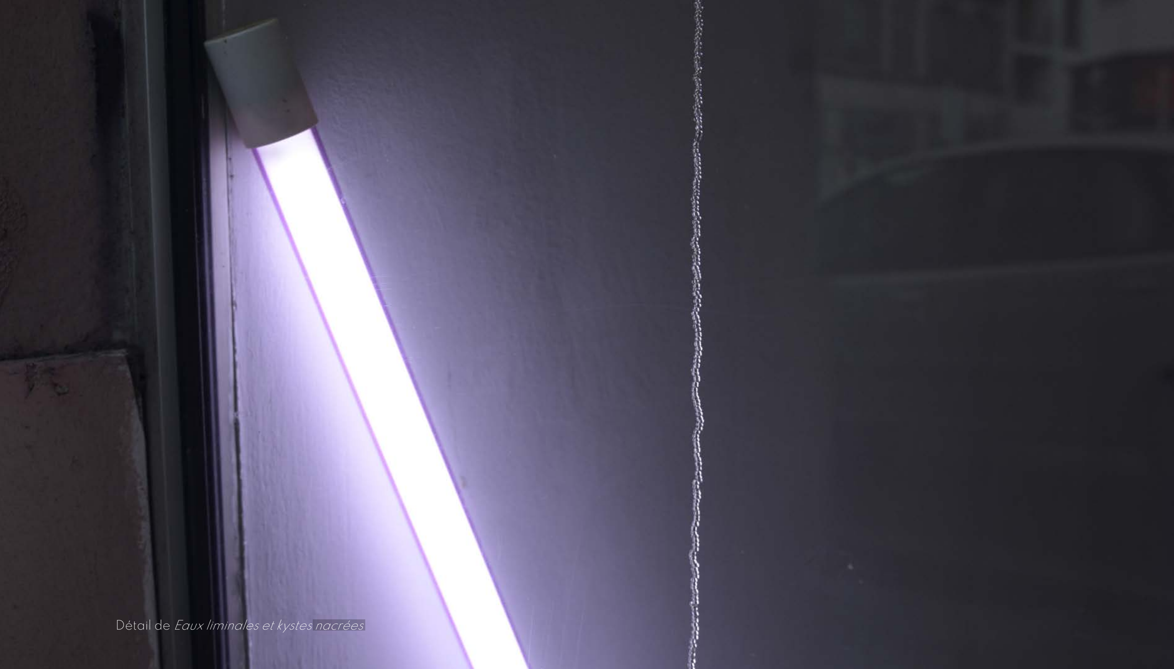
Détail de Eaux liminales et kystes nacrées