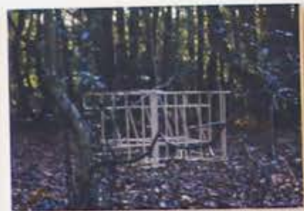
Vu d'exposition de la Biennale de Mulhouse