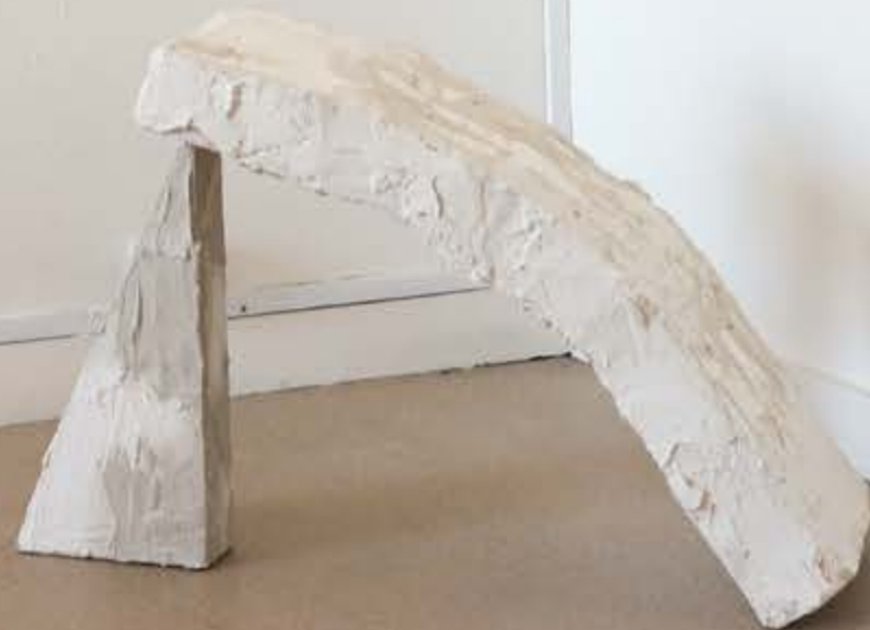
Vu d'exposition de la Biennale de Mulhouse