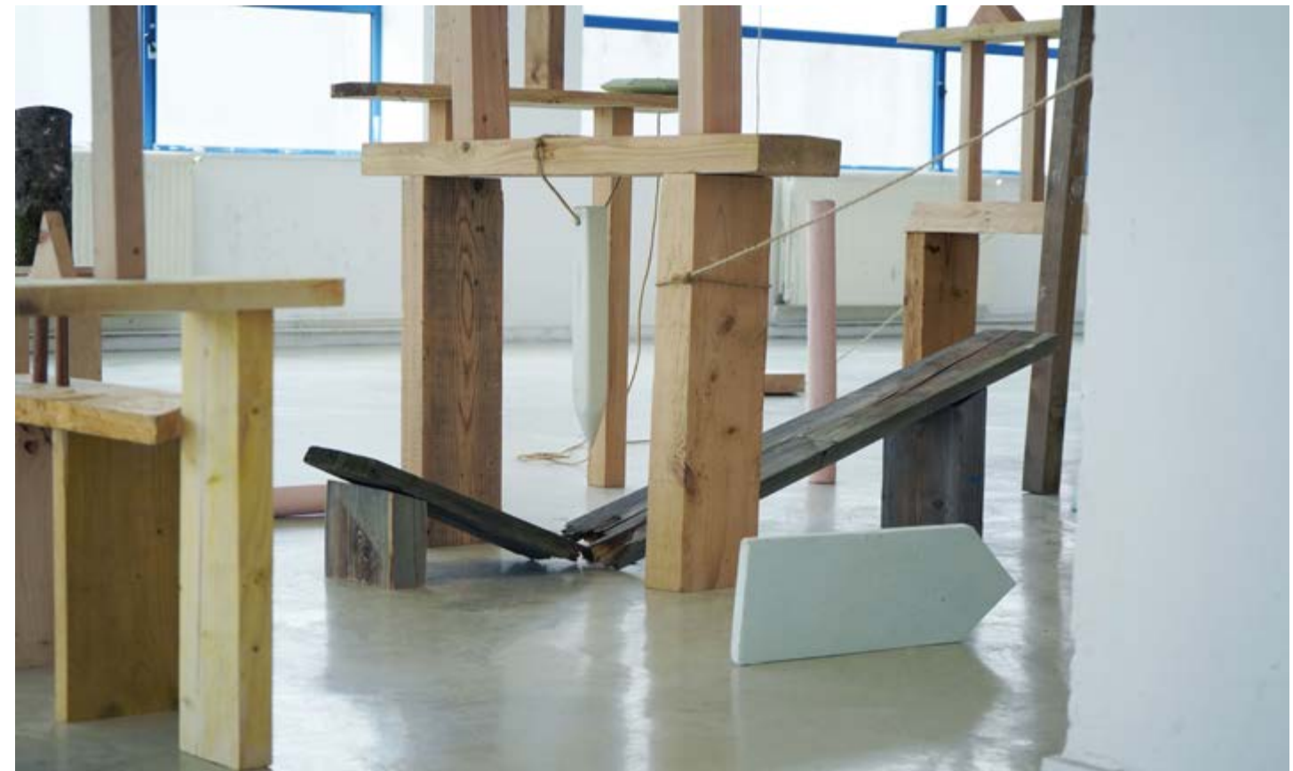
Détail de Chaque chose a sa place