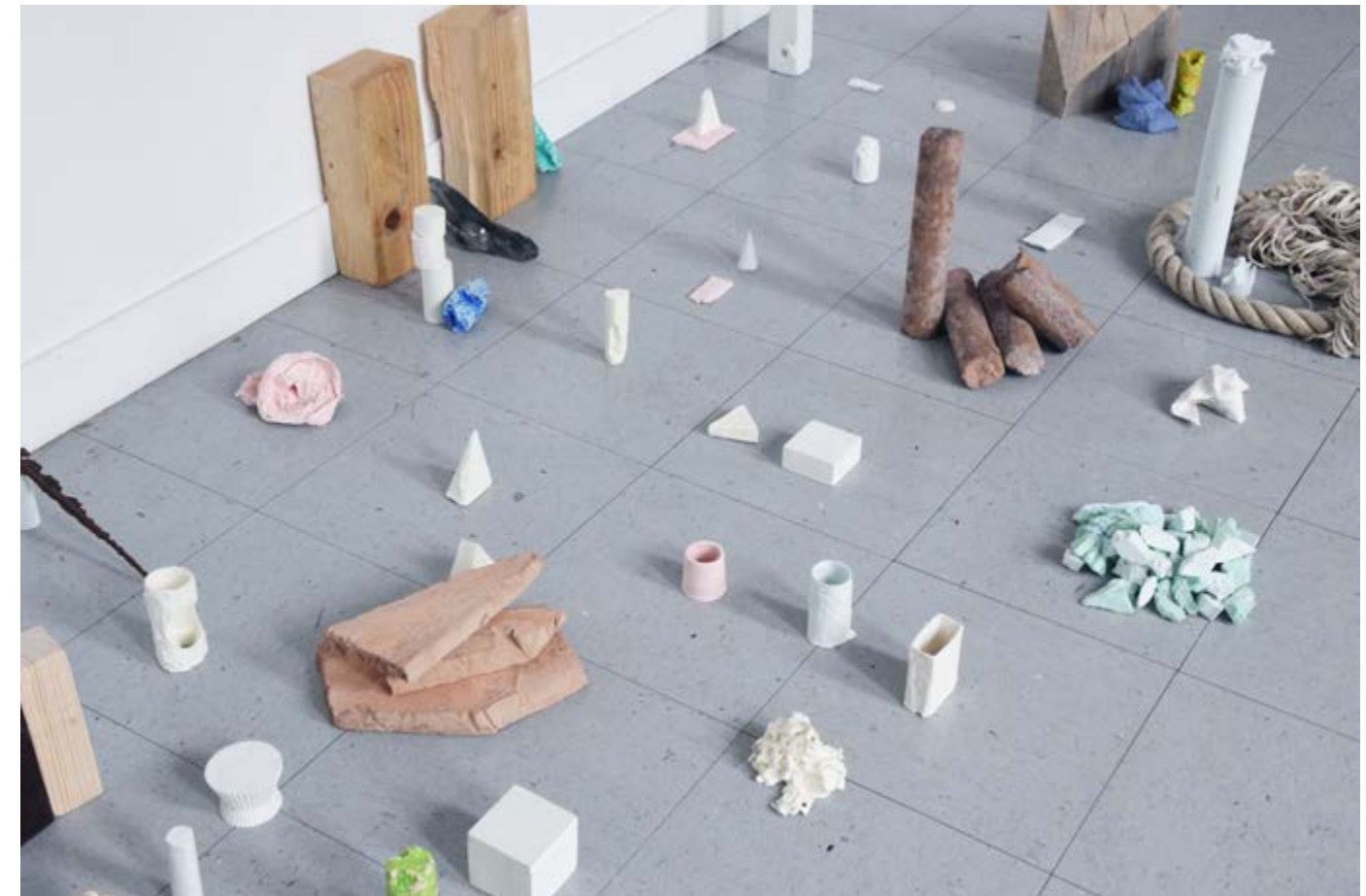
Détails de Cent titres