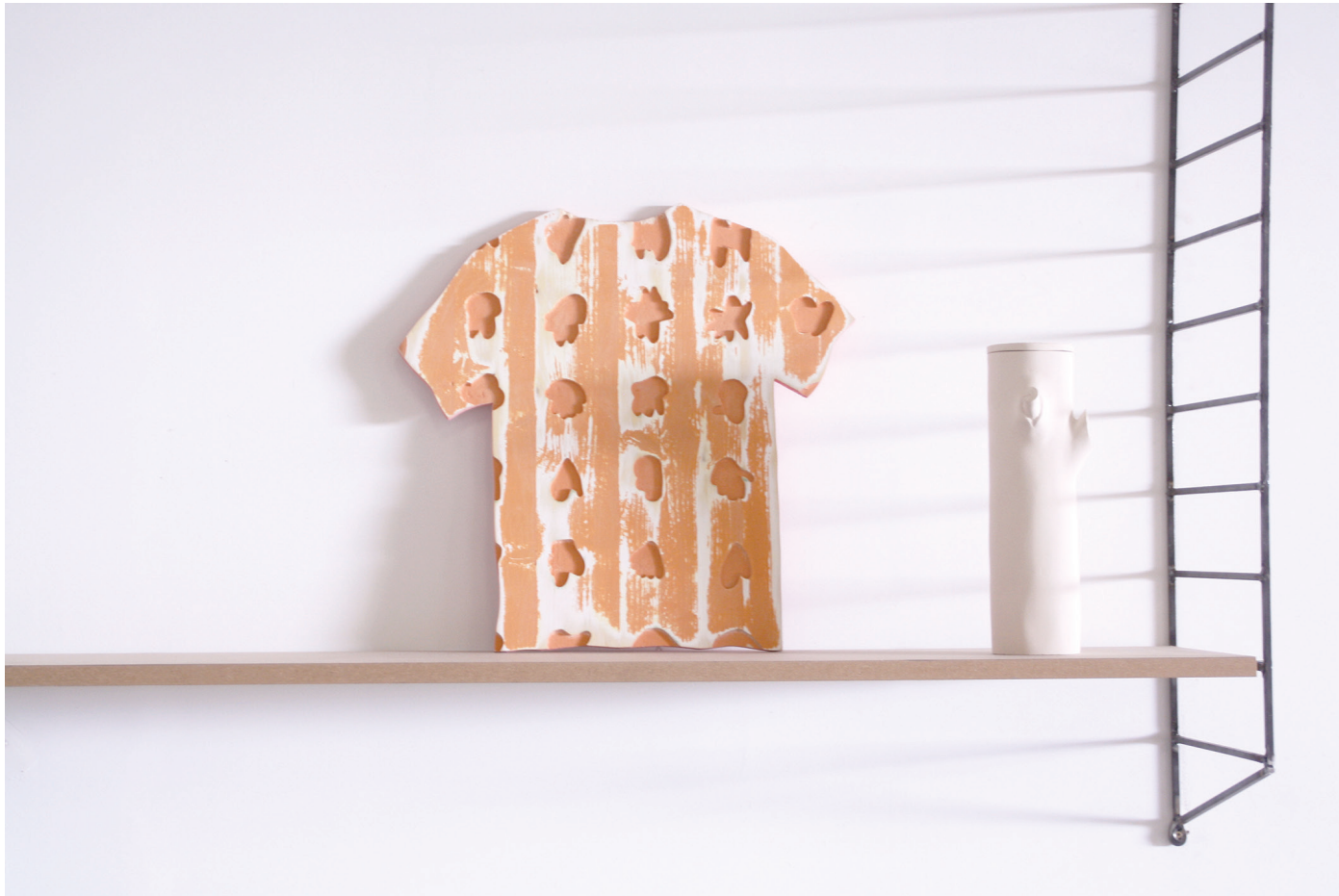
De gauche à droite, T-shirt, 2020, 45x60 cm, bois, peinture acrylique Range-bouteille, 2020, 35x11cm, céramique Production 40mcube