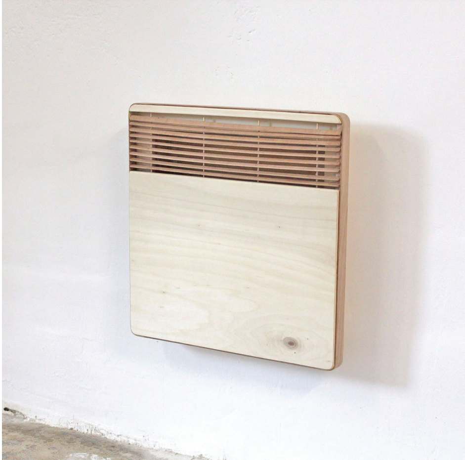
Chauffeur de salle, 2019, 45x45x8 cm, bois contreplaqué Radiateur équipé d'une enceinte diffusant une playlist radiophonique