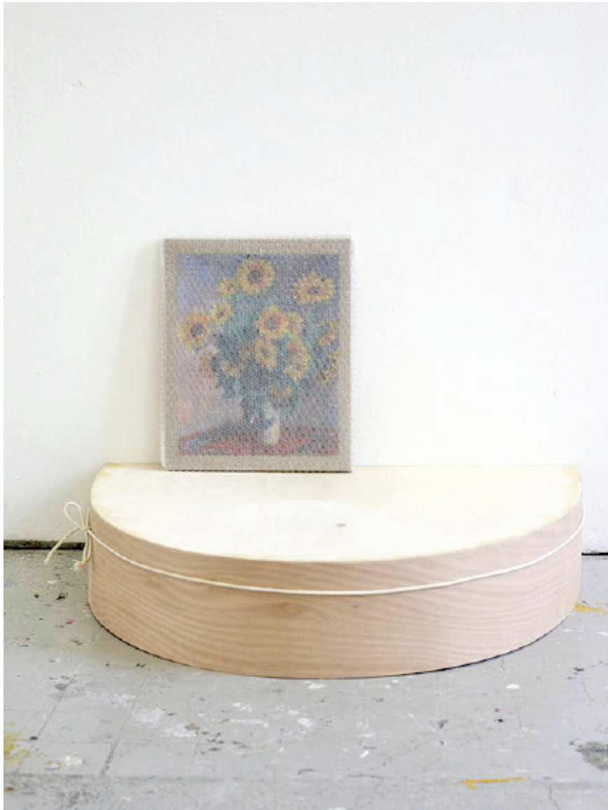
Socle, 2018, 100x50x25 cm, bois contreplaqué, cordelette