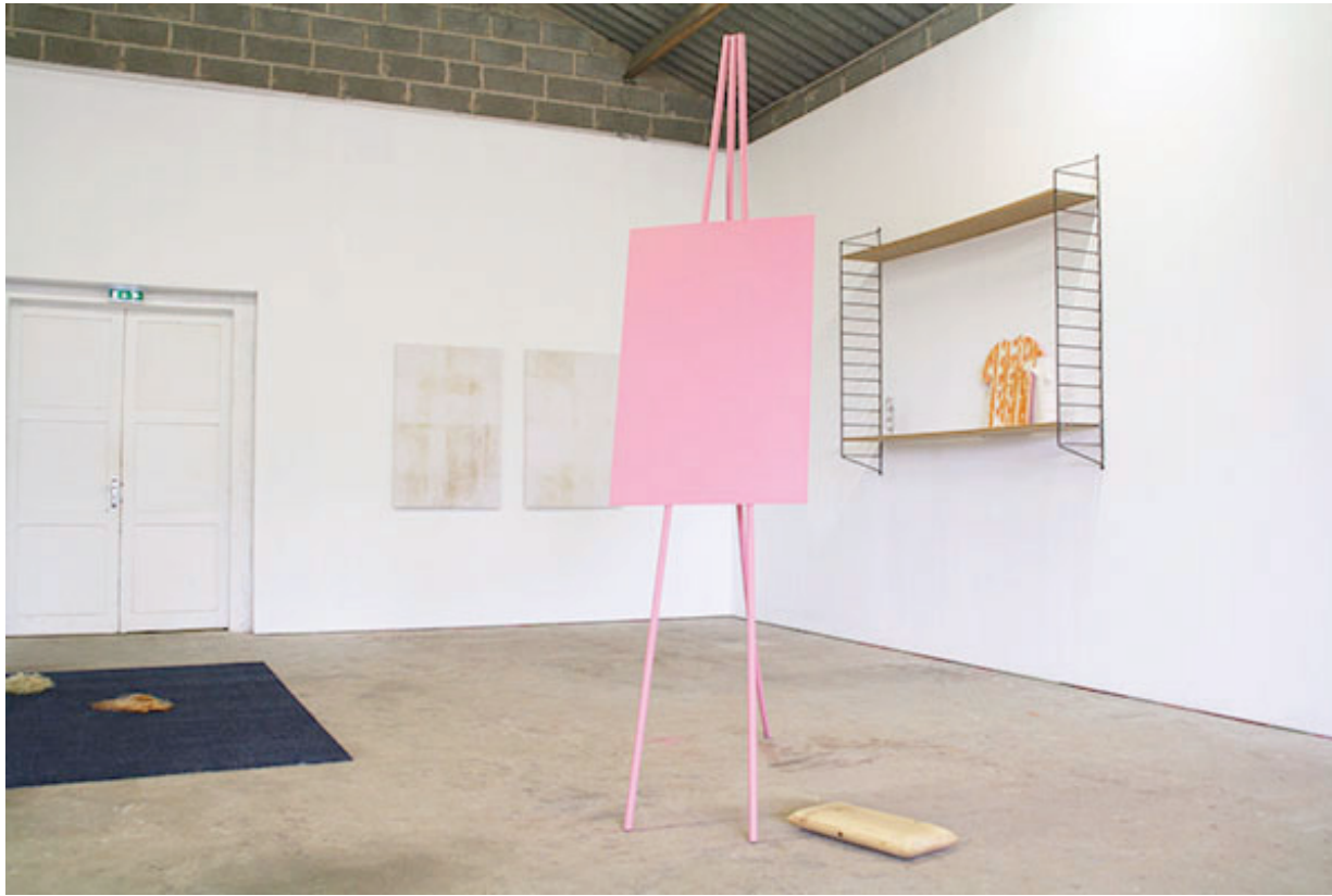
Chevalet rose, 2020 tube acier, tôle acier, peinture acrylique 250 x 140 x 150 cm production 40mcube