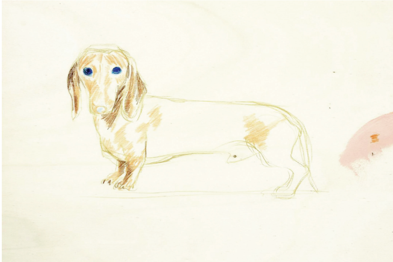
Basset, 2017, 45x55 cm, crayon aquarellable, bois contreplaqué