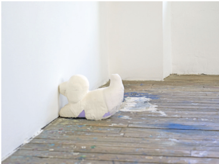
Fève, 2018, 35x15x25 cm, polystyrène extrudé, plâtre