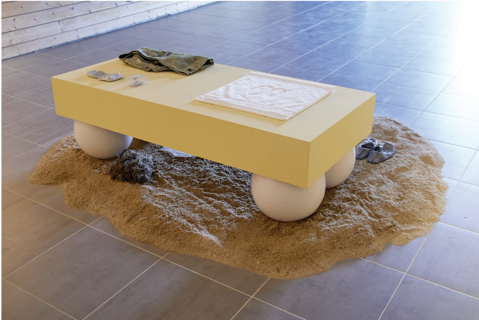
Détail de l'exposition Canapé-sur-Mer, sur l'île Tristan