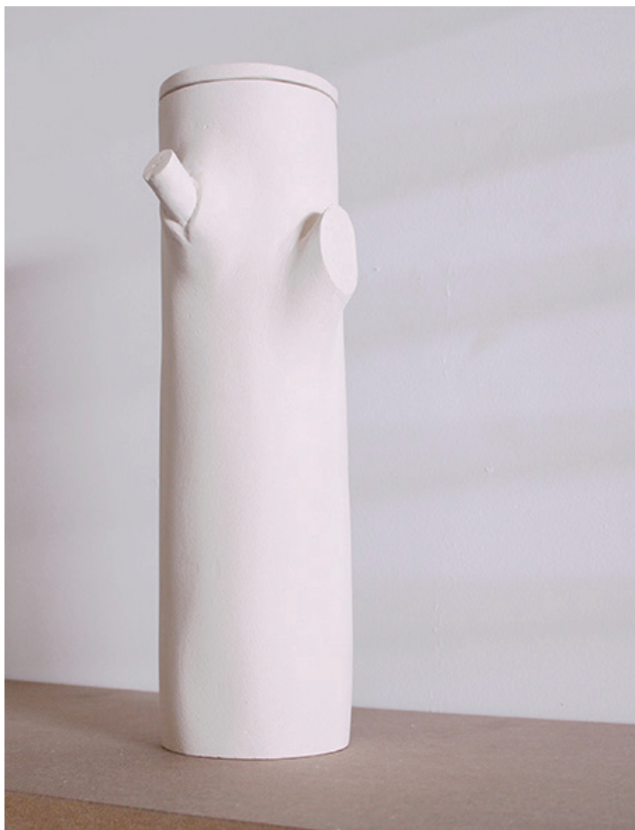
Range-bouteille, 2020, 35x11cm, céramique