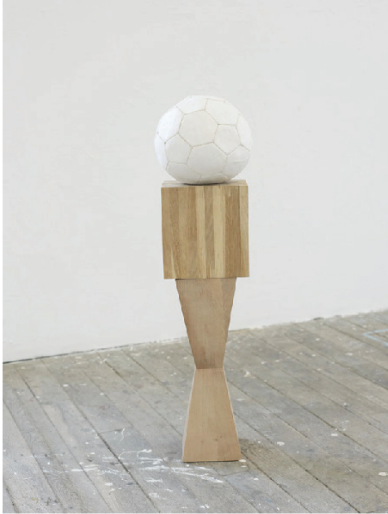
Petit joueur, 2016, 25x25x85 cm, bois de chêne, plâtre