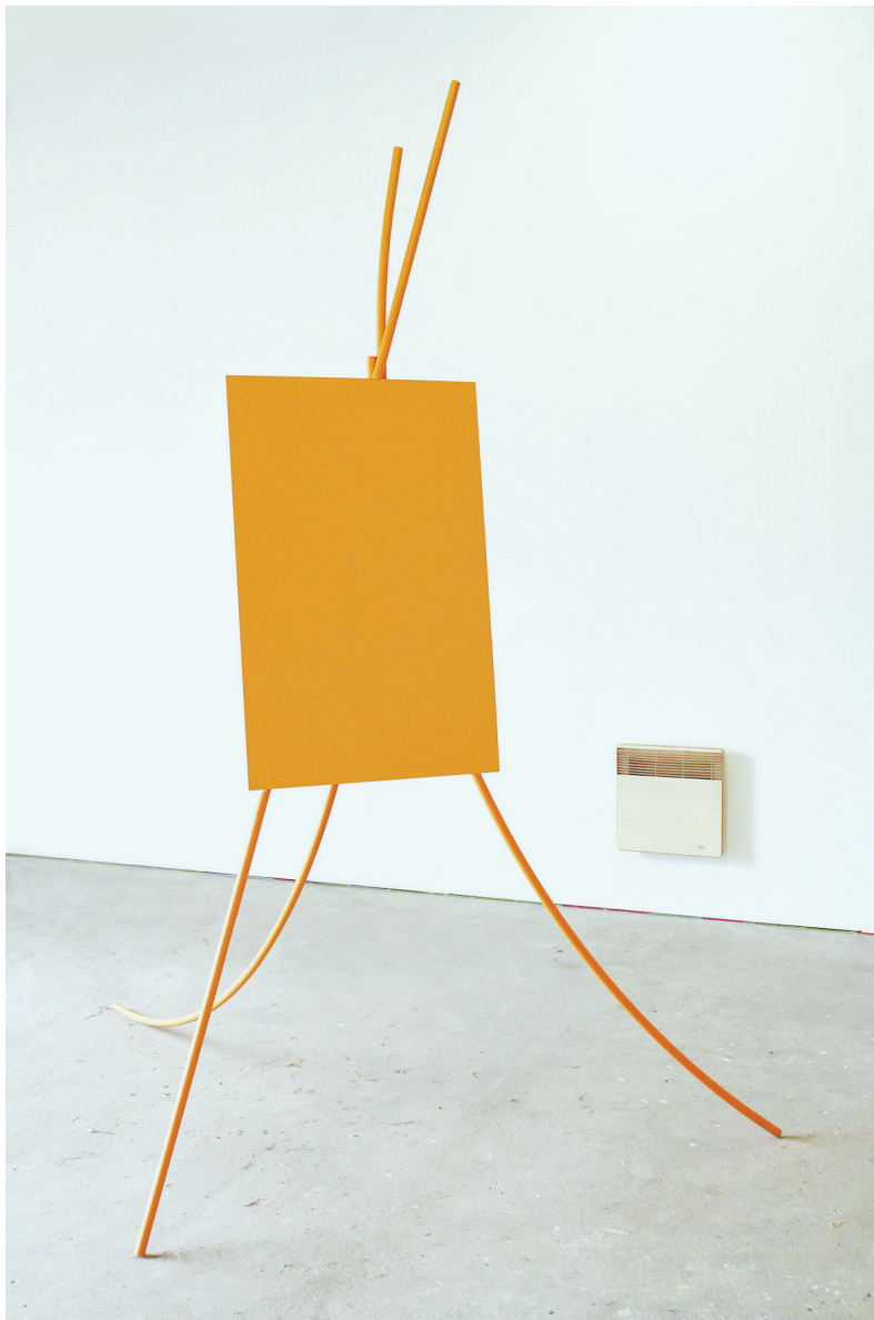
Chevalet orange, 2020 tube acier, tôle acier, peinture acrylique 250 x 140 x 150 cm production 40mcube