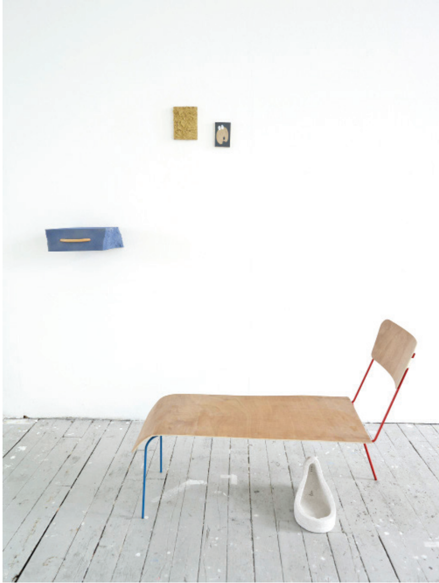
La chambre, installation, 2018, dimension variable, bois cintré, tige métallique, contreplaqué, béton cellulaire, peinture acrylique, pâte à bois, mousse