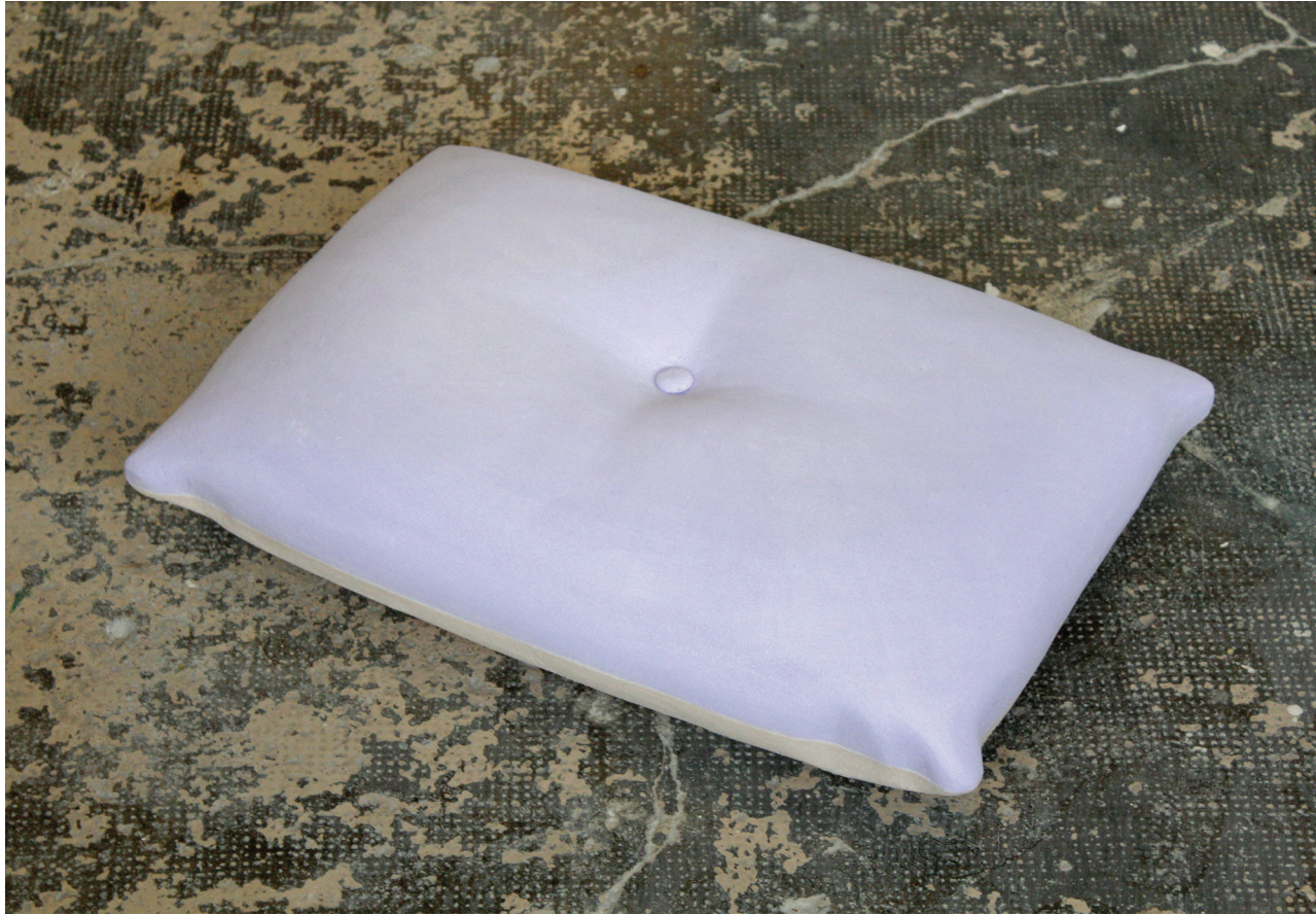
zzZZzzZZzz, 2019, 55x38x15 cm, polystyrène extrudé bicolore