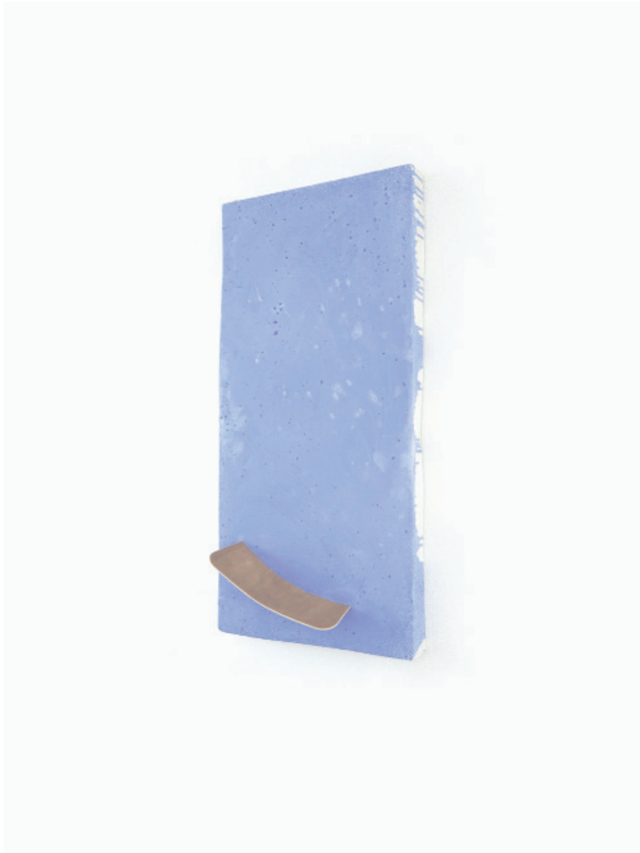
Matelas junior, 2018, 120x60x10 cm, plâtre, pigment, polystyrène, bois cintré