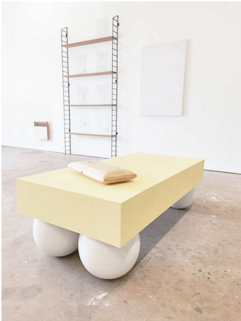
Banc, 2020 contreplaqué, bouées de par-battages, peinture acrylique 140 x 75 x 45 cm Production 40mcube