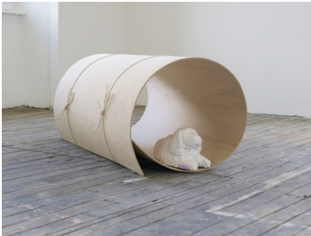
Niche, 2018, 150x90 cm, polystyrène extrudé, plâtre, bois cintrable, cordelette