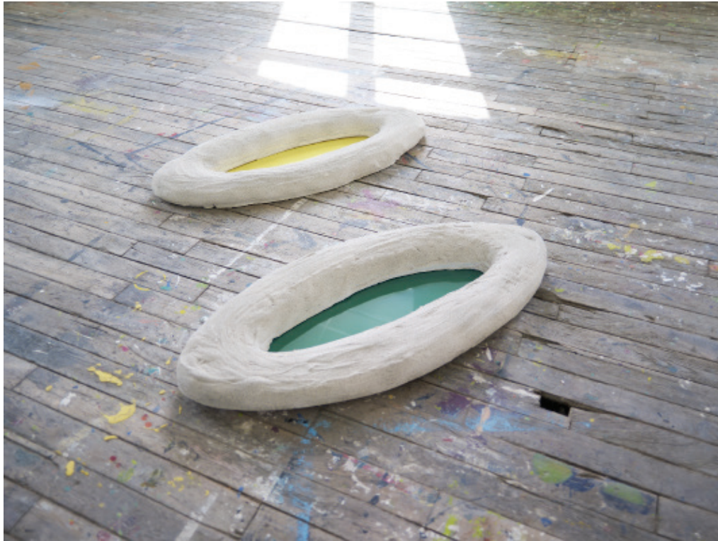
Les barquettes, 2018, 120x70x20 cm (par pièce) polystyrène extrudé, plâtre, aérosol, papier glacé, plexiglas