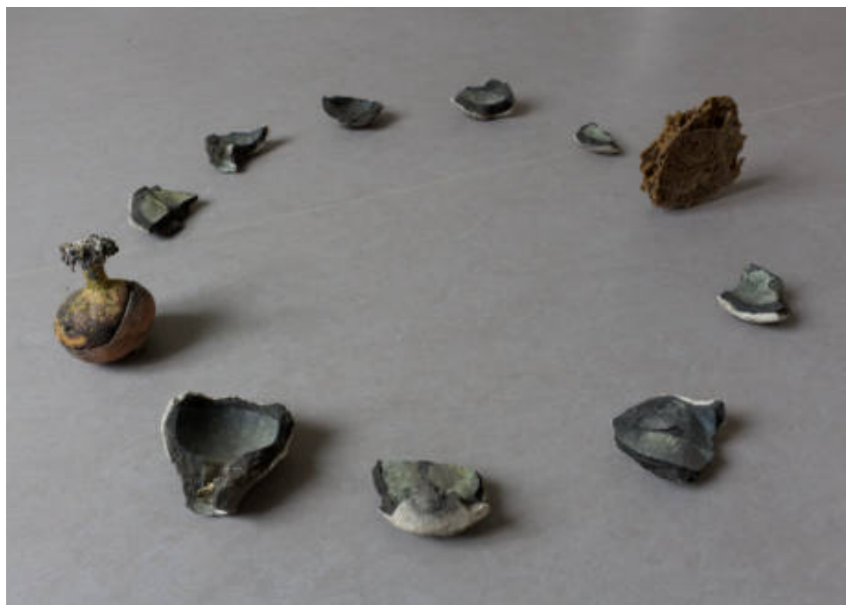
Installation DNA 2019, École Européenne Supérieure d'Art de Bretagne EESAB. Poème associé.

Elle retient le temps. Résiste longtemps. Pourtant. Elle est la vie de demain. Le temps qui avance. Lorsqu'on la met en terre c'est un devenir qui s'annonce. Le passé s'efface. La nostalgie n'a pas court. Existe pour donner jour. Au hasard des formes et des mélanges. Maîtresse de la semence. Protéctrice patiente elle enveloppe la vie au ralenti. Dans l'attente de l'instant choisi. Sortie de la dormance. S'élançe par son centre le nie futur de sa naissance.