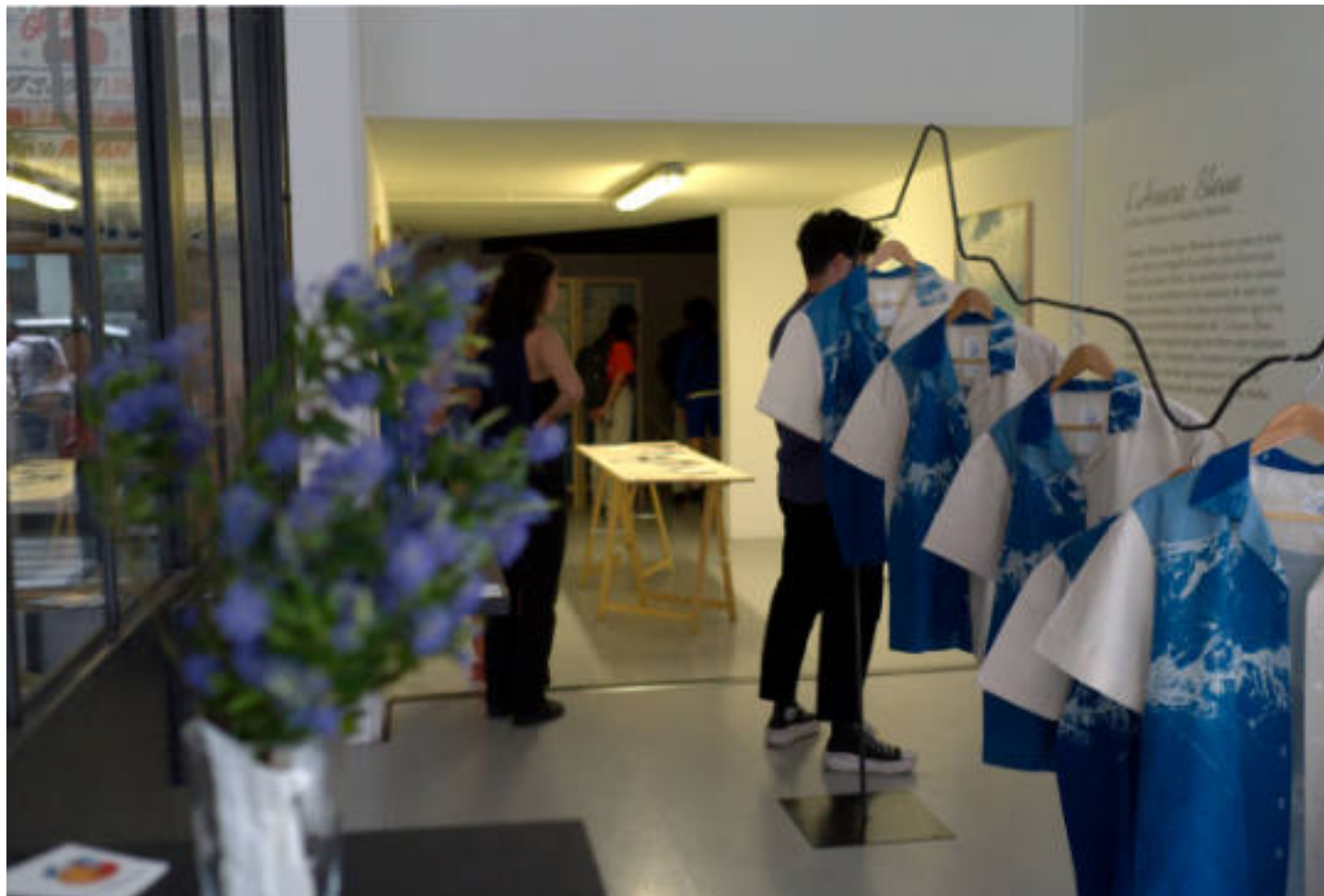
Photo de l'exposition «L'Heure Bleue» à la Galerie Art By Friends, Annecy, 2021.

À partir d'une série de photographies argentiques prises durant l'expédition, nous avons rédigé à quatre mains un récit hybride entre fiction et réalité. De cette histoire va naître des éléments plus tangibles, permettant de projeter le public dans cet univers onirique.