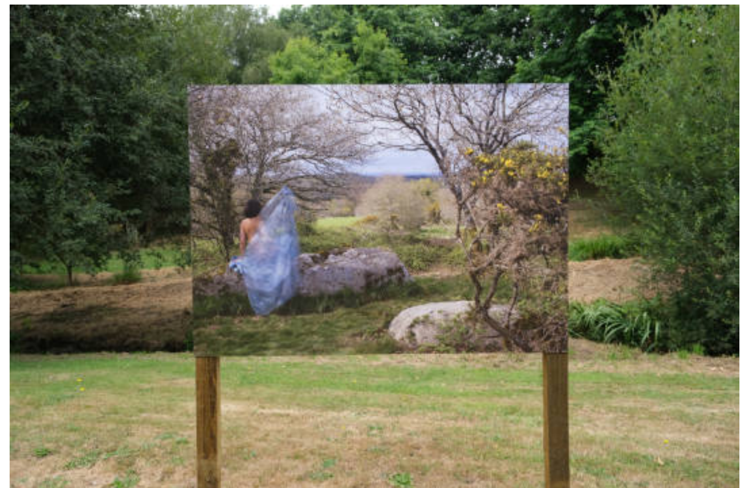
1, 2, 3. Sans titre, issue de la série La légende de Croquélien , photographie sur dibond, 140 x 100 cm, 2022.