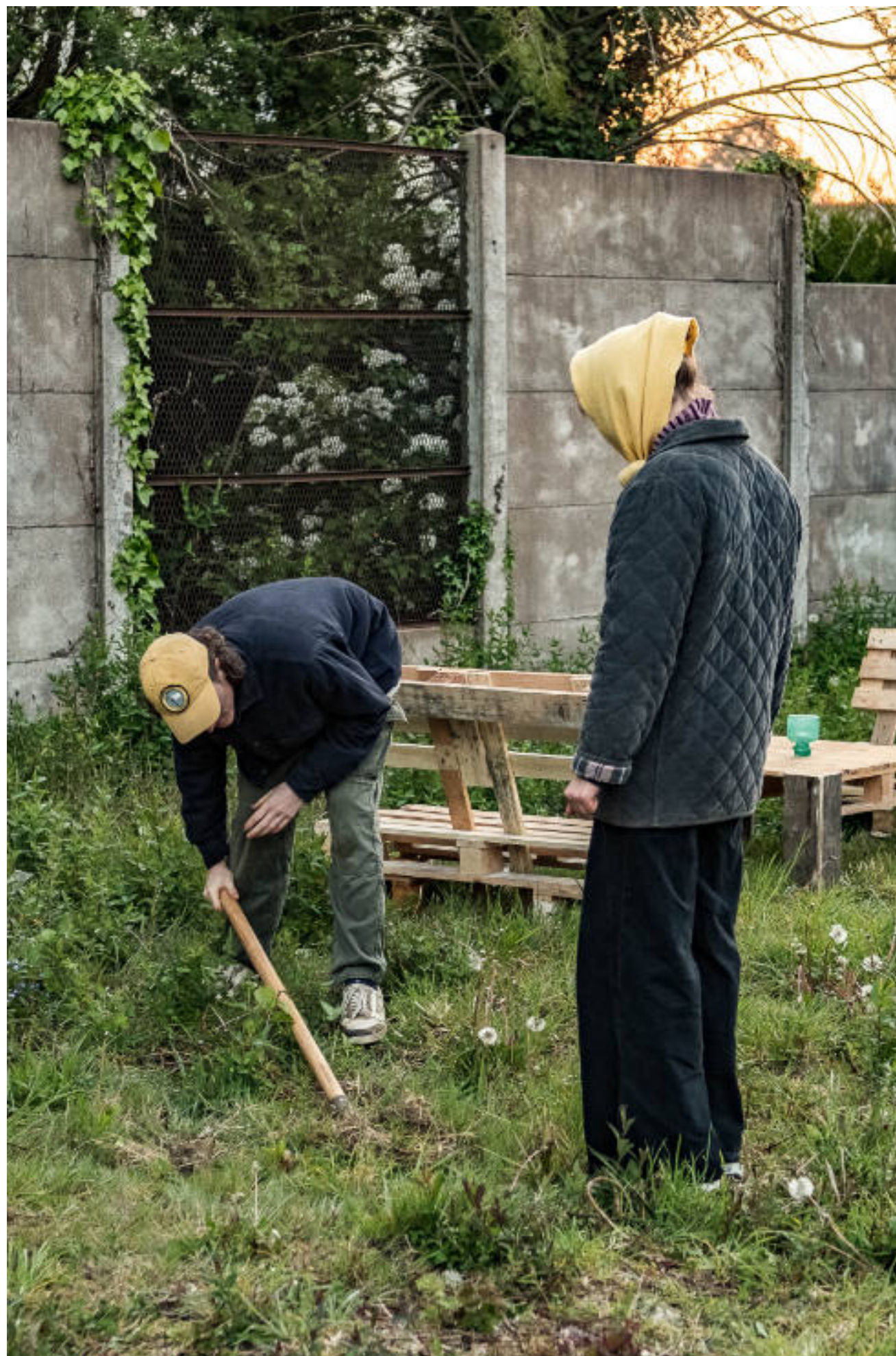
Éclairer, ménager, partager, semer. événement performatif. Ô CORBEAU, 24/04/21 photographié par Malo Legrand.