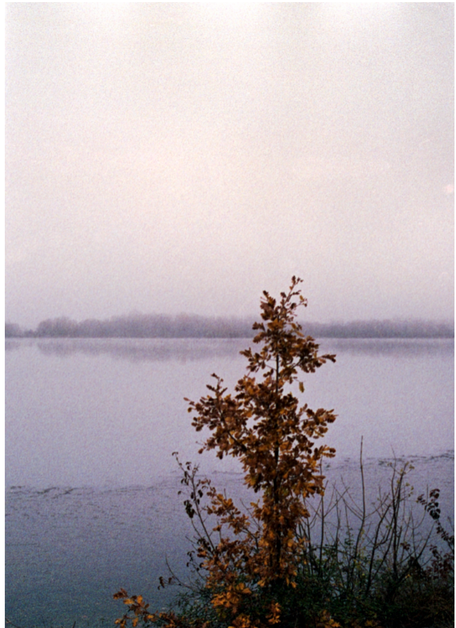
Bord du Rhone, photographie argentique, Coline Dupont 2022.

Diplômée depuis 2021 de l'EESAB site de Rennes, mes projets prennent forme depuis principalement en collaborant avec des artistes, designer·euses, artisan·nes, ou autres rencontres fortuites. La collaboration me permettent de m'impliquer dans une logique relationnelle et de questionner la manière dont nous habitons le monde et créons des histoires communes.