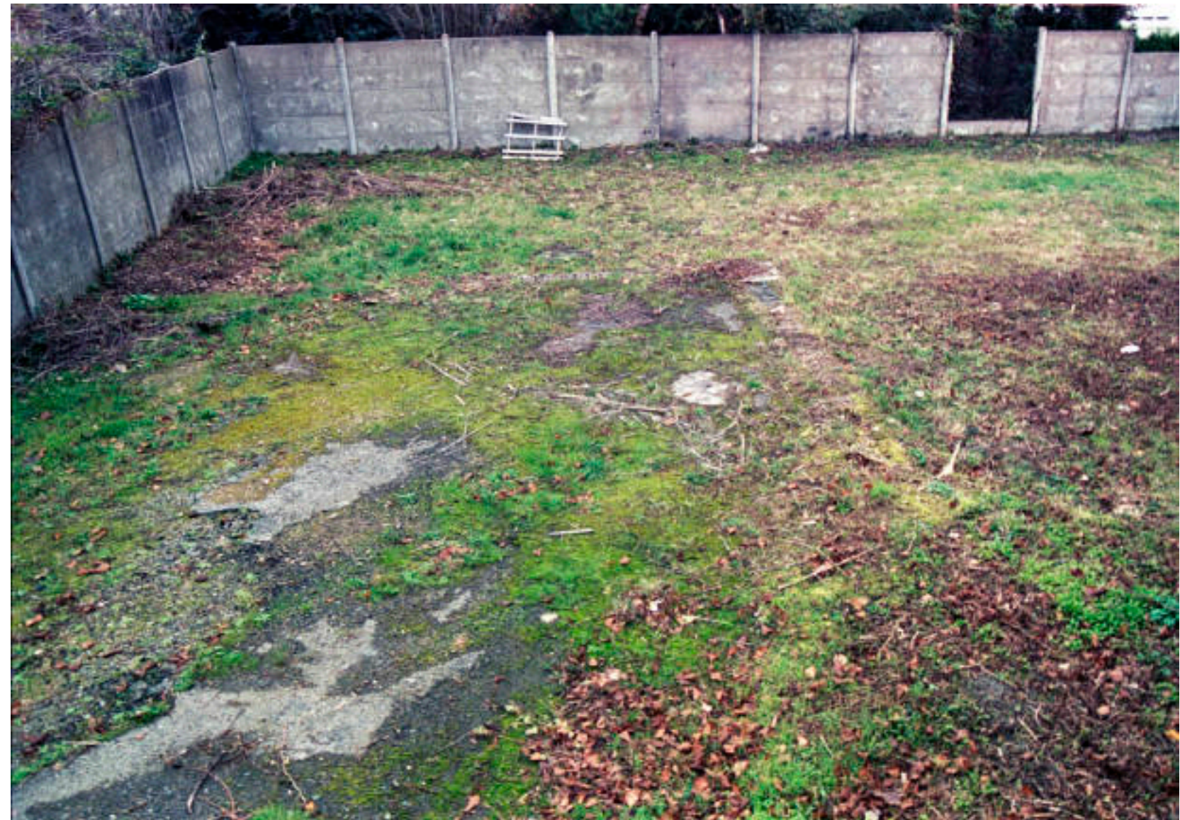
Ô CORBEAU, photographie argentique, Coline Dupont 2021.