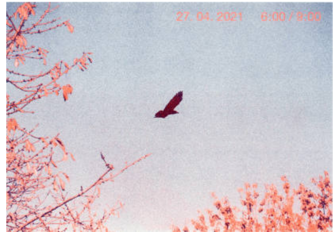
Invitation à l'ouverture du projet Ô CORBEAU, risographie, Coline Dupont 2021.

Depuis Ô CORBEAU, est devenu un espace propice à la rencontre, à l'échange, à la détente et à toute forme d'initiatives créatives.