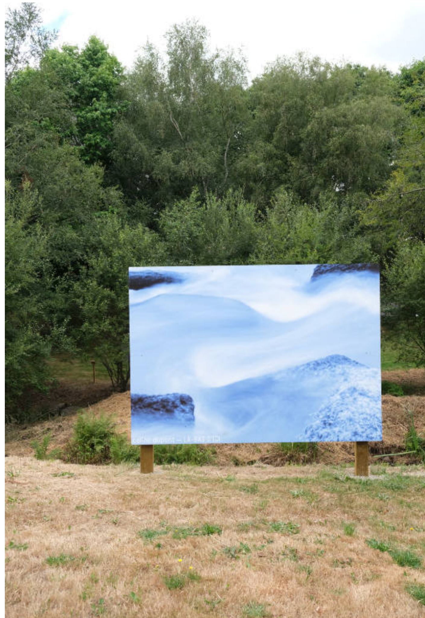
Sans titre , photographie sur dibond, 240 x 200 cm, 2022.

À l'invitation d'Eric Foucault et après selection par des groupes d'habitant-es de trois communes en Centre Bretagne, j'ai travaillé pendant plusieurs mois sur le terrain autour de trois thématiques choisies par elleux : L'eau, l'arbre et de la terre à l'assiette ; le cochon. De ces échanges et rencontre sont nés un conte titré La légende des trois cycles et trois série de photographies présentées insitu.