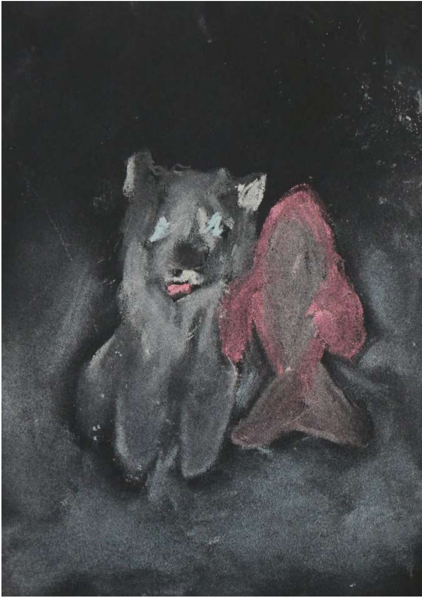
Flashes - série de dessins, papier noir A5, pastels secs, 14,8x21cm, 2022

Dans le creux de ses mains, au détour d'une promenade, Clara Agnus aime cueillir la terre et les fleurs, le sable et les algues. Dans l'intimité de l'atelier, au contact de l'eau et d'autres fluides cireux ou siliconés, elle aime les associer et les recomposer, fondre leurs matières et leurs couleurs pour créer de nouveaux corps, aussi liquides que les identités venues s'y incarner. Dans ses sculptures et ses collages aux couleurs pastel vibrent des sensations et des incertitudes, de la douceur et de la fragilité, collées, moulées ou façonnées ensemble pour les faire tenir, et les rendre solides.