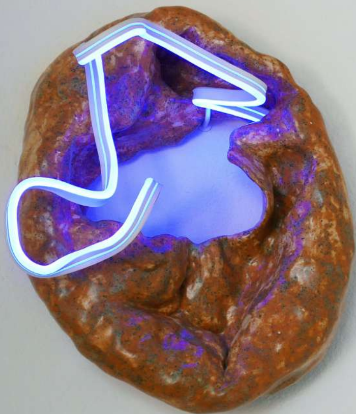
Sans titre , faïence émaillée, néon, 50 x 40cm, 2022