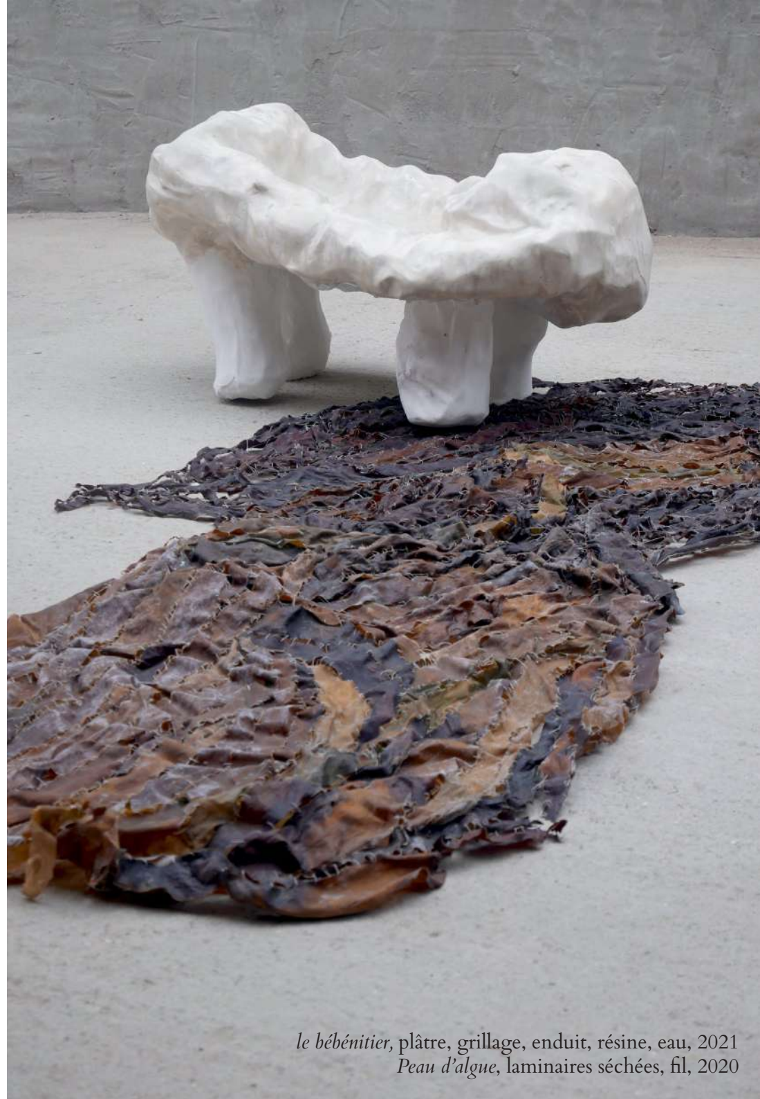
le bébénetier , plâtre, grillage, enduit, résine, eau, 2021 Peau d'algue , laminaires séchées, fil, 2020