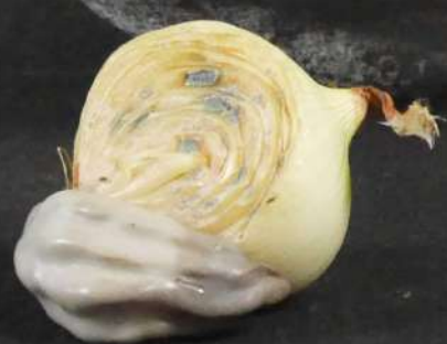
Être oignon, grillage, papier maché, résine, guirlande lumineuse, main en faïence et cire et oignon en décomposition, h70cm, 2021