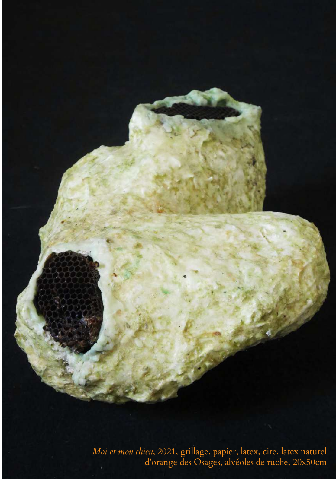
Moi et mon chien , 2021, grillage, papier, latex, cire, latex naturel d'orange des Osages, alvéoles de ruche, 20x50cm