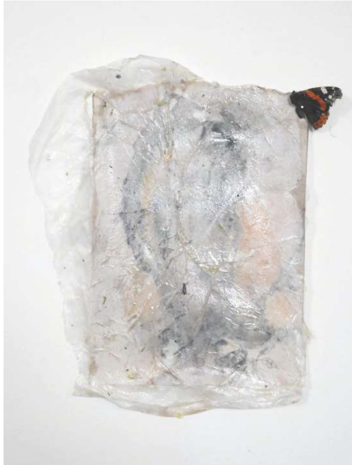
Licking the ocean , 2021, papier, aquarelle, papier de soie, résine, papillon, 5x21cm