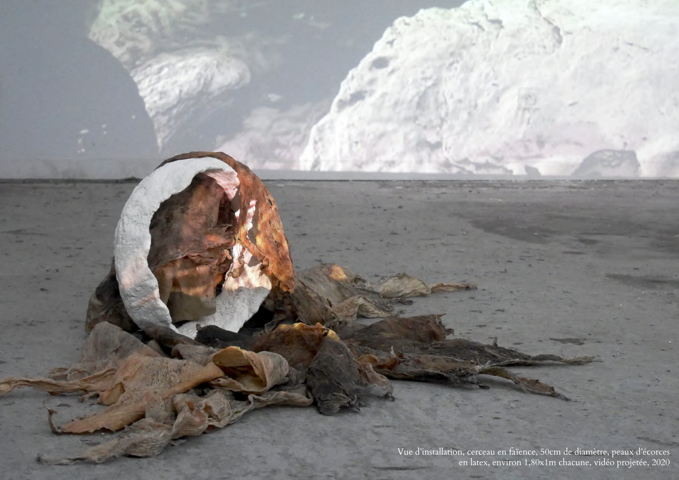
Vue d'installation, cerceau en faïence, 50cm de diamètre, peaux d'écorces en latex, environ 1,80x1m chacune, vidéo projetée, 2020