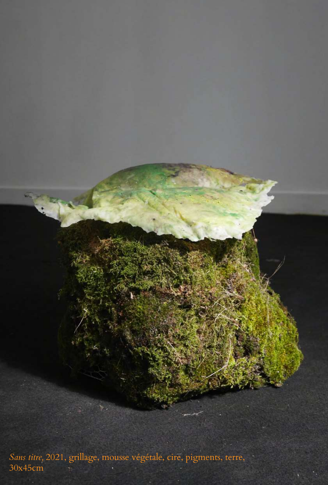
Sans titre , 2021, grillage, mousse végétale, cire, pigments, terre, 30x45cm