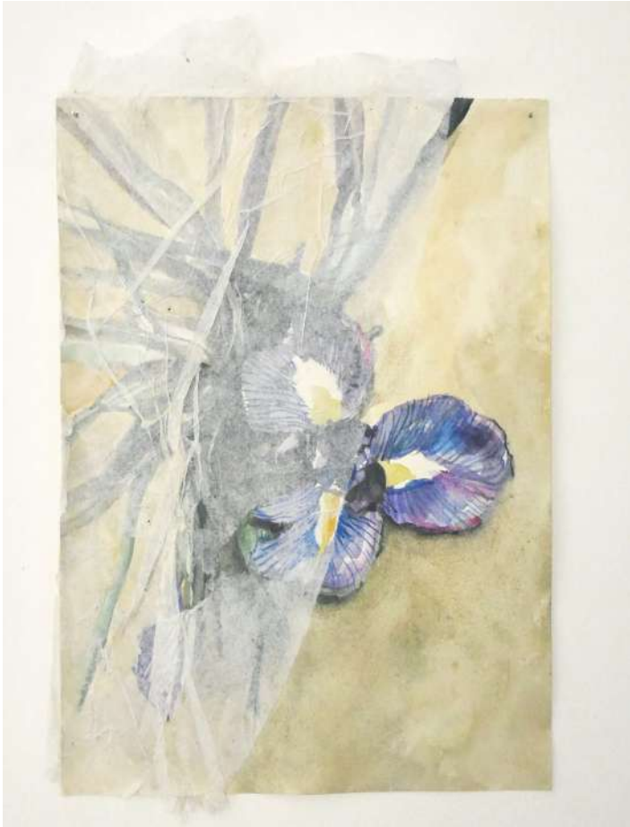
Dreams less sweet , 2021, papier, aquarelle, papier de soie, 20x30cm