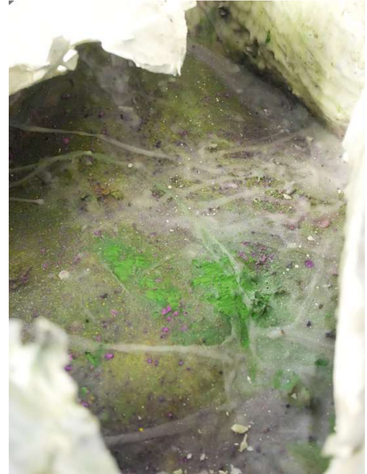
Détail, papier, pigments, terre, mousse végétale, cire, acrylique