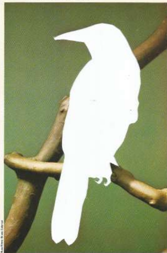
Le cacique de Montezuma, Gymnostinops montezumae .