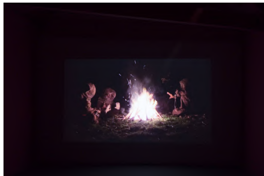
Les âges farouches , Vidéo, 12 min, Atelier d'Estienne, Pont-Scorff, 2019