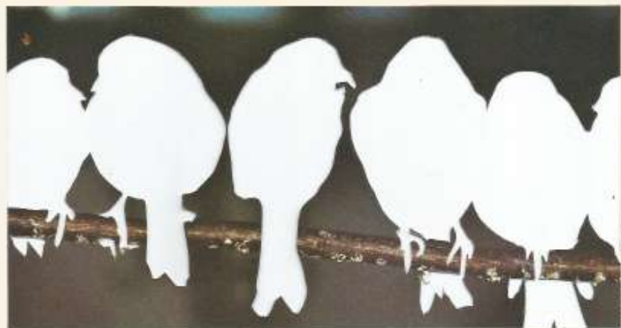
Yvettes de canari.