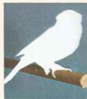
▲ Yvettes de canari domestique à tête ruppée. ▼ La reproduction sélective du canari sauvage a également produit l'espèce jaune fanétrie.