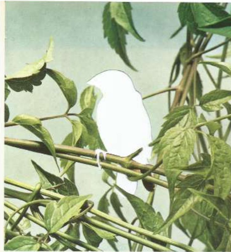
Diamant à poitrine orange, Neisna subflava.

Images découpées d'encyclopédies animalières < 12 x 32 cm > 2019