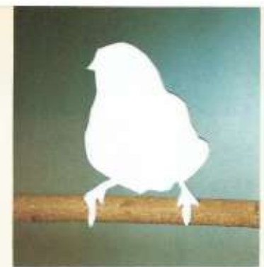
▲ Variété blanche du diamant mandarin.