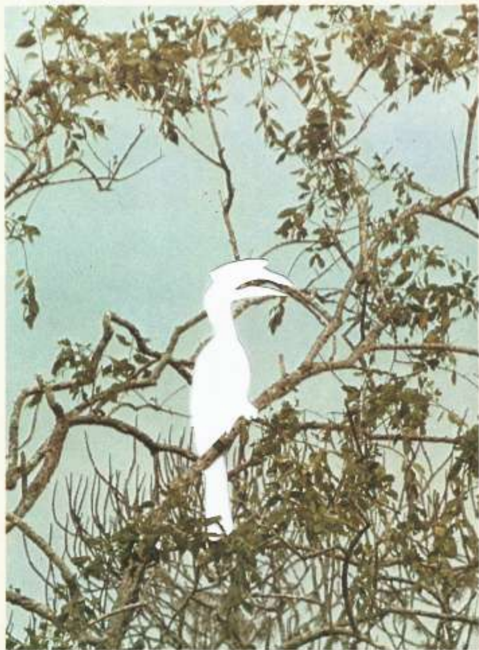
▼ Mâle du grand calao, Anthracoceros coronatus.