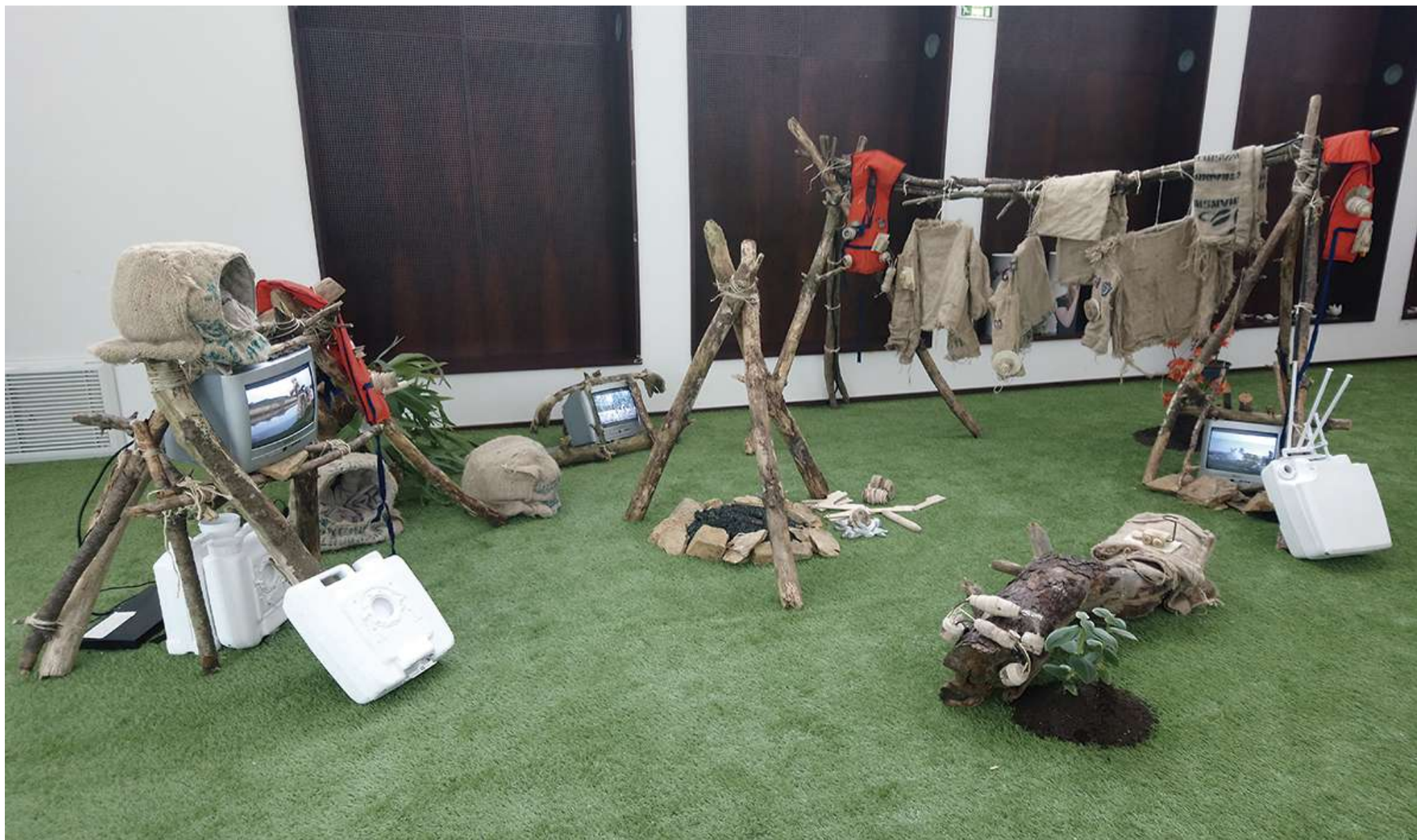
Vue de l'installation Les âges farouches , Festival Eldorado, Théâtre de Lorient, 2019