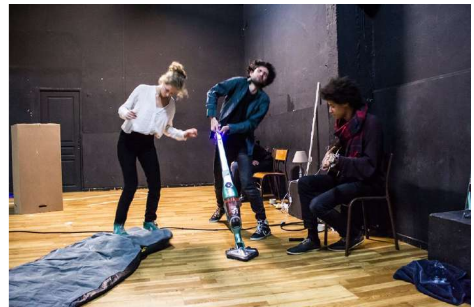
The Marcel , Quartier Gare, Montpellier, 2020